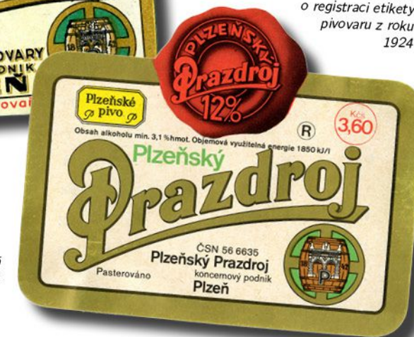
Etiketa používaná v letech 1981–1984