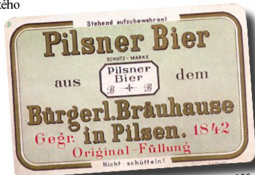
Etiketa z roku 1896

Po celé 20. století si etikety Plzeňského Prazdroje uchovaly v zásadě stejný vzhled, od roku 1899 byly doplňovány rakouským znakem, od roku 1920 československým. V roce