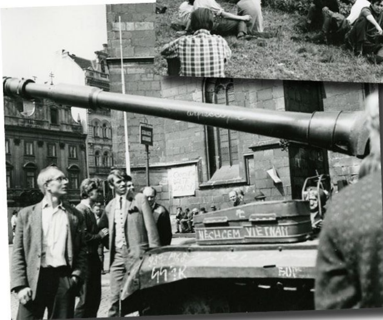
Snímky ze srpna 1968, uložené v městském archivu.

Ta obsahuje výtisky rozličných periodik z doby příchodu sovětských vojsk a krátce poté. Jedná se nejenom o deníky Pravda či Svobodné slovo, ale také časopis Index, vydávaný plzeňskými vysokoškoly, Tulák, vydaný místními trempy, a mnohé další. Kromě toho je zde i uložena řada protiokupantsky mířených letáků, ale také několik