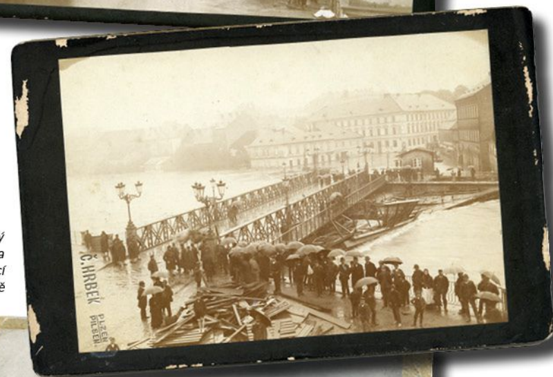
Pražský most U Jána odolávající velké vodě