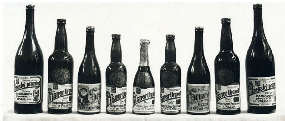
Fotografie prvorepublikových lahví s etiketami, kolem roku 1928

1900 získal pivovar právo užívat znak města Plzně, který se na etiketách zobrazuje od roku 1908. O sedm let později se v záhlaví etiket začala objevovat pečeť zapsaná jako samostatná ochranná známka již v roce 1913, až se na dlouhou dobu stala jejich trvalou součástí. Podobně byla v roce 1926 zapsána kruhová známka „sud s bránou“. Po roce 1945 zmizely z etiket znaky, místo nich se objevilo zmenšené vyobrazení kruhové známky. (peř)