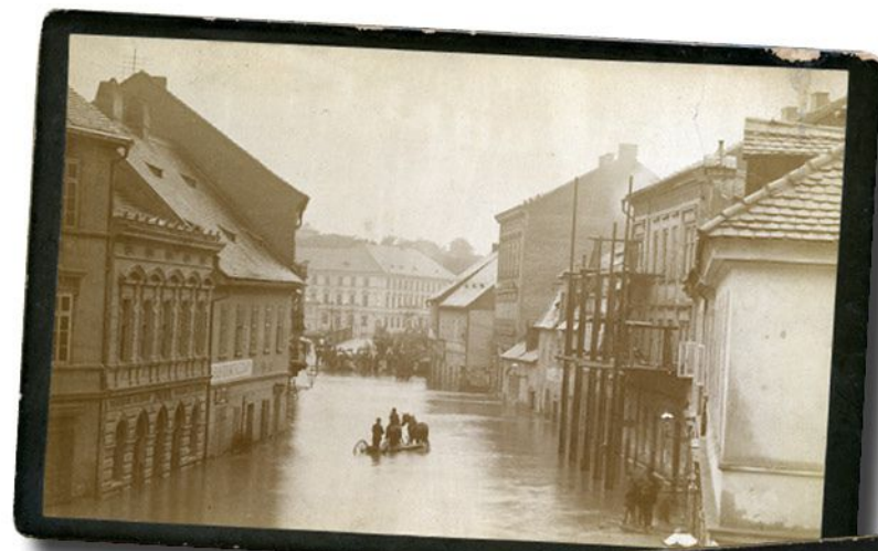
Fotografie Čenka Hrbka z Poděbradovy (Pražské) ulice