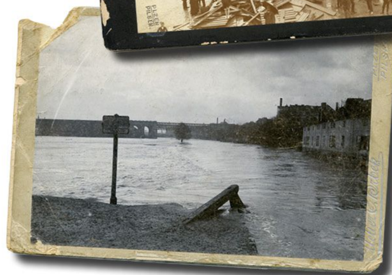
Povodeň na Radbuze, v pozadí železniční most