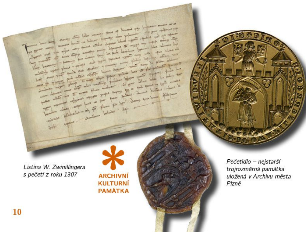
Listina W. Zwinilingera s pečetí z roku 1307

Výše zmíněná listina není zajímavá pouze prvním dochováním městské pečeti, ale odkazuje i na to, že se v Plzni již na počátku 14. století vařilo pivo, jelikož jmenovaný plzeňský měšťan odkázal kostelu sv. Bartoloměje pivovar a sladovnu. (fan)