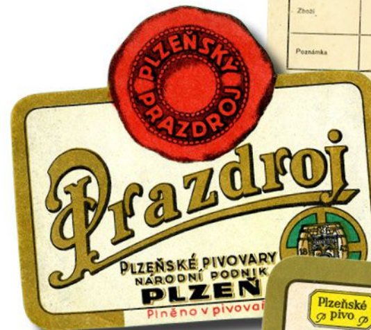
Etiketa Prazdroje z let 1946–1950