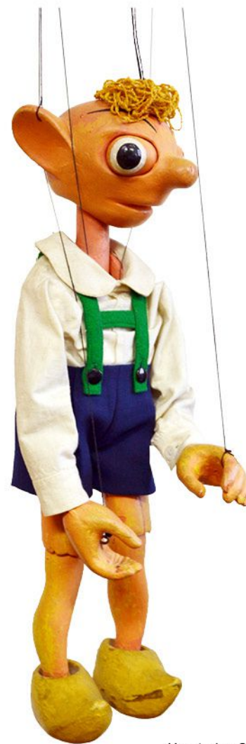
Hurvínek a Spejbl