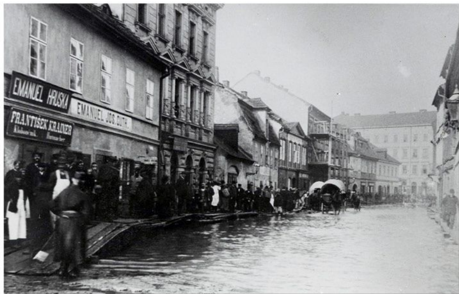
Povodeň v roce 1890 v Poděbradově (dnešní Pražské) ulici

Kromě tohoto obrazového materiálu je v Archivu města Plzně dochováno také několik písemností dokumentujících povodeň. Jsou zde například seznamy osob, jež konaly hlídky v povodňových oblastech, ale také spisy o poškozených bytech a žádosti o výpomoc postiženým potopou. (fan)