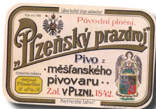
Etiketa z roku 1908