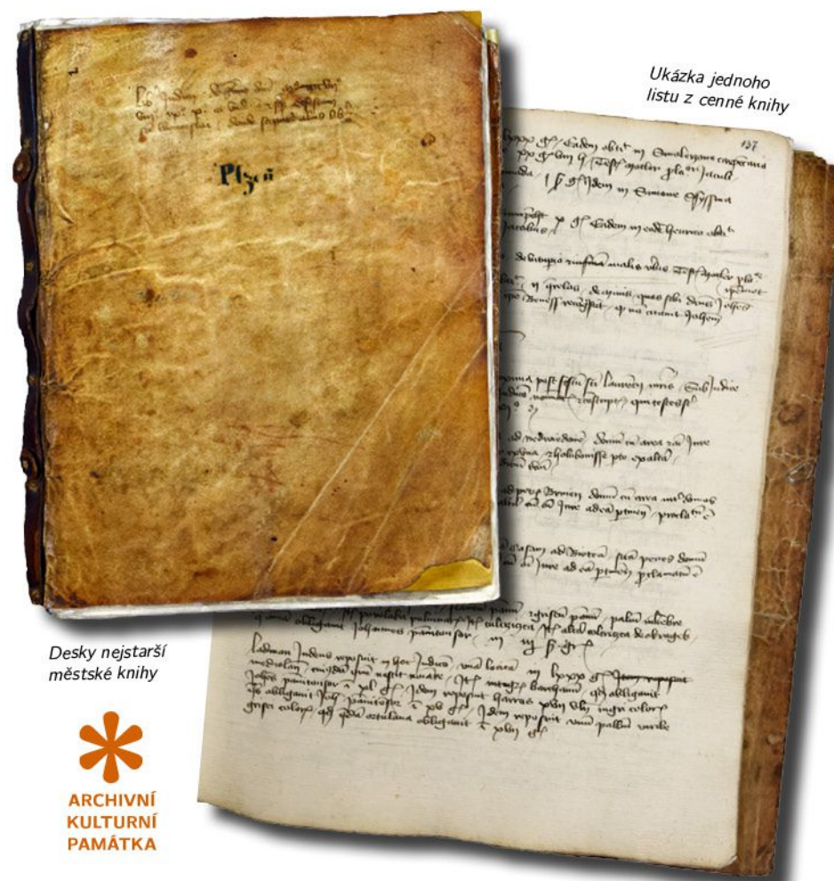
Ukázka jednoho listu z cenné knihy

Rukopis o rozměrech 22 × 29,5 cm se 154 stránkami sloužil pro zapisování soukromoprávních záležitostí měšťanů a obyvatel Plzně i jejich vesnic. Kniha tak obsahuje rozličné latinsky psané převody nemovitostí, dlužní zápisy či záznamy o zastavování movitých předmětů a jejich opětovném vyplácení. Kromě toho se v ní nacházejí i zápisy trestního charakteru. (fan)