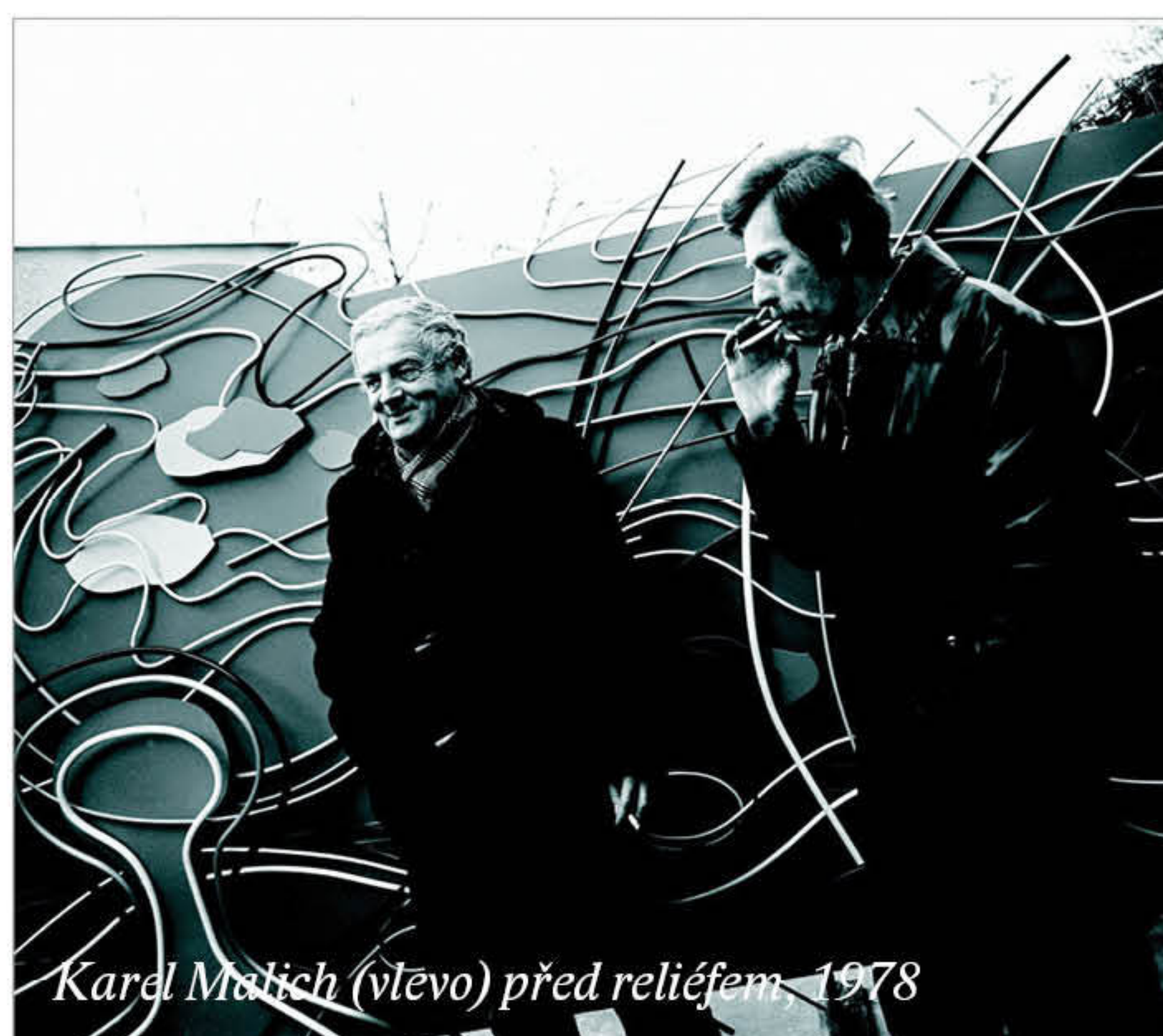
Karel Malich (vlevo) před reliéfem 1978

Mnozí ale při spatření plastik Karla Malicha nevěřicně zírají, neboť nejde o klasické obrazy či sochy, ale o současné, pro mnohé nepochopitelné umění. Platí to i v případě díla nalezeného na vysokoškolských kolejích v Bolevci. 3 × 1,5 metru velký abstraktní plastický reliéf se vymyká všemu, co se v Plzni ve veřejném prostoru či veřejných budovách dá vidět. Z reliéfu trčí barevné dráty a sem tam na modré obloze poletují snad mráčky. V nadsázce bylo dílo zprvu pojmenováno jako „Okluzní fronta“. Později se ukázalo, že oficiální název dílo nemá. Meteorologické pojmenování ale nebylo tak daleko od pravdy, Karel Malich totiž často zobrazoval živly kolem sebe. Stylizovaná figurka uprostřed znázorňovala jeho samého.