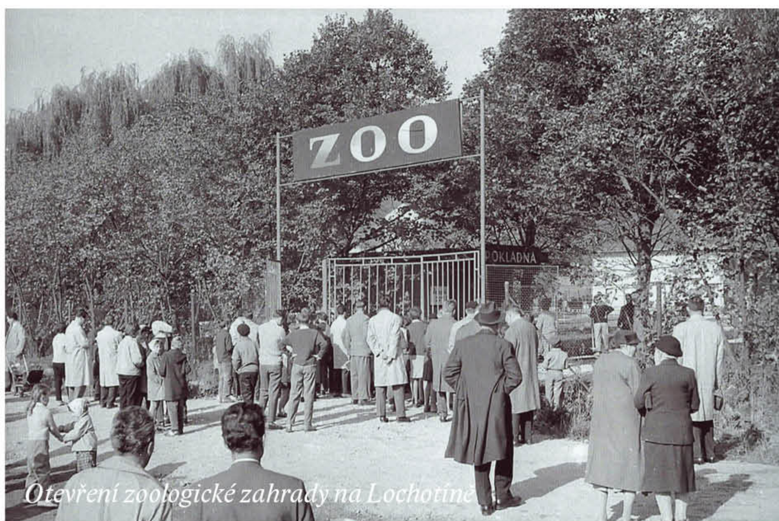
Otevření zoologické zahrady na Lochotíně

Než si však Plzeňané mohli zajít za zvířaty do nové zoologické zahrady, uběhly skoro dva roky. S novou zahradou se sice počítalo už dávno předtím, ale projekt byl dlouho odkládán. Epidemie antraxu vše ještě zhoršila – uhynula zvířata, se kterými se počítalo do nové zoo, a nákup nových podstatně zvyšoval náklady.