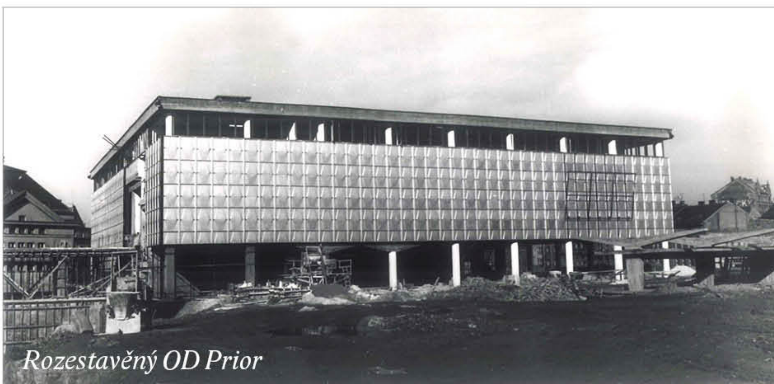
Rozestavěný OD Prior

Až do konce šedesátých let v Plzni chyběl větší obchodní dům. Do té doby se museli Plzeňané spokojit s obchody v bývalých domech Brouk a Babka či ASO. Ty sice byly stále velice oblíbené, ale pro svoji dobu