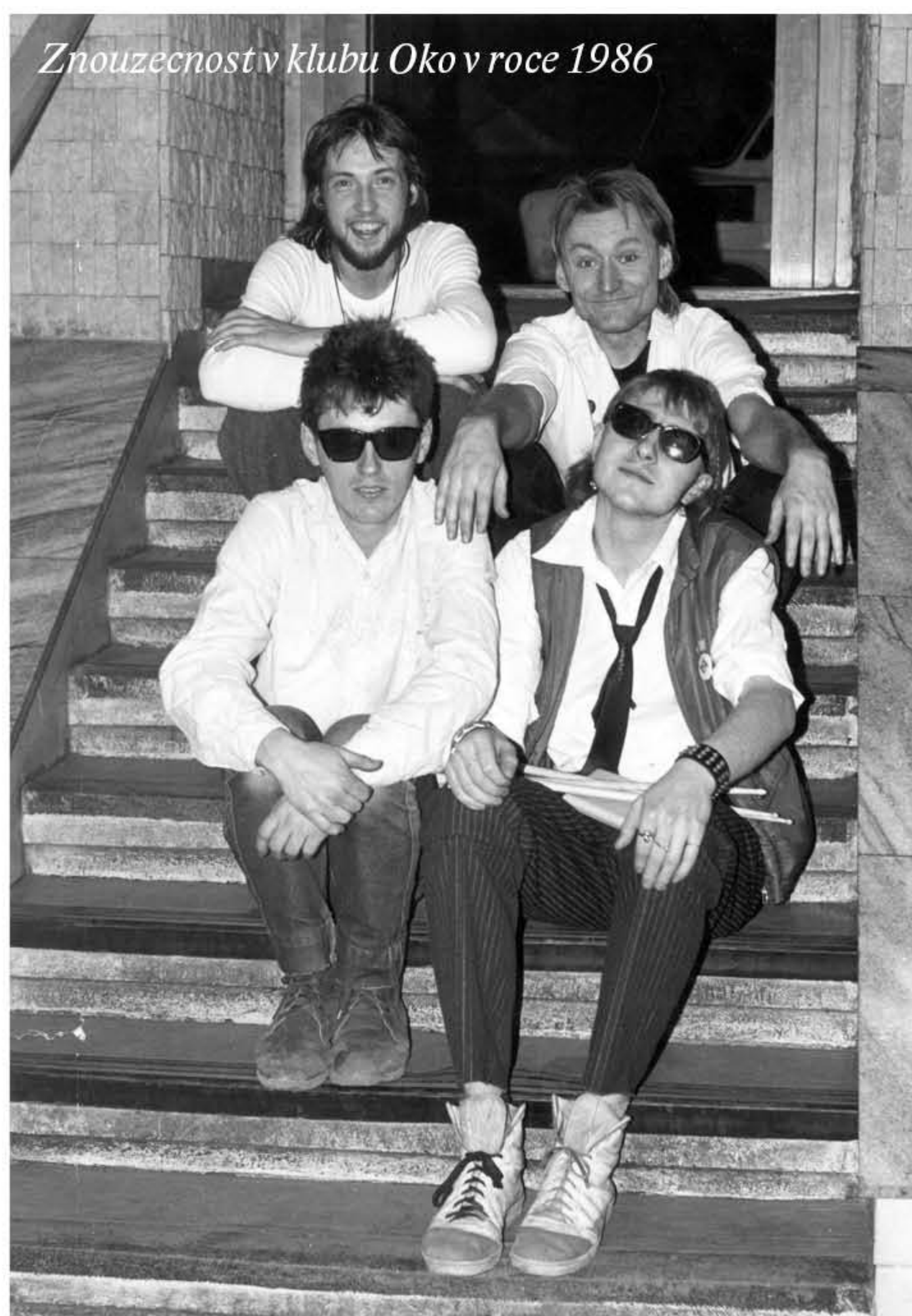
Znouzectnost v klubu Oko v roce 1986

Skupina, která vedla nad svými konkurenty v délce vlasů, byl Bumerang. Nebyly to ale jen vlasy, kterými hoši z Bumerangu zabodovali u posluchačů. Jejich hudební