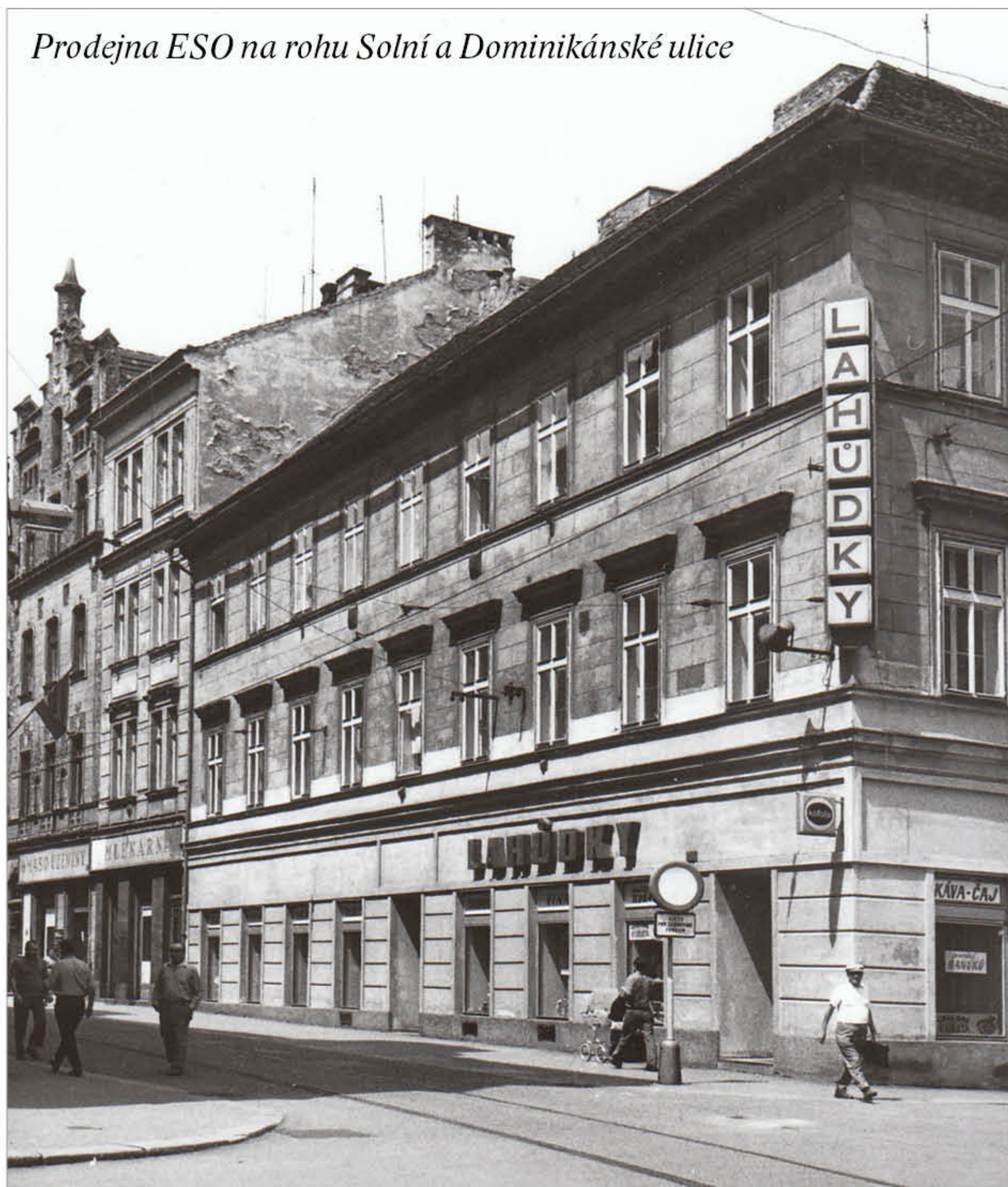
Prodejna ESO na rohu Solní a Dominikánské ulice

Sít ESO se oficiálně snažila zahrnout do své nabídky co nejvíce produktů lokálních výrobců, a posílit tak