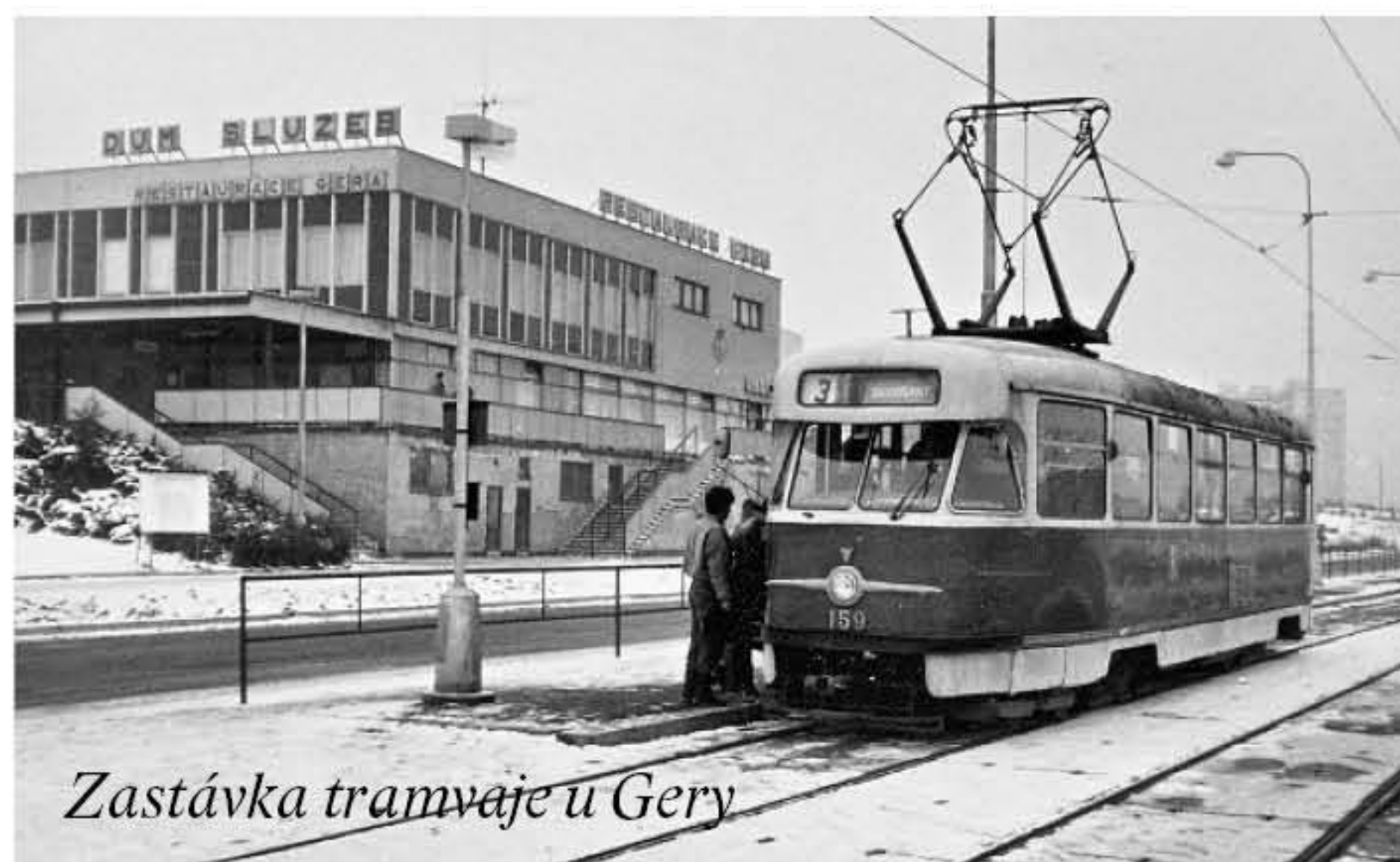
Zastávka tramvaje u Gery

Chybějící tramvajová linka s číslem 3 původně vedla z Lochotína přes náměstí Republiky do Doudlevec. Tu