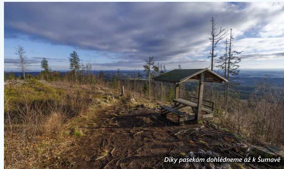
Díky pasekám dohlédneme až k Šumavě