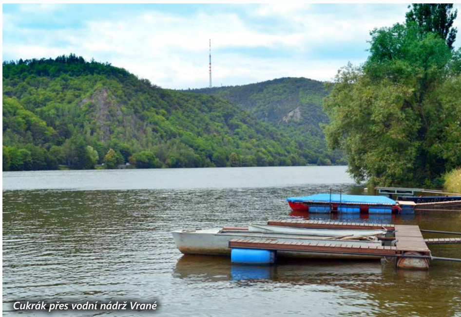
Cukrák přes vodní nádrž Vrané

Kosmas znal tento vrch pod názvem Oseka. Na konci 13. století byl založen zbraslavský klášter, který získal i lesy nad ním. Neustálá stavební činnost kláštera a pálení dřeva v milířích však způsobily jejich téměř úplné vykácení. Za stavovského povstání v letech 1618–1620 se majetku kláštera ujal karlštejnský purkrabí Jindřich Matyáš Thurn a velké lesní plochy rozprodal sedlákům. Ti v lesích hospodařili ještě nešetrněji a během krátké doby byl vymýcen i zbývající dubový a bukový porost. Části lesa byly proměněny v úzká kamenitá pole, která se však nedala dobře orat, bylo třeba je „okopávat“. A tak vznikl název