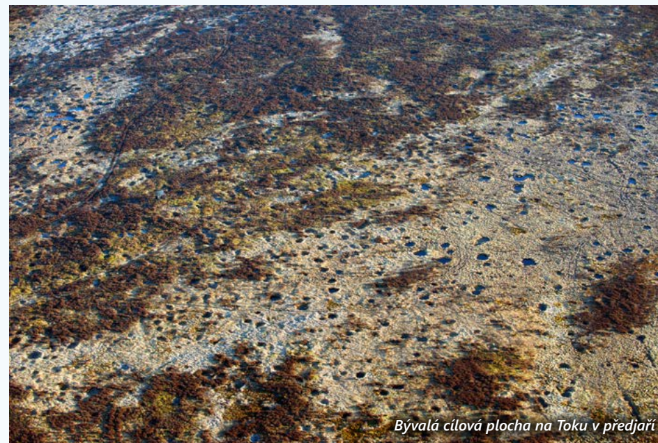
Bývalá cílová plocha na Toku v předjaří

Dělostřelecká střelnice v Brdech byla zřízena v roce 1926 a dopadová plocha na Toku se začala připravovat na jaře roku 1930 až jako poslední ze tří. Práce prováděly stovky najatých dělníků z nejhudších částí republiky, převážně z východního Slovenska a z Podkarpatské Rusi. Kácení plochy bylo dokončeno až v létě roku 1931, kdy se již na sousedním Jordánu více než rok střílelo. Při odlesnění převážně již kulturních smrčín byl extrémně kyselý substrát kambrických slepenců splavován a degradován působením srážek, větru a mrazu. Dopadová plocha byla využívána až do zániku vojenského újezdu Brdy v roce 2015, tedy