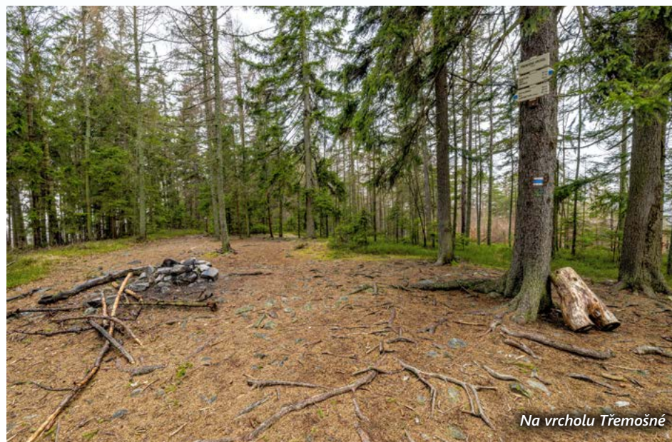
Na vrcholu Třemošné

Ze sedélka nad Kazatelnou můžeme pohlédnout i opačným směrem k severozápadu na odlesněné temeno Toku (865 m) s vybíhajícím hřebenem zakončeným Kloboučkem (703 m). Nad ním se zvedá táhlý hřeben vrcholu Brda (773 m). Běžně se můžete setkat s tvrzením, že ze skály Kazatelna je možné při zvláště dobré viditelnosti spatřit i Alpy, konkrétně oblast kolem hory Groser Priel (2 512 m). To ale možné není. Problémem není vzdálenost 220 km, ale zakulacení země. Přesto byly Alpy jednou, konkrétně 7. ledna 1994, z Třemošné opravdu vidět, ale jednalo se o optický klam ( viz Praha, Čákova vyhlídka ).