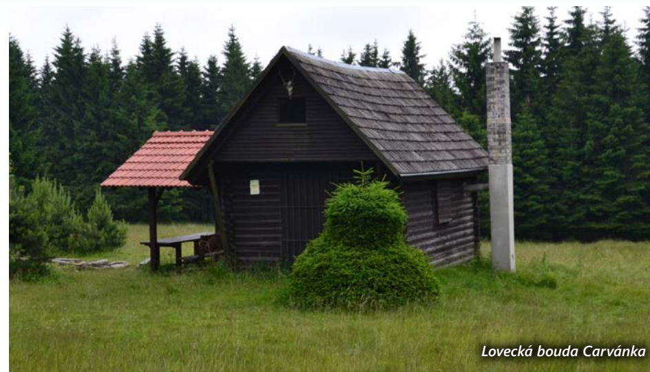
Lovecká bouda Carváňka

Samotný vrchol Toku není nikterak impozantní. Nejvyšší bod najdeme na náspu bývalého protipožárního průseku dopadové plochy. Na Toku nikdy nestála rozhledna, i když se o její stavbu turisté na konci 19. století zasazovali. Od poloviny 19. století zde jen občas vyrostly dřevěné zeměměřičské věže, budované pro účely vyměření či zpřesnění základní trigonometrické sítě. Nestály na nejvyšším bodě Toku, ale asi 200 metrů severozápadně na kótě 862,4 metru. I dnes zde najdeme patník s nápisem VT 1927 a triangulační tyč.