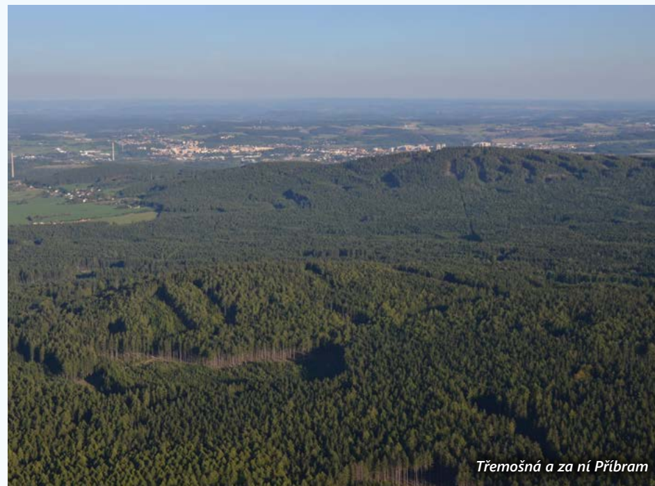
Třemošná a za ní Příbram

Třemošná je zajímavá i z přírodovědeckého a lesnického hlediska. Předpokládá se, že název vrchu byl odvozen od střemchy skalní, která na svazích rostla. Na prudkých kamenitých svazích i na samotném hřebeni se nacházejí na brdské poměry velmi staré porosty, jejichž věk se pohybuje mezi 160 až 200 lety. Kromě dominantního smrku zde najdeme borovice, modřiny, jedle, buky i javory kleny. V posledních letech ale byly lesy zejména na východním svahu postiženy kůrovcovou kalamitou, takže se zde otevřely velké paseky. Dříve nabízel rozhled na Příbram a dále k Šumavě jen skalní útvar Kazatelna, v důsledku kalamity se ale stal z Třemošné prvotřídní rozhledový vrchol. Přímo pod Třemošnou leží obec Orlov, za ní Březové Hory a vlevo od nich Příbram, nad městem se vypíná vrch s věžemi Svaté Hory. Při dobré viditelnosti vystupují za pahorkatinou středního Povltaví i výšiny Benešovska s nejvyšším vrcholem Mezivrata (714 m) a Čertovou hrbatinou u Sedlčan s nejvyšší Javorovou skálou (719 m). Více k jihu pak můžeme vidět Písecké hory s Kraví horou (606 m) a vlevo od nich chladicí věže jaderné elektrárny Temelín. Na obzoru se místy vlní vzdálené horizonty Českomoravské vysočiny, a dokonce i pohraniční Novohradské hory. Pravou část obzoru vyplňují hřebeny jihočeské Šumavy počínaje Kletí (1 083 m) a konče Boubínem (1 362 m).