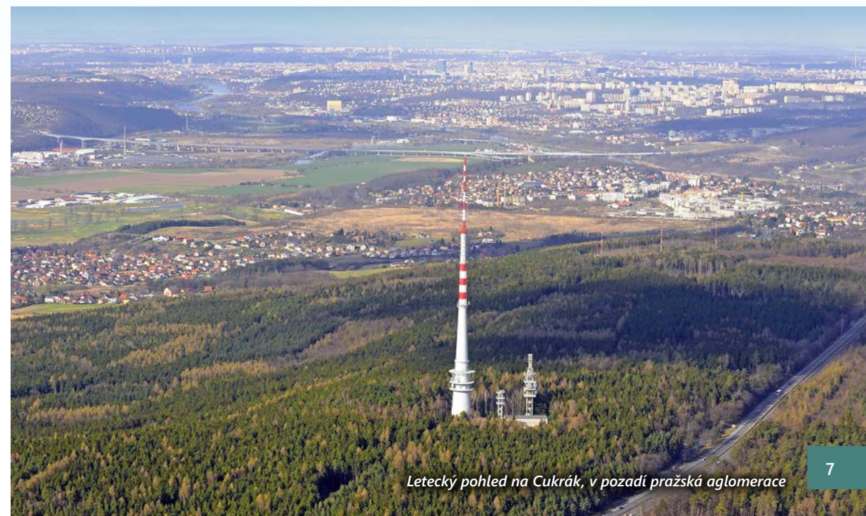
Letecký pohled na Cukrák, v pozadí pražská aglomerace