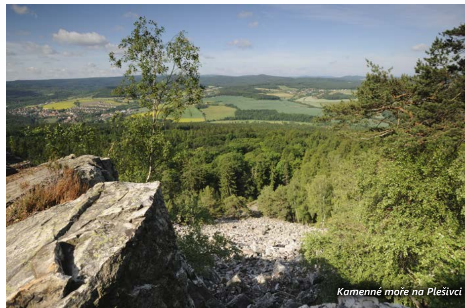
Kamenné moře na Plešivci

nástrojů, často záměrně poničených. Za posledních 200 let se jich na Plešivci našla více než desítka. Tato nápadná „zapomnětlivost“ pravěkých kovoliticů vede archeology k úvaze, že tyto depoty zřejmě nesloužily jako sklady materiálu určeného k přetavení, ale spíše jako obětiny. V pozdní době bronzové byl celý vrchol Plešivce obehnan dvěma pásy kamenných hradeb širokých asi tři metry a vysokých 2,5 metru, které uzavřely prostor o rozloze 60 ha. Byly složeny z vrstev oboustranně lícovaných kamenů, prokládaných příčnými dřevěnými