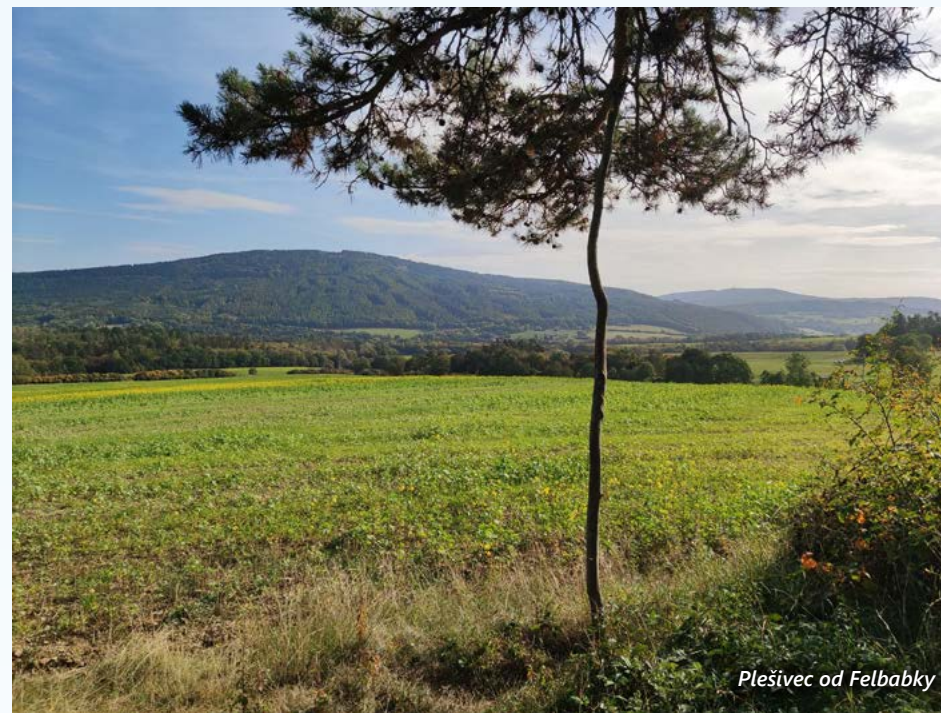
Plešivec od Felbabky

V mladší až pozdní době bronzové, tedy v období mezi 13. a 8. stoletím před změnou letopočtu, se stal Plešivec důležitým metalurgickým a obchodním centrem. Práce s ohněm, při níž se měnil charakter hmoty, předpokládala přízeň nějaké božské síly, které se pravěkým slévačům na uctívané hoře nepochybně dostávalo. Navíc bylo místo jistě nějak ohrazeno, takže tajemství přesných a střežených výrobních postupů zůstávalo zachováno. Na Plešivce směřovali obchodníci se surovou mědí a vzácným cínem, přiváželi hotové exkluzivní výrobky ze vzdálených oblastí a zajišťovali zároveň odbyt nových výrobků z bronzu. Z tohoto období pochází nalezená torza pecí s bronzovou slitinou, ale především četné depoty bronzových