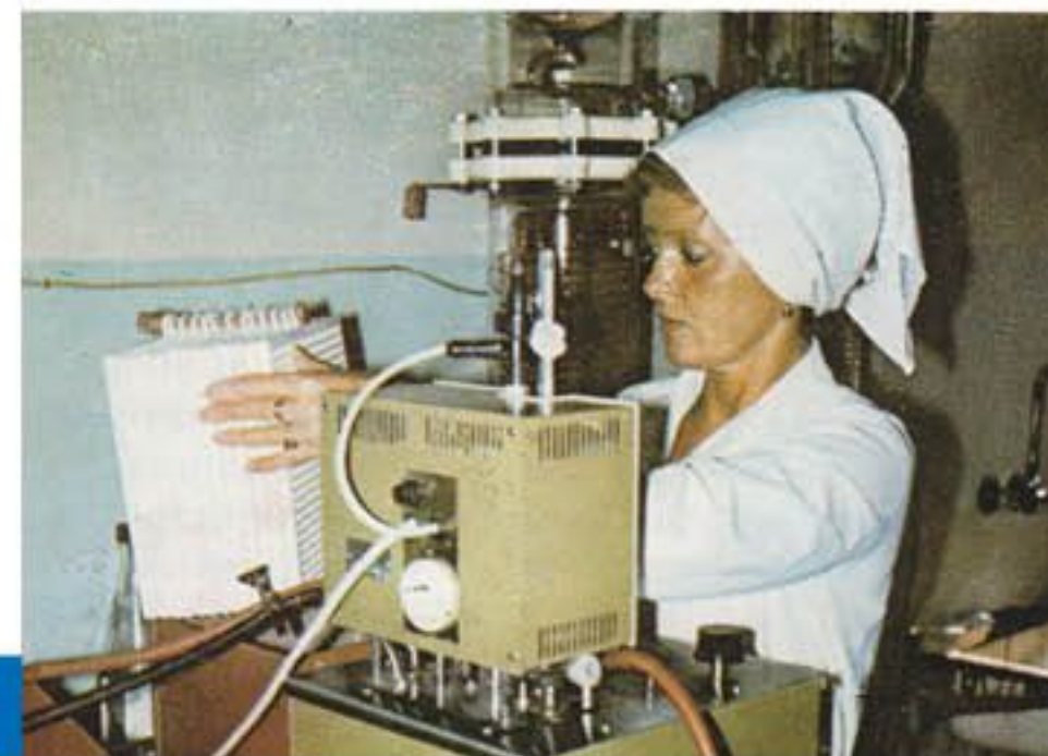
Praní gelových kontaktních čoček (sedmdesátá léta 20. století)