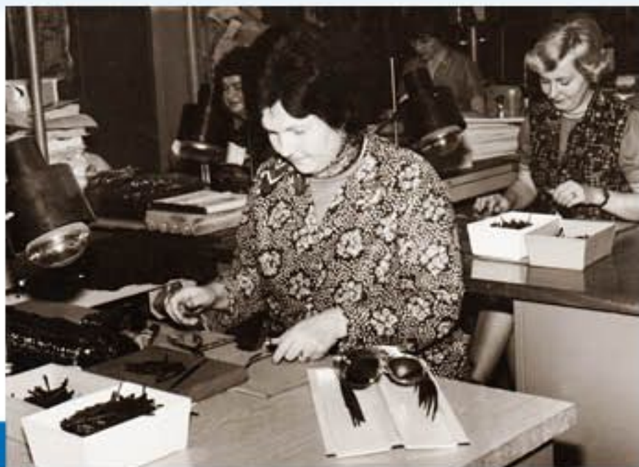
Montáž slunečních obrub (sedmdesátá léta 20. století)