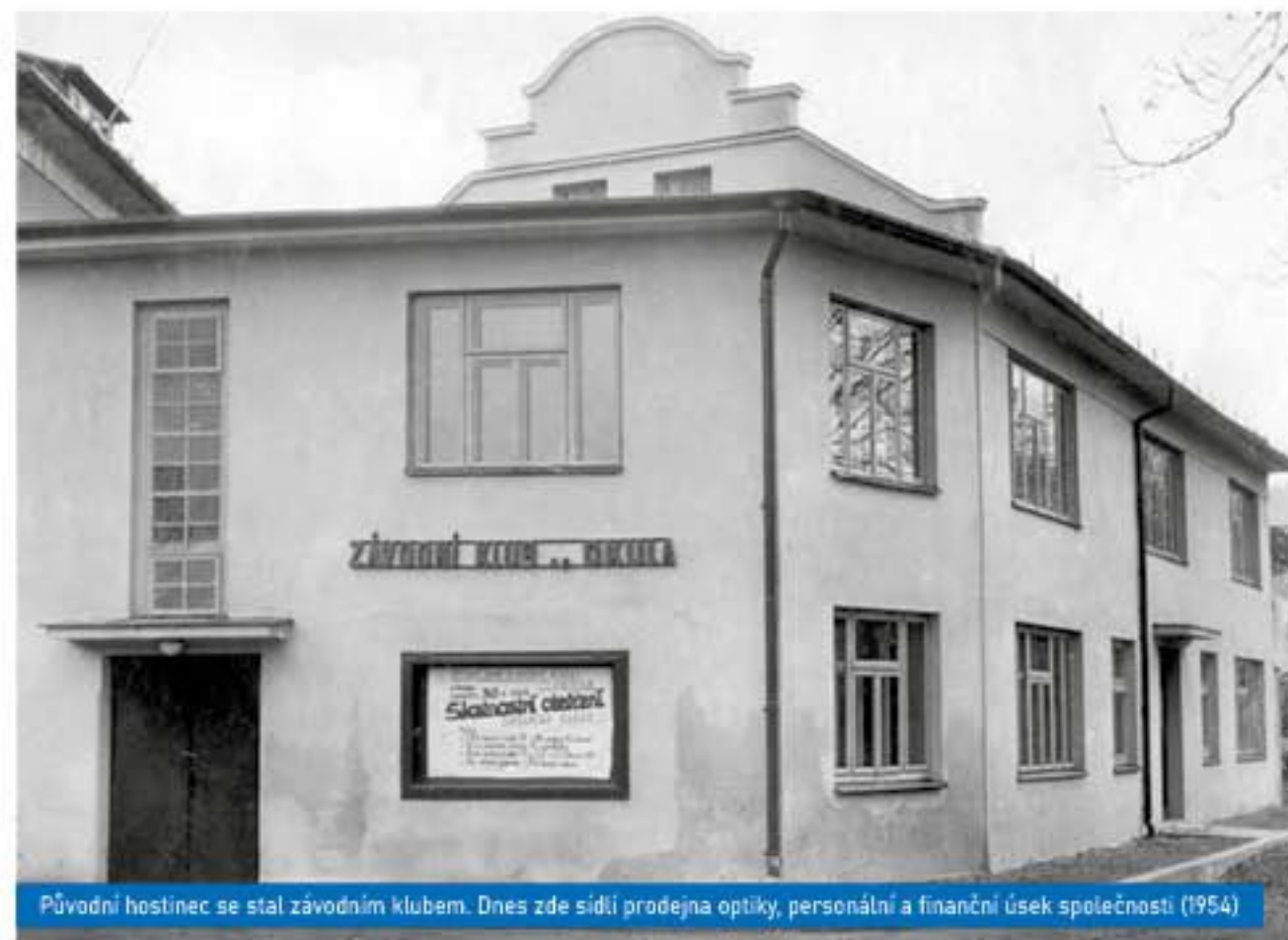
Původní hostinec se stal závodním klubem. Dnes zde sídlí prodejna optiky, personální a finanční úsek společnosti (1954)