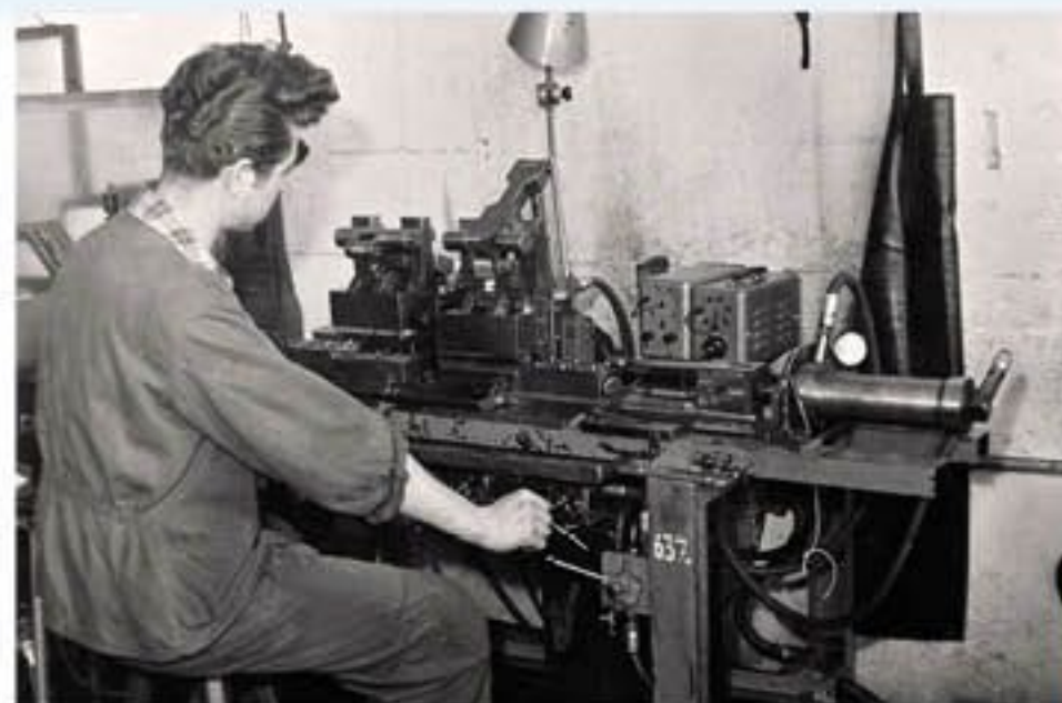
Produkce kovových spojovacích materiálů pro brýlové obruby (šedesátá léta 20. století)