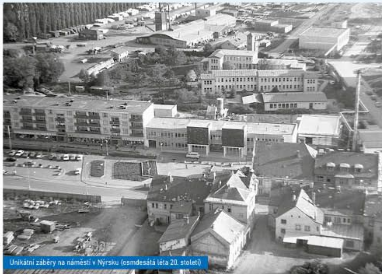
Unikátní záběry na náměstí v Nýrsku (osmdesátá léta 20. století)