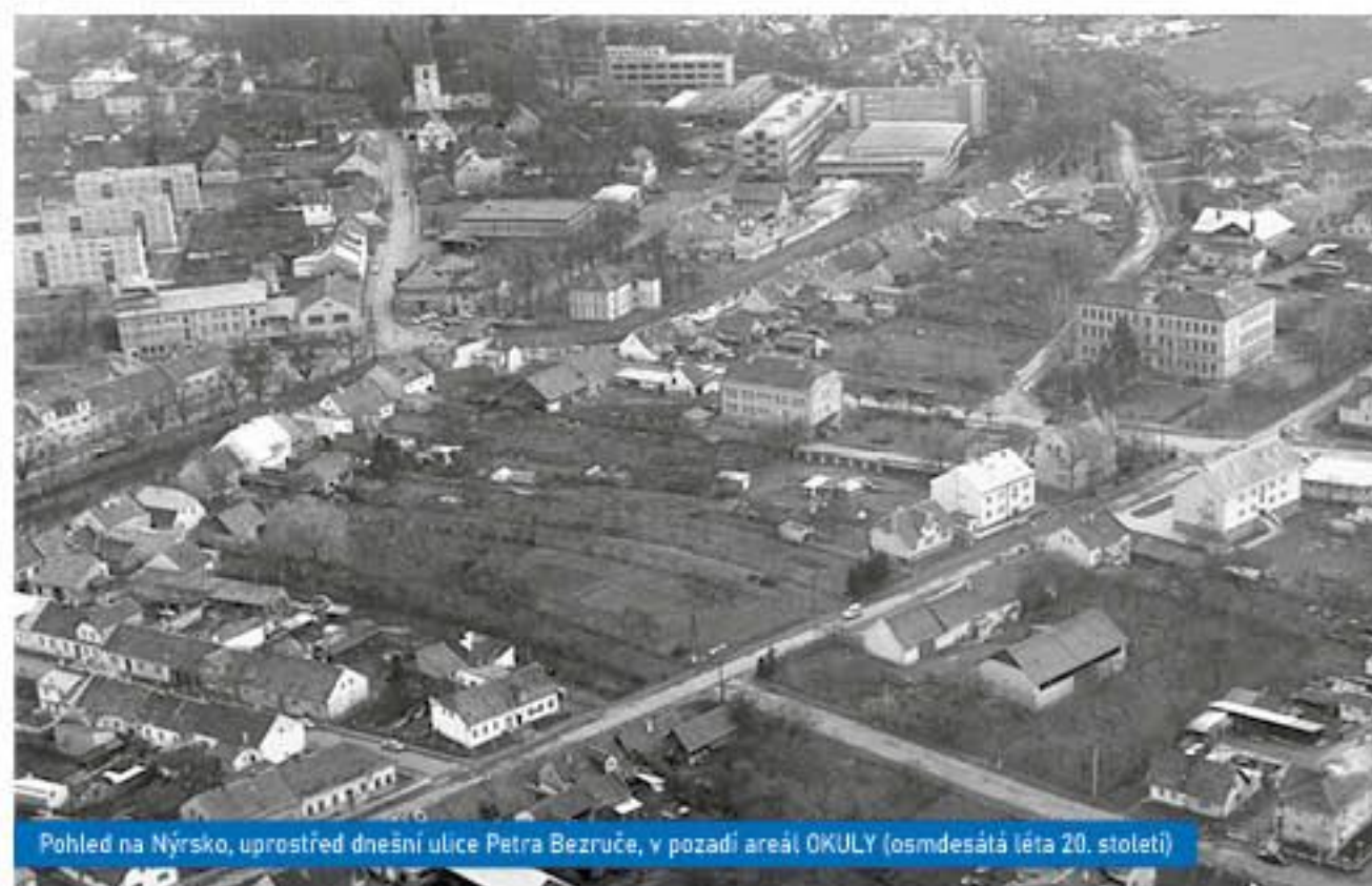
Pohled na Nýrsko, uprostřed dnešní ulice Petra Bezruče, v pozadí areál OKULY (osmdesátá léta 20. století)