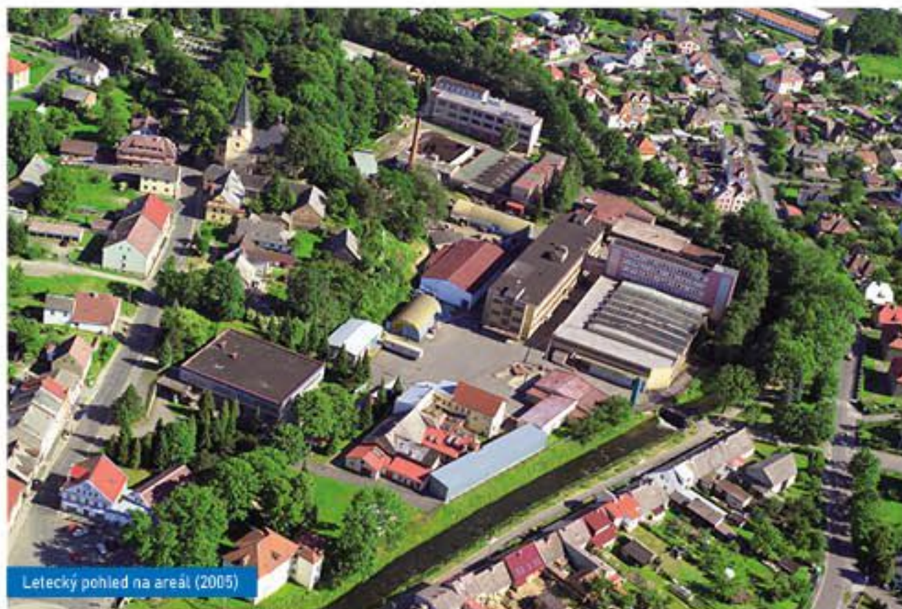
Letecký pohled na areál (2005)