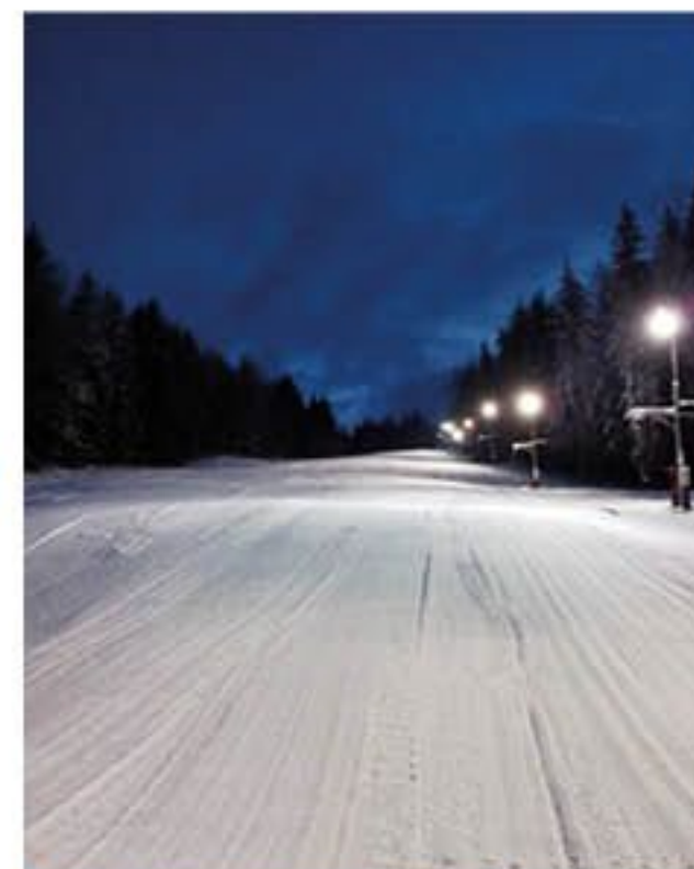
Svah připravený na večerní lyžování (2019)