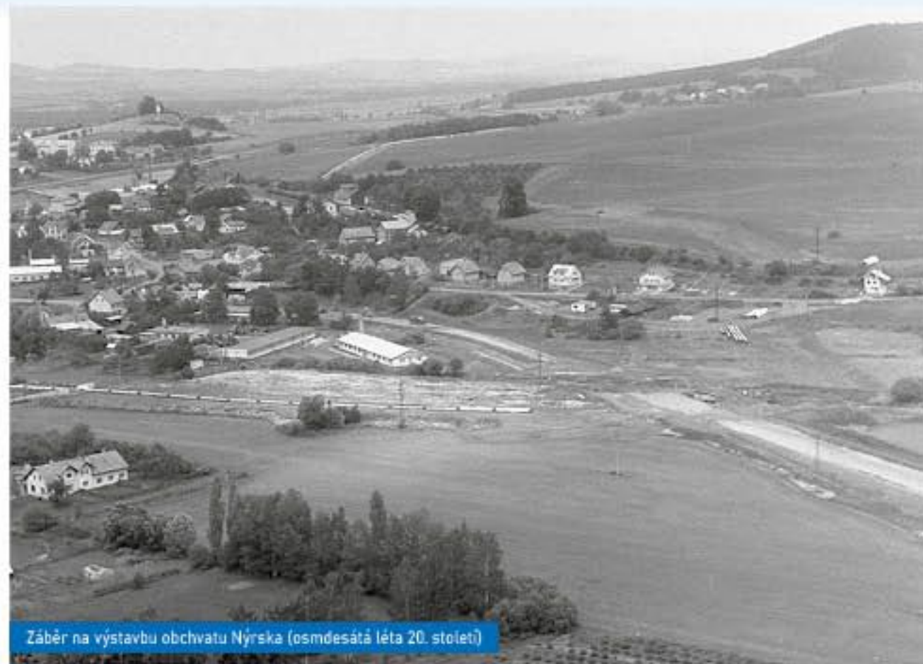
Záběr na výstavbu obchvatu Nýrska (osmdesátá léta 20. století)