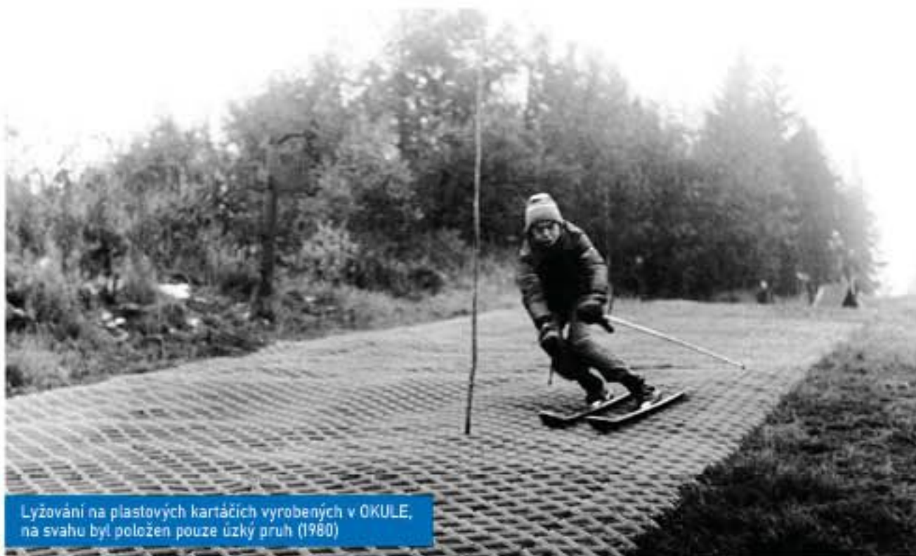
Lyžování na plastových kartáčích vyrobených v OKULE, na svahu byl položen pouze úzký pruh (1980)