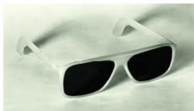
Reklamní fotografie brýlí vyrobených v OKULE Nýrsko (padesátá a sedesátá léta 20. století)