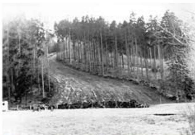
Pohled na novou nýrskou sjezdovku ještě bez vleku (1973)