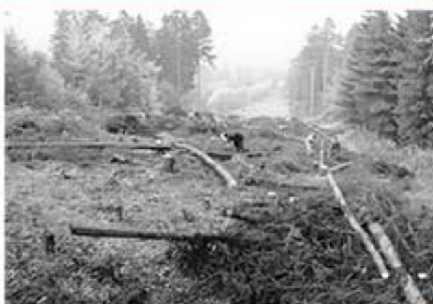
Rozšiřování sjezdovky (1977)