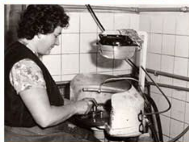
Výroba kontaktních čoček (šedesátá léta 20. století)