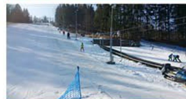
V současnosti je lyžařský svah stále využíván, má 300 metrů dlouhý vlek, výškový rozdíl činí 64 metrů a sjezdovka je vybavena osvětlením pro večerní lyžování (2020)