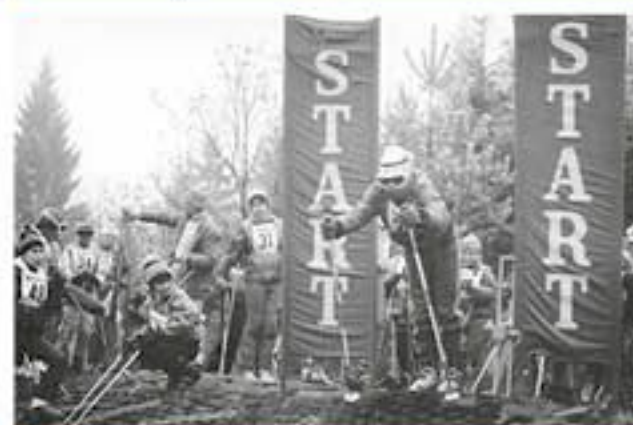
Veřejný závod ve slalomu na umělé hmotě (1989)