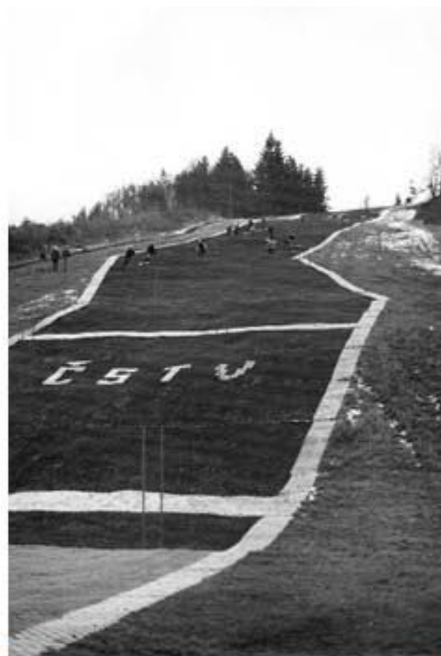
Nový umělohmotný povrch (1982)