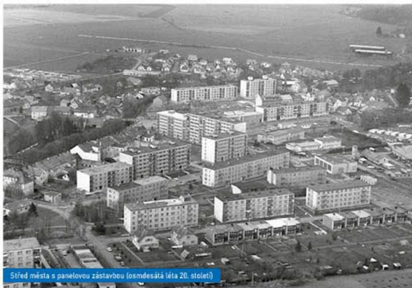
Střed města s panelovou zástavbou (osmdesátá léta 20. století)