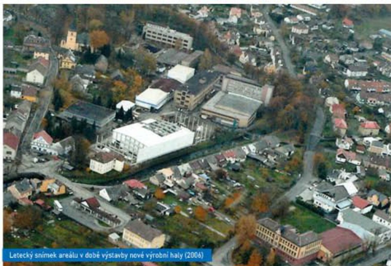
Letecký snímek areálu v době výstavby nové výrobní haly (2006)