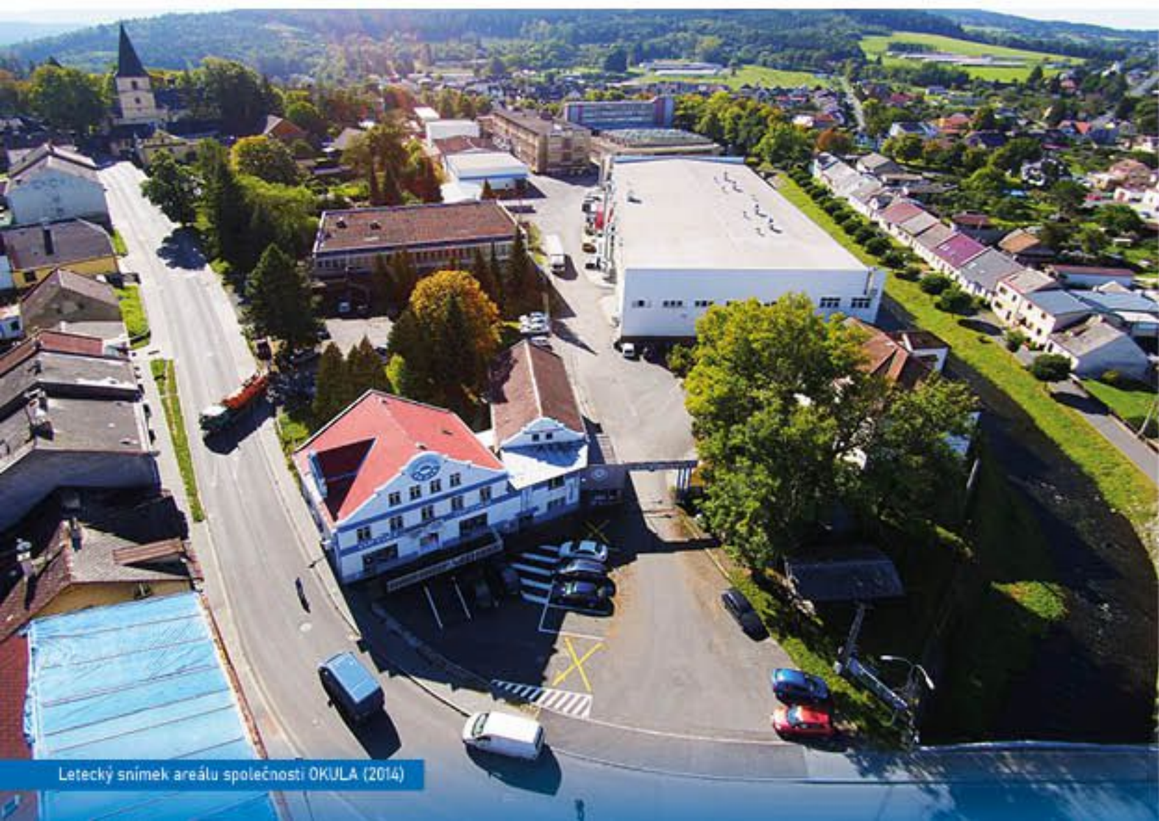
Letecký snímek areálu společnosti OKULA (2014)