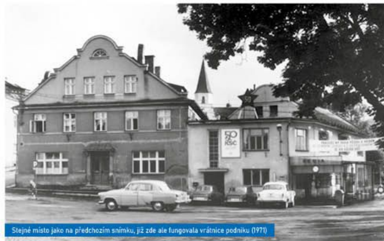
Stejně místo jako na předchozím snímku, již zde ale fungovala vrátnice podniku (1971)