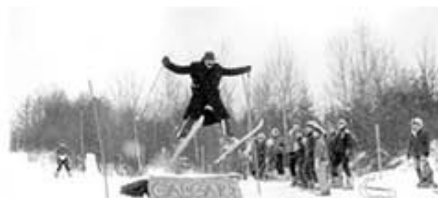
Karneval na sjezdovce (1988)