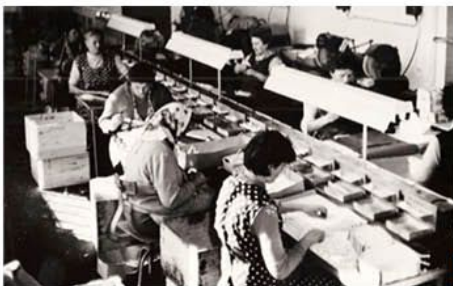
Montážní linka brýlových obrub (šedesátá léta 20. století)