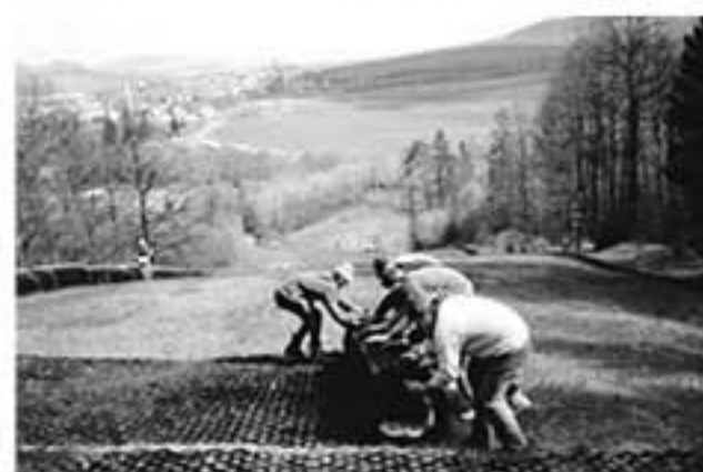
Každoroční jarní rolování hmoty (1991)