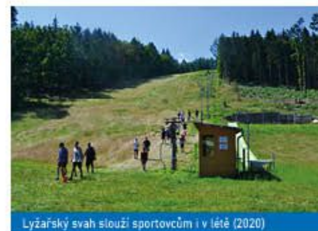
Lyžařský svah slouží sportovcům i v létě (2020)