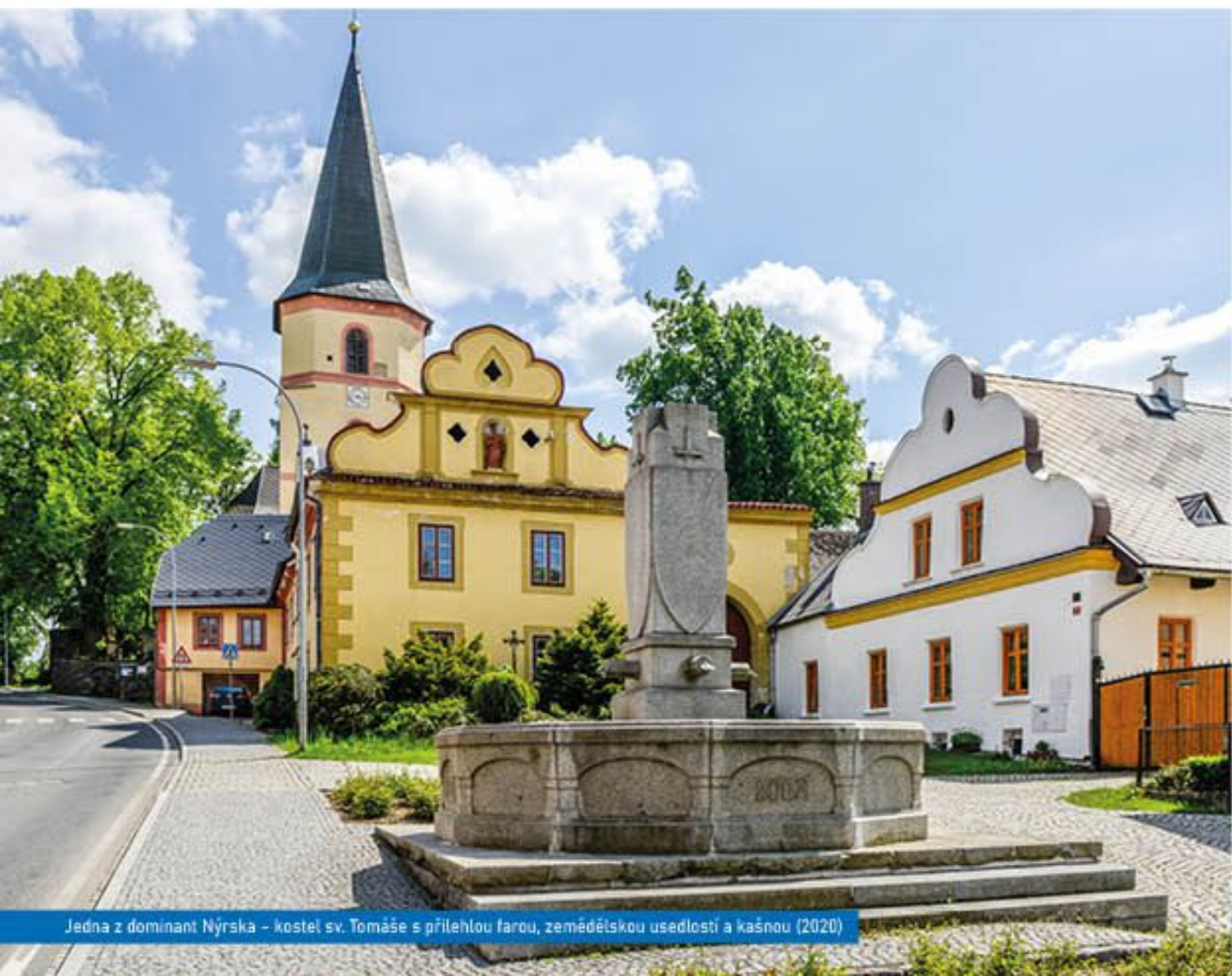
Jedna z dominant Nýrska – kostel sv. Tomáše s přílehlou farou, zemědělskou usedlostí a kašnou (2020)