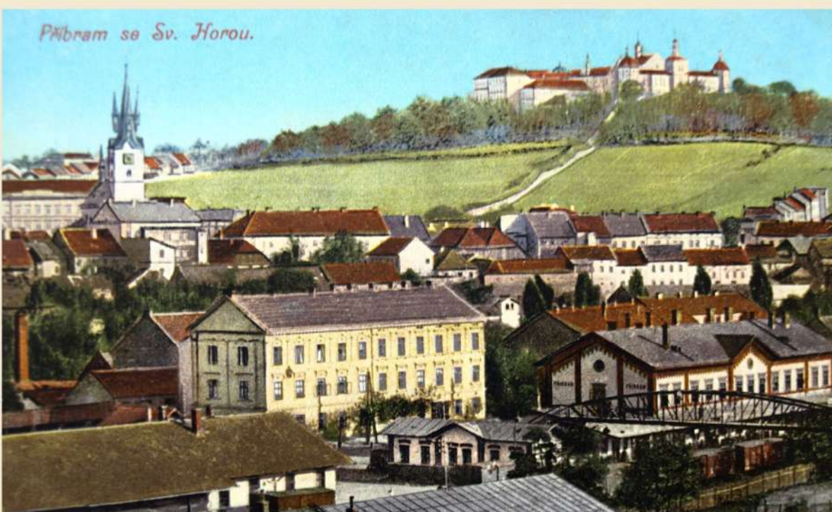
Jeden z několika desítek pohledů na Svatou Horu od příbramského nádraží