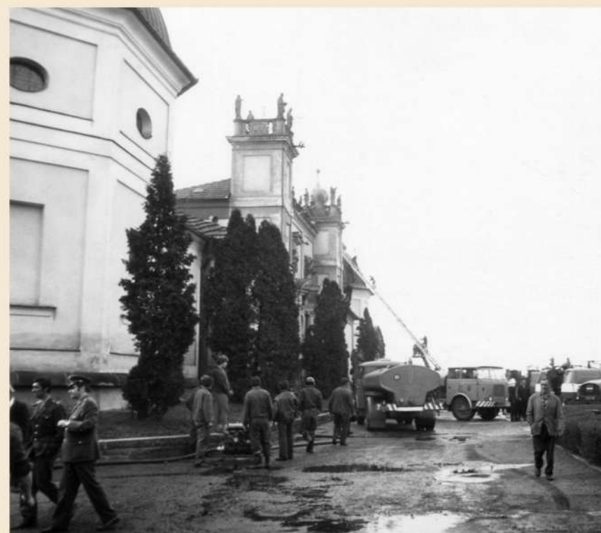
V 15 hodin dorazili s udýchanými vozy první hasiči. Celkem jich bylo na 330 ze 46 hasičských jednotek, a to nejen z příbramského okresu a okresů sousedních, ale např. až z Prahy, Kladna a Českých Budějovic. Ale přes veškerou snahu a obětavost byl požár rychlejší.