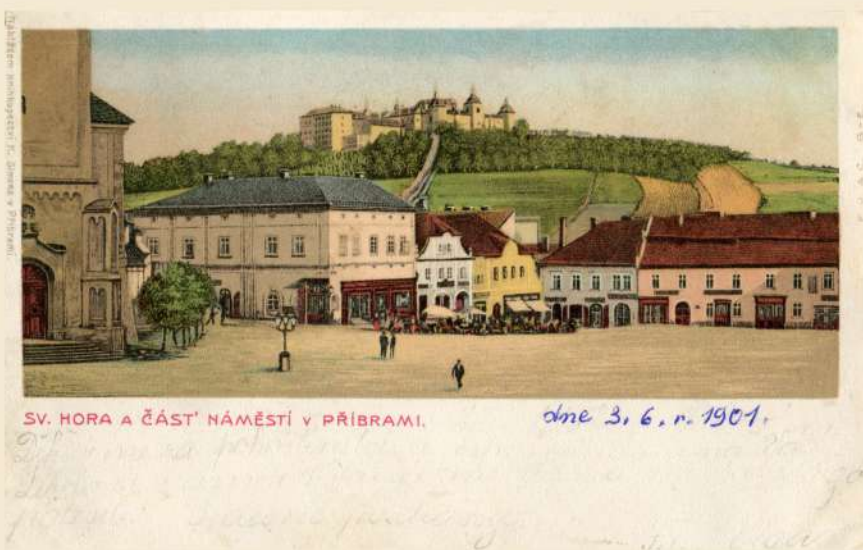
Pohled na Svatou Horu z příbramského náměstí (nám. T. G. Masaryka) na přelomu 19. a 20. století. Uprostřed trojice dnes již neexistujících barokních domů.