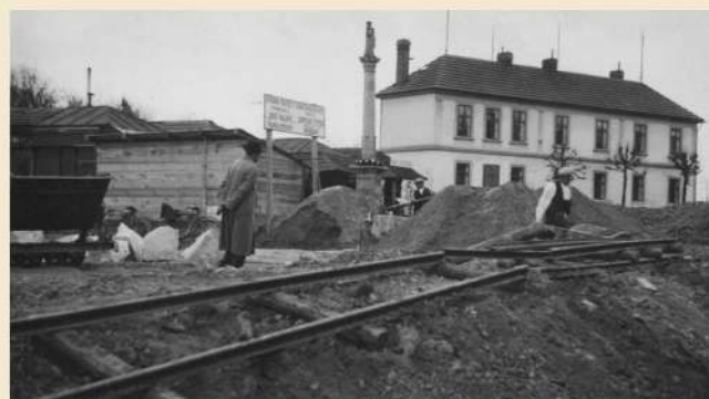
Nakopaná zemina se odvážela po kolejích železnými vozíky. Vpravo v pozadí budova školy.