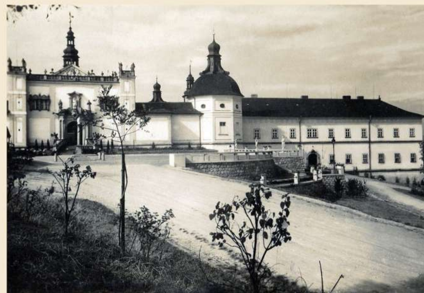
Severní strana náměstí po úpravě v roce 1934. Balustráda je osazena třemi sochami příbramského rodáka akademického sochaře Václava Šáry a k rezidenci vede nová cesta.