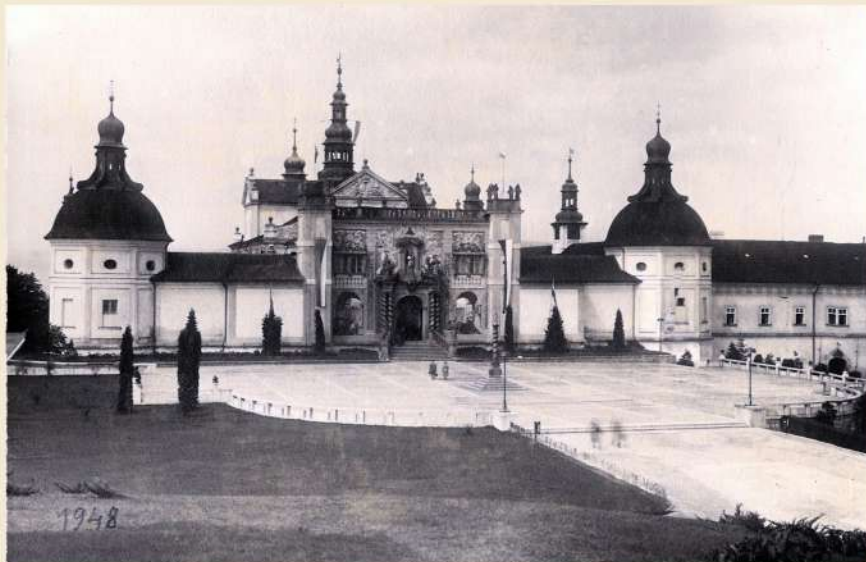
V červnu 1948 byla Svatá Hora opět slavnostně vyzdobena. Tentokrát k 600. výročí vzniku milostné sošky Panny Marie, kterou podle tradice v roce 1348 vyřezal či dal vyřezat pražský arcibiskup Arnošt z Pardubic