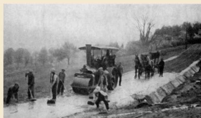
Hutnil i povrch nové příjezdové cesty k rezidenci