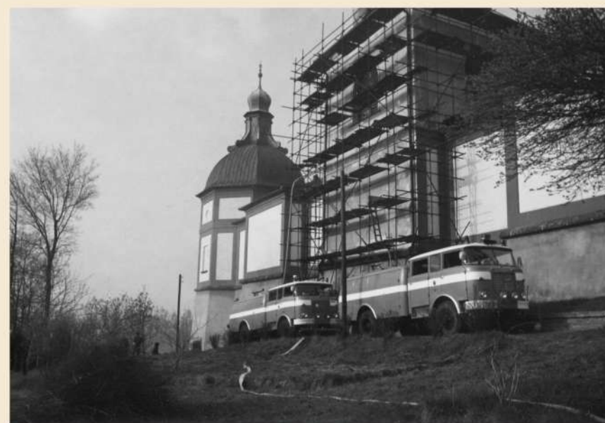
Likvidaci požáru komplikoval i těžko přístupný terén na západní straně Svaté Hory