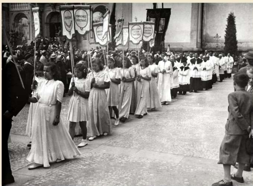
Družičky s mariánskými hesly