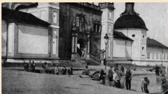
S úpravou svatohorského náměstí se začalo v březnu 1934. Snímek zachycuje odkopávání tříčtvrtěmetrové vrstvy zeminy.