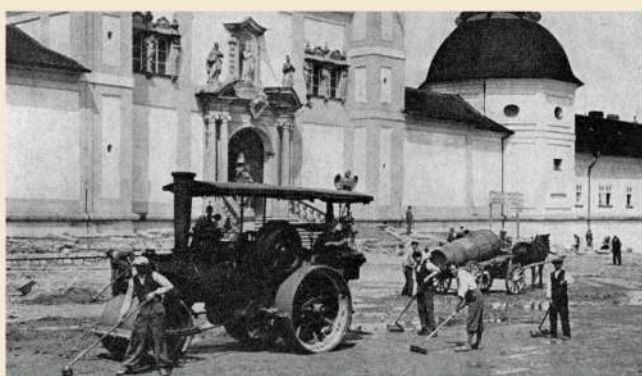
Na svatohorském náměstí se objevil tehdejší technický zázrak – parní válec