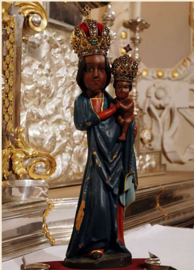
Milostná soška Panny Marie Svatohorské je nejstarším výtvarným dílem na Svaté Hoře. Bez liturgického oblečení je na ní dobře patrné neodborné zhotovení, zejména nedodržení základních proporcí.