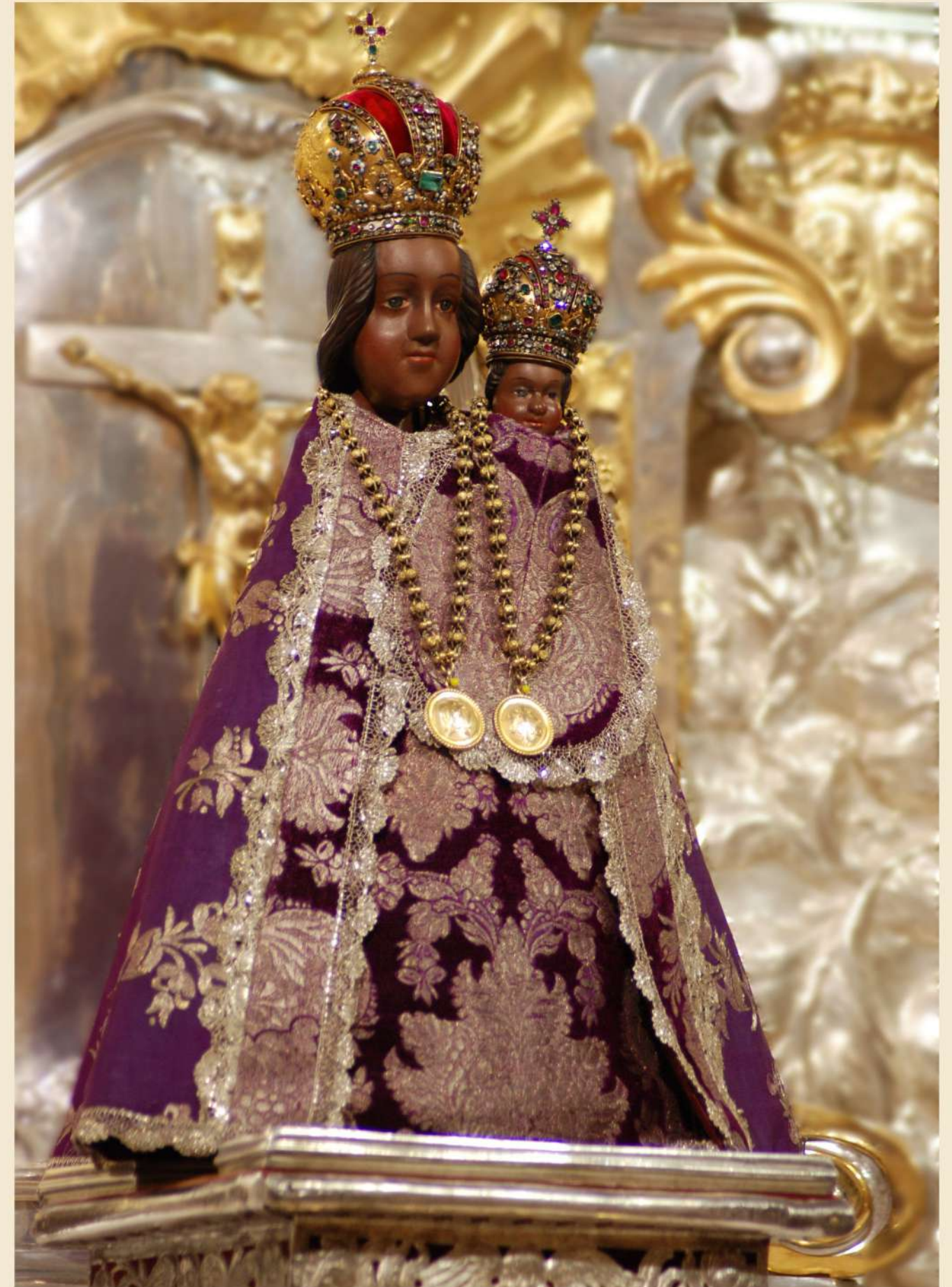
Podle tradice vyřezal sošku Panny Marie Svatohorské první pražský arcibiskup Arnošt z Pardubic v roce 1348. První historický údaj však pochází až z roku 1611, kdy byla soška v příbramském špitálním kostele sv. Jana Evangelisty (kdysi stával na Rynečku). Soška je 49 cm vysoká, vyřezaná z hruškového dřeva.