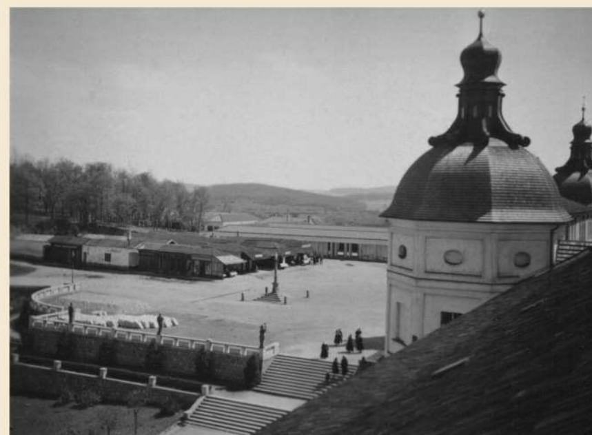
Na tomto celkovém pohledu na náměstí vyniká nová úprava jeho severní strany s majestátní dvojitou zdí a imponantním schodištěm. Bohužel to nejošklivější, nevzhledné krámky, zůstalo. A to i přesto, že byly vybudovány na jižní straně nové. Nechce se věřit, že ve válečném roce 1940 vyrostly za necelý jeden rok.