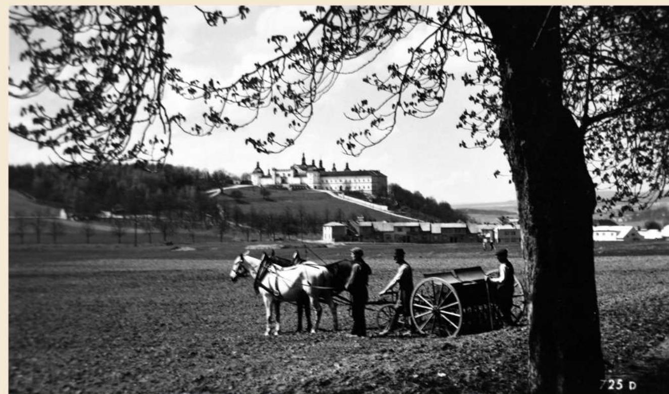
Pohled na jarní Svatou Horu od někdejší cesty na Novou Hospodu, vroubené stromořadím kaštanů (dnešní Žižkova ulice). Třicátá léta 20. století.