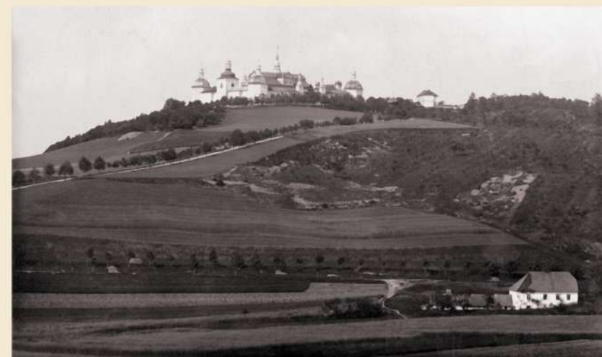
Svatá Hora od Sázek na počátku 20. století. Pod ní Svatohorská alej. V popředí bývalý mlýn Pilka, silnice za ním je dnešní Mixova ulice.