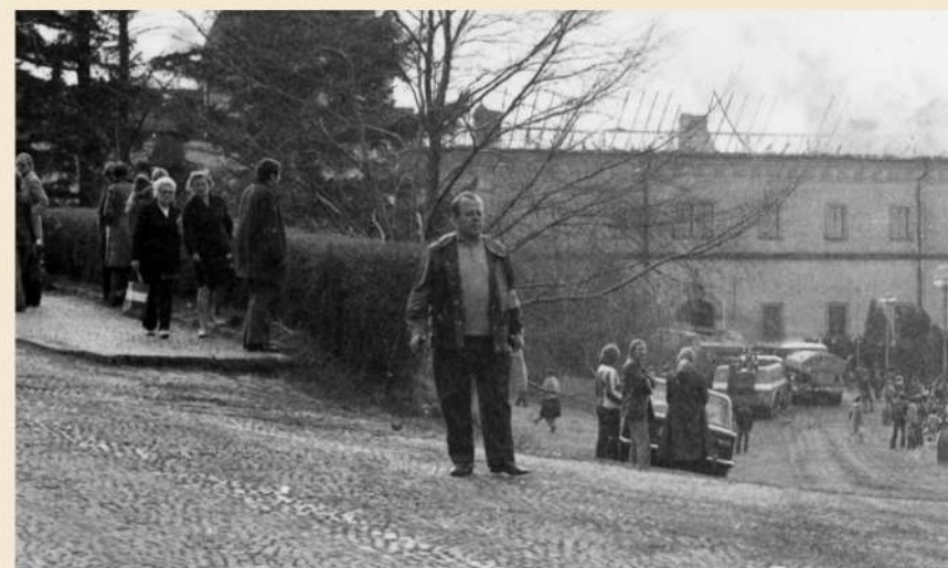
Posilován větrem a vrstvou půdního prachu se požár neuvěřitelnou rychlostí rozšířil na střechy severního ambitu, jižní a následně východní křídlo (na fotografii) rezidence a klášter. Ohrožena byla i střecha baziliky.