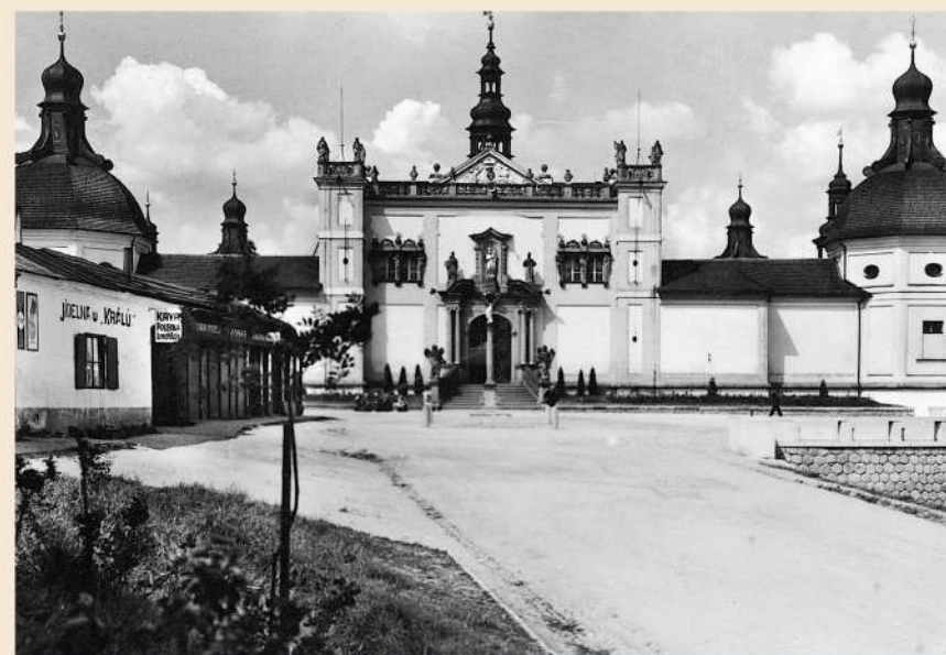
Detailnější pohled, na kterém je patrné, že mariánský sloup s Pannou Marií byl přesunut poněkud vlevo, před Pražskou bránu