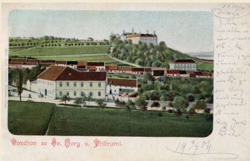
Pohled na Svatou Horu na samém začátku 20. století. Vpravo pod ní budova starého konviktu, která v té době sloužila jako druhá budova Báňské akademie. Vlevo v popředí restaurace U Sebastopolu, pěšina před ní je budoucí Mánesova ulice.