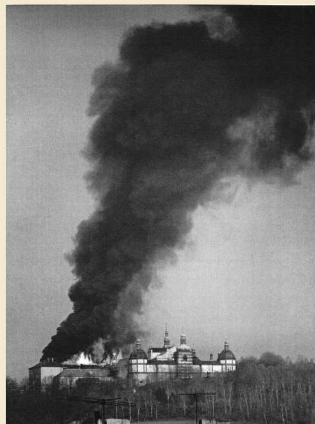
Ve čtvrtek 27. dubna 1978 postihl Svatou Horu největší požár v její historii. Zdaleka viditelné plameny a hrozivé mračno černého kouře nenechávaly nikoho na pochybách o jeho značném rozsahu a o škodách, které způsobí.