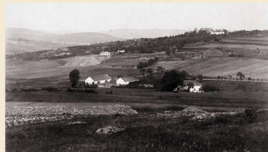
Svatá Hora od jihu, rovněž na počátku 20. století. Vlevo uprostřed bývalá svatohorská šachta, níže vpravo někdejší svatohorské lázně.