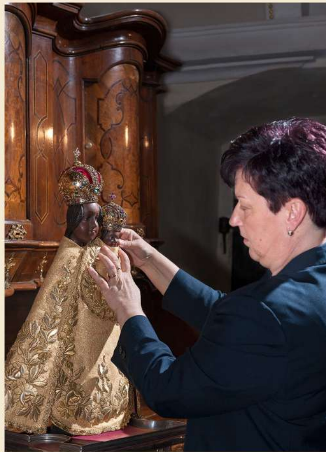
Oblékání milostné sošky do pláštíku, jehož barva se mění podle liturgické doby. Nejvznešenější je pláštík barvy bílé, pro všední dny je zelený.