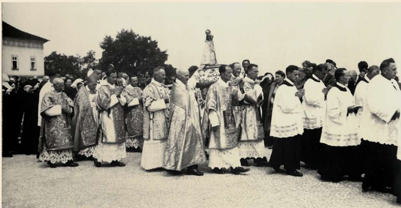
Korunovační průvod se soškou Panny Marie na svatohorském náměstí