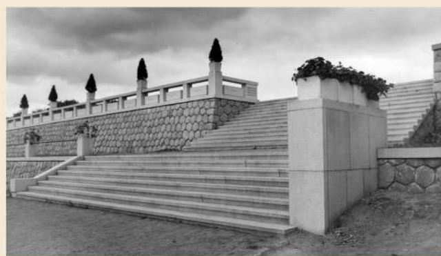
Hotové opěrné kyklopské zdi a honosné schodiště pro poutníky