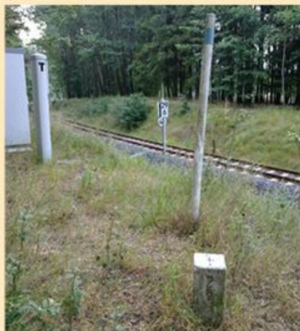
Železniční přechod Aš/Selb v současnosti

stolu." Povedená akce ale přiměla komunistický režim k zabezpečení železničních přechodových míst. Došlo k vytrhání a zasypání kolejí na mnoha nevyužívaných přechodech, aby se zabránilo podobnému incidentu. Do využívaných úseků byly instalovány výkolejky, uzamykatelné nikoliv železničáři, ale pohraničníky. Dále se přes kolejiště montovala vrata nebo zábrany vysunované z betonových bloků. Nákladní doprava přes železniční přechod Aš/Selb během socialismu neustala. Byla však z ekonomických důvodů ukončena k 1. červnu 1995.