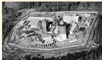
Stanoviště na konci sedmdesátých a osmdesátých let