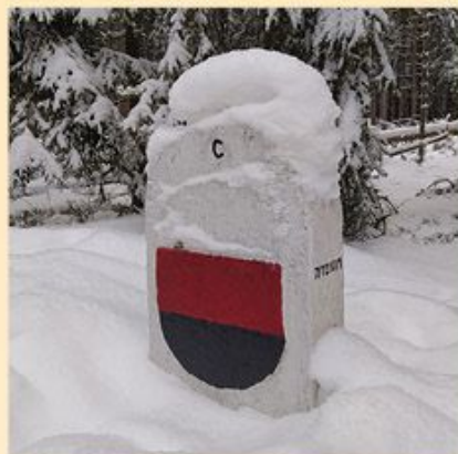
Erby Zedtwitzů a Lindenfelsů, panský mezník č. 7-9/2C v devadesátých letech 20. století a č. 7/12-0/1 v zimní peřině