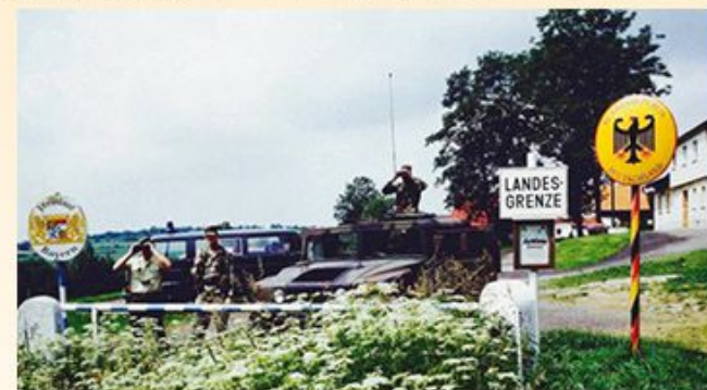
Společná hlídka BGS a ZOLL u přechodu Svatý Kříž / Waldsassen v padesátých letech, československá hlídka u přechodu Pleš/Friedrichshäng v padesátých letech, společná hlídka LOP a BGS tamtéž v osmdesátých letech, hlídka LOP v domáckém úseku hranice je vyobrazena na obálce knižky