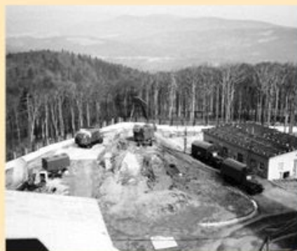
Průzkumná technika u vrcholové skalky v osmdesátých letech, přímo na skalce je stanice SDR

Už od dubna 1950 vzniklo na Čerchově výcvikové středisko Sboru národní bezpečnosti a o rok později tady zaujala sestava rota Pohraniční stráže. Vojska zpočátku využívala stávající (turistické) objekty, stejně tak jako v pozdější době nově vznikající útvar radiotechnického průzkumu s posádkou v Klenčí pod Čerchovem. V roce 1956 prezident republiky Antonín Zápotocký navštívil rotu Čerchov u příležitosti Chodských slavností. Počátek působení armády na Čerchově lze datovat právě do roku 1956, kdy tady začala působit odloučená jednotka 55. rádiového pluku Kralovice v síle čtyř. V roce 1958 byl kopec zakoupen ministerstvem obrany, ministerstvo vnitra coby dosavadní nájemce však na vrcholu zůstalo. Začala organizovaná instalace techniky. Nejprve se úkoly plnily z upravených vozidel. Na dříve zmíněných stanovištích se musel postavit dřevěný špak pro tyto účely. Kurzova věž tuto funkci převzala, ale musela být nástavba v roce 1958 upravena za účelem vytvoření odposlechových pracovišť a zvětšení prostoru pro antény s technikou. Příprava zahrnovala i personální obsazení stanoviště. V této době bylo na Čerchově minimum budov a prostředků pro zajištění stále vojenské přítomnosti. Stála tady stará Pasovského chýše, Kurzova věž, turistická chata (z let 1925–1927), hospodářská budova s doškovou střechou a dva domky (říňák a skladiště) sloužící Pohraniční stráž. První modernizace proběhla v letech 1957–1959, kdy byla vybudována