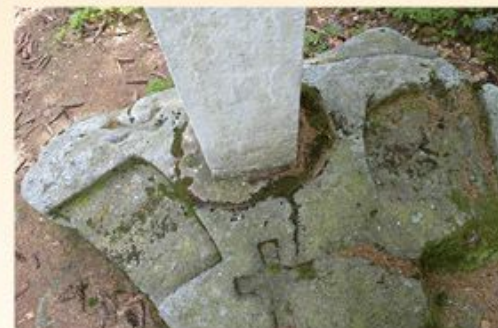
Křížový a mísový kámen před prvorepublikovou demarkací (povšimněte si nápisu K BÖHMEN) a současný stav coby hraniční znak č. 8 (pod sedátkem je letopočet 1844)