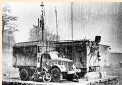
Návštěva Antonína Zápotockého u roty PS na Čerchově a průzkumná stanice RUL tamtéž v roce 1963

radary a podobných zařízení. Základním účelem radarů je vysílání signálů v úzce tvarovaném paprsku, zasažení cíle, odraz signálu od cíle, jeho zachycení anténou a zpracování. Výsledkem je pak informace o tom, jak daleko, v jakém směru a jak vysoko je například letoun, který palubní radar využívá, nebo kde se nachází pozemní radar. Činnost všech těchto tzv. radiotechnických prostředků je úzce vázána na využívání rádiových vln o velmi vysoké frekvenci, které se šíří pouze přímočaře a nejsou schopny proniknout terémem, hustou vegetací nebo vodními srážkami. Proto jsou radary umísťovány převážně na vysoké kopce tak, aby dosah byl co nejdelší. Tyto zásady se týkají nejen klasických aktivních