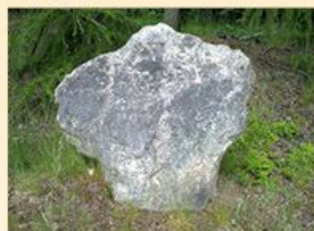
Smírčí kříž, nebo jiné tajemství?