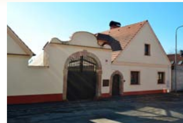
Statek č. 2 (2019)