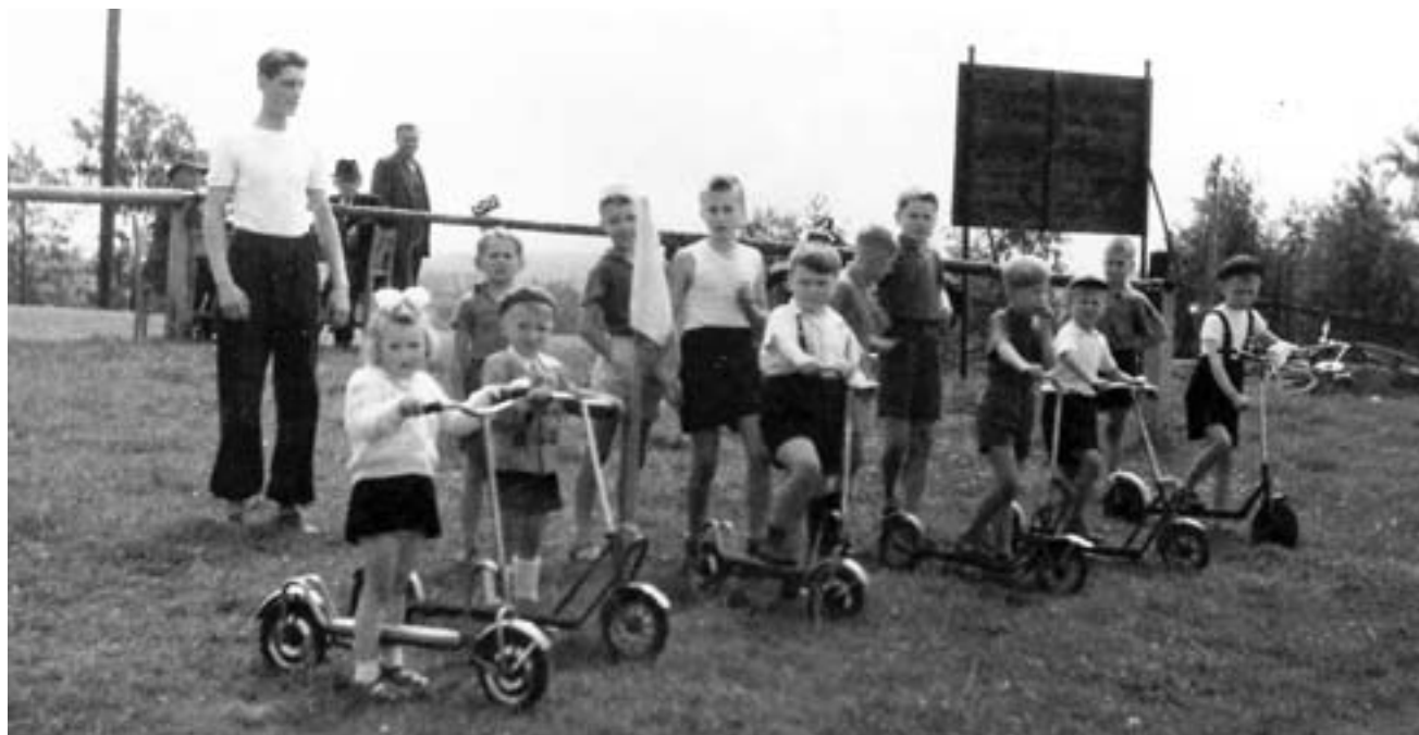
Dětský den na fotbalovém hřišti, závod na koloběžkách (50. léta 20. století)