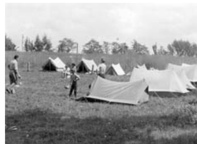
Stanování na hřišti v rámci Dětského dne (1965)