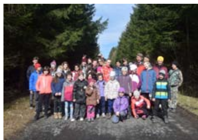
PS HOMOLKA, oddíl KOMETA, je nezisková organizace. Již 25 let pravidelně pořádá v Hradišti tři akce pro veřejnost: Dětské maškarní odpoledne, Dětský den a Mikulášsko-pekelný rej. Dále pro děti připravuje podzimní a velikonoční prázdniny na turistické základně v Újezdě u Plánice a letní tábor ve Žluticích. Na snímcích akce z posledních let.