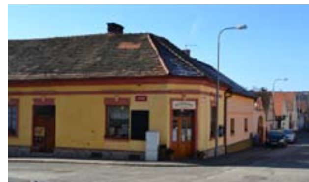
Potraviny U Hrubých (2019)

Pramen do konce roku 1990. Poté byl objekt vrácen původním majitelům.