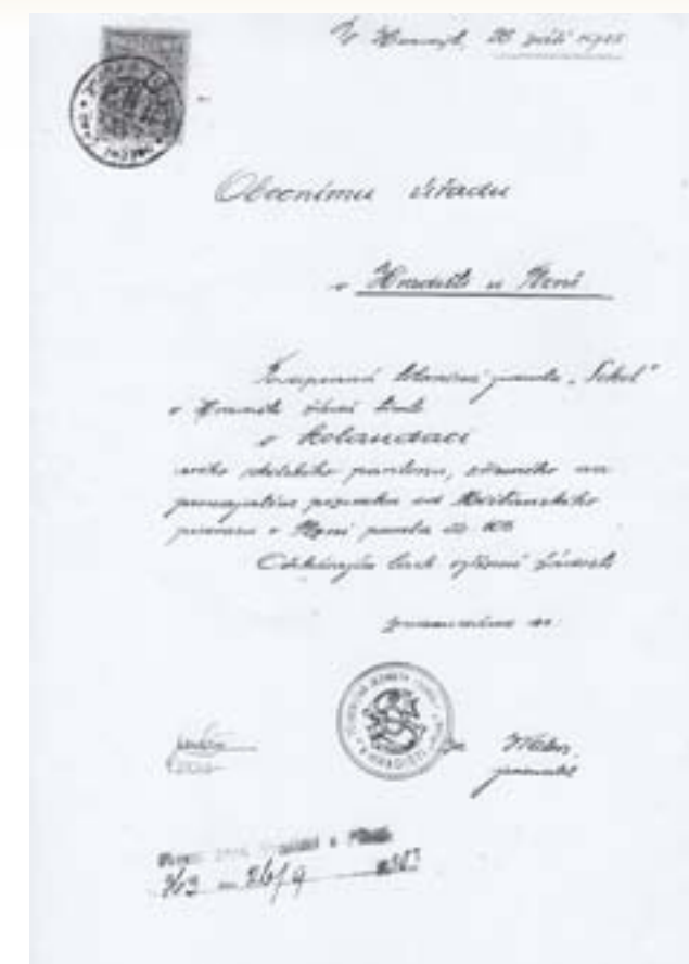
Žádost Sokola v Hradišti o kolaudaci sokolského pavilonu (1925)