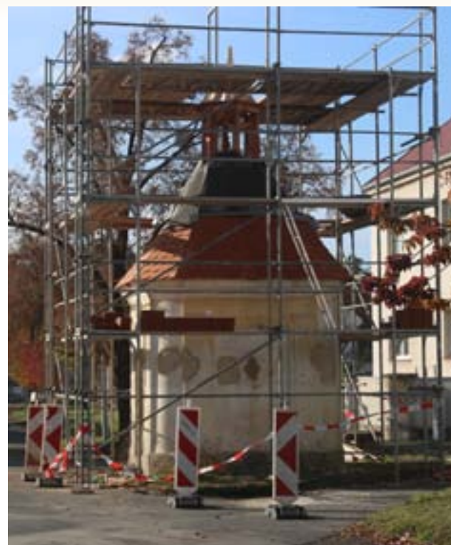
Rekonstrukce kaple (2016)