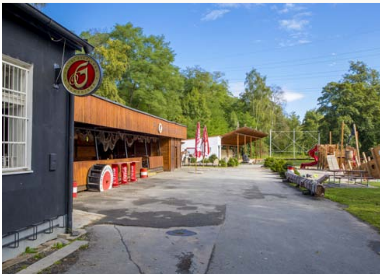
Pohledy na současnou podobu areálu Plovárna Hradiště (2015–2019)