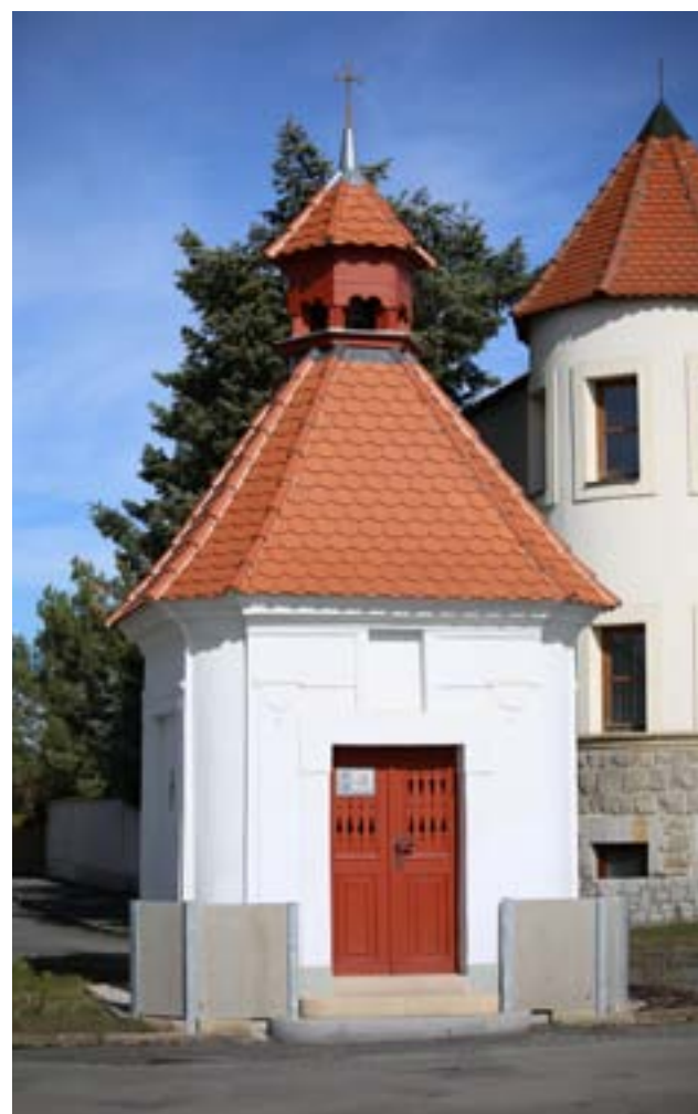
Návesní kaple dnes (2019)