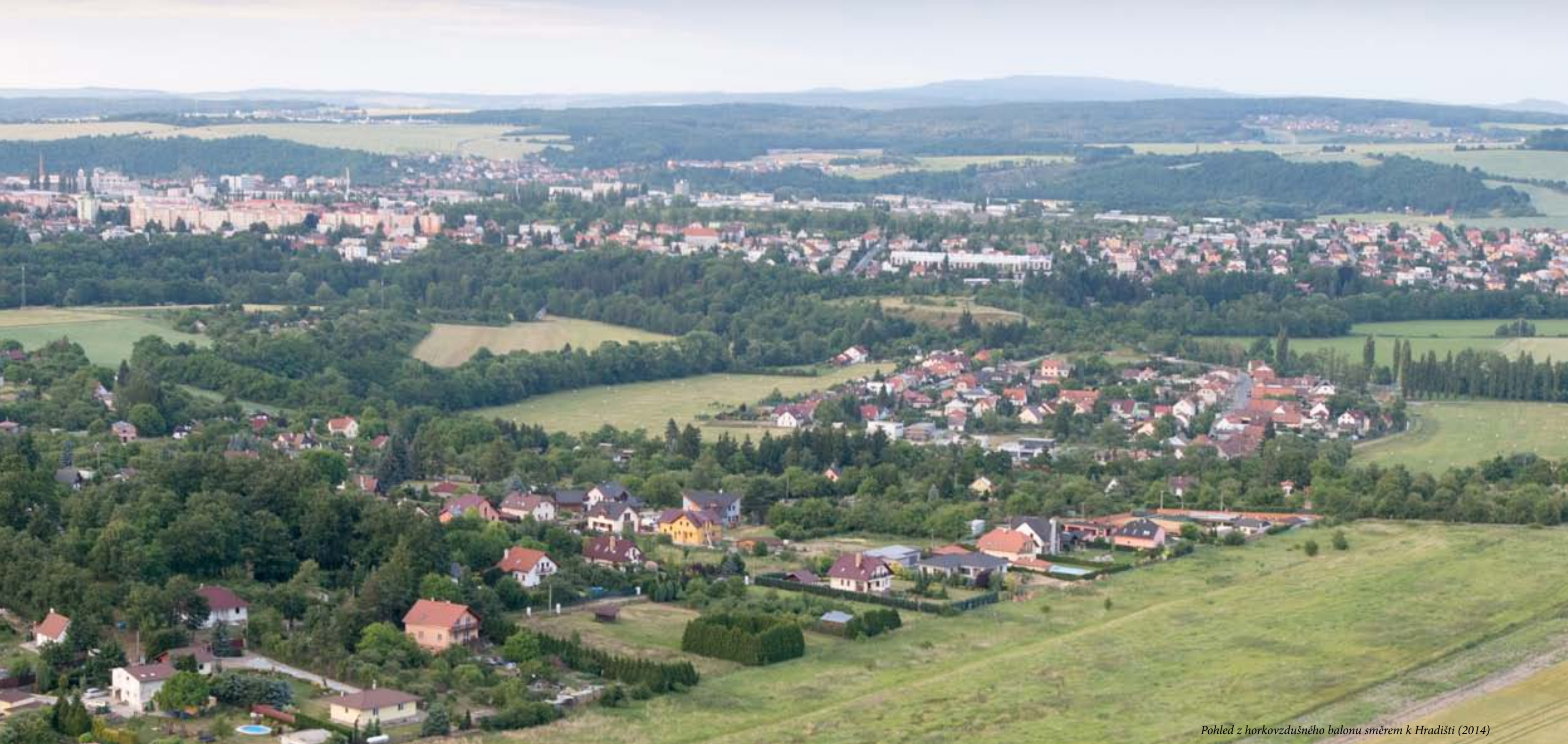
Pohled z horkovzdušného balonu směrem k Hradišti (2014)