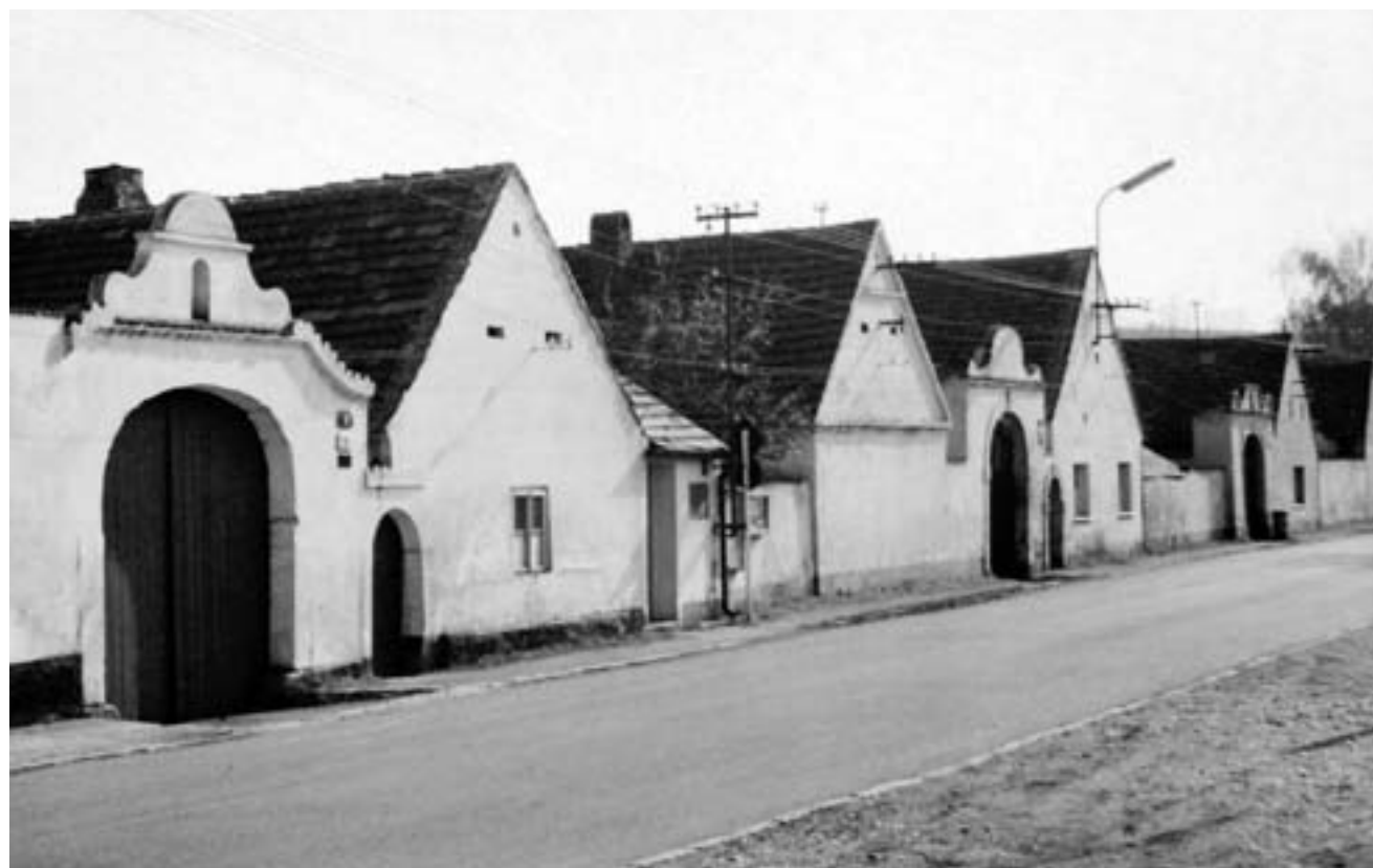
Statky č. 1, 2 a 3 (zleva) v ulici Na Rychtě (1976)