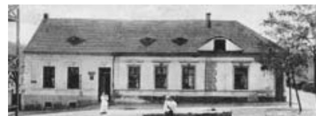
Hostinec s již přistavěnou kuchyní (20. léta 20. století)