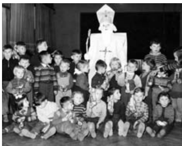
Mikulášská v sokolovně (1958)