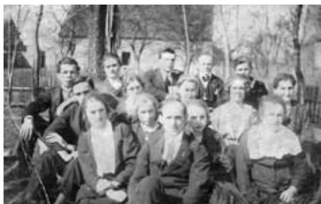
Hradištský pěvecký sbor (20. léta 20. století)