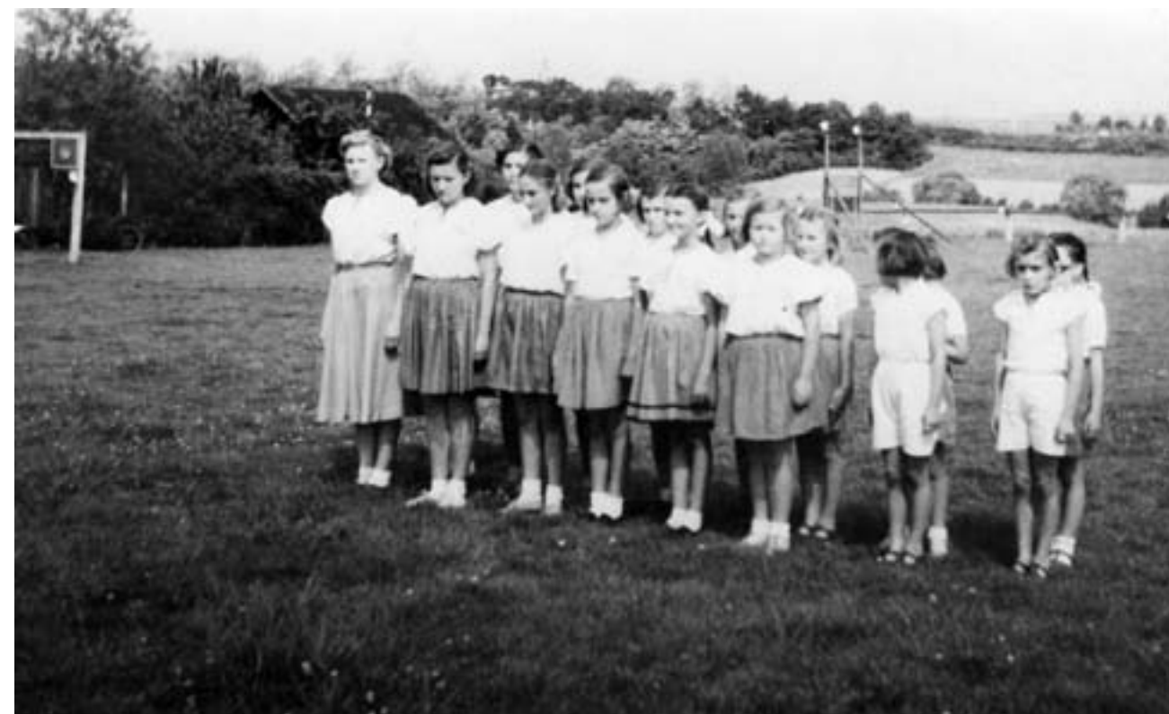
Nástup cvičenek na fotbalové hřiště (60. léta 20. století)