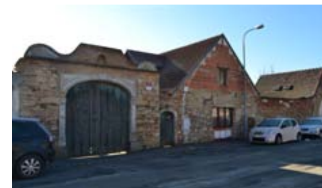
Statek č. 3 (2019)