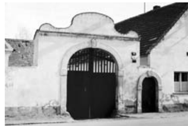
Statek č. 2 (1976)