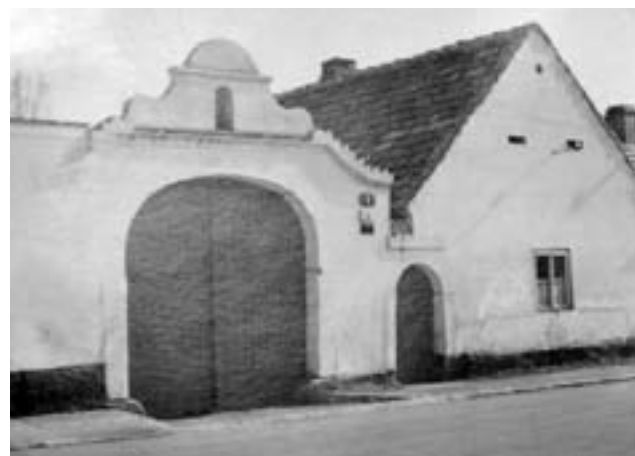
Statek č. 1 (1978)