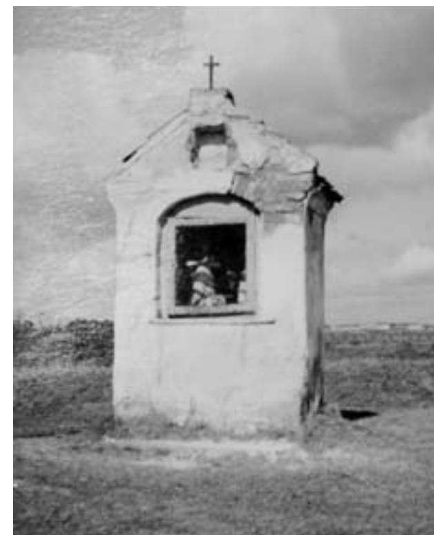
Výklenková kaplička (1943)

Drobná výklenková kaplička stojí u silnice před vjezdem do Hradiště od roku 1845.