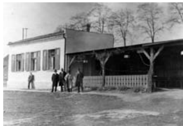
Výčep a sokolovna v Hradišti (30. léta 20. století)

Od roku 1992 fungovala hospoda v Hradišti pod jménem U Horbenů. Po velké rekonstrukci hospody a přilehlého okolí je celý areál od roku 2012 známý Plzeňanům jako Plovárna Hradiště.