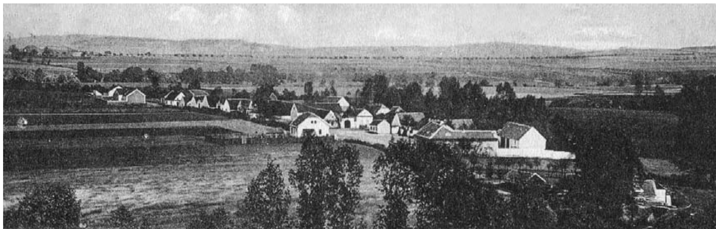
Výřez z pohlednice, pohled na Hradiště od západu (20. léta 20. století)

směrem k nepomucké silnici přimykalo se k hradišti ještě předhradí, jehož skrovnější opevnění dávno zaniklo beze stopy za tisíce let zemědělské práce.“