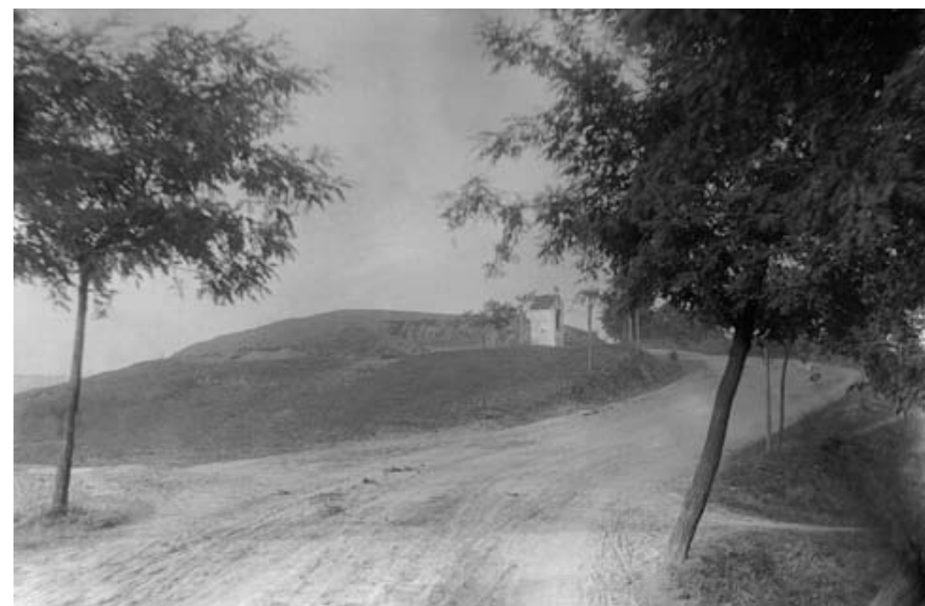
Kaplička u cesty (1910)