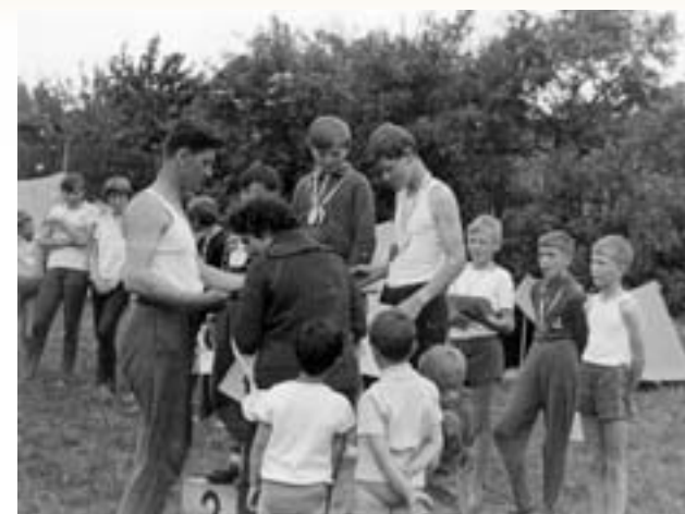
Dětský den (1965)