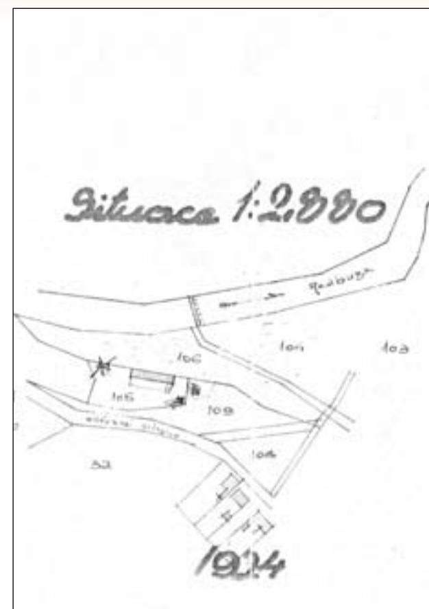
Situační plán sokolovny v Hradišti (1924)