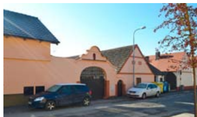
Statek č. 1 (2019)