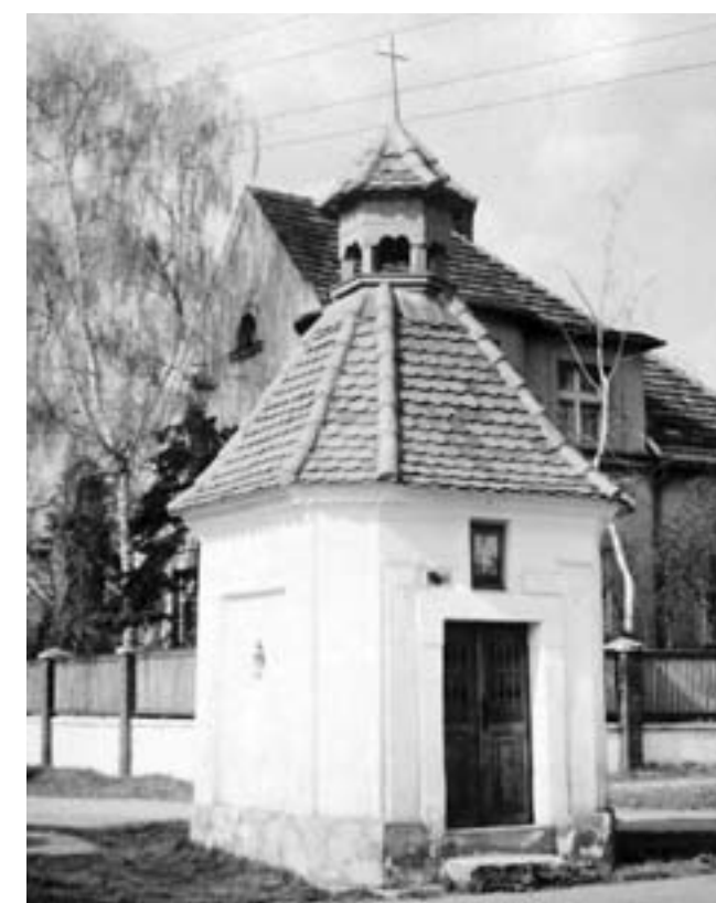
Návesní kaple (1910, 1976)