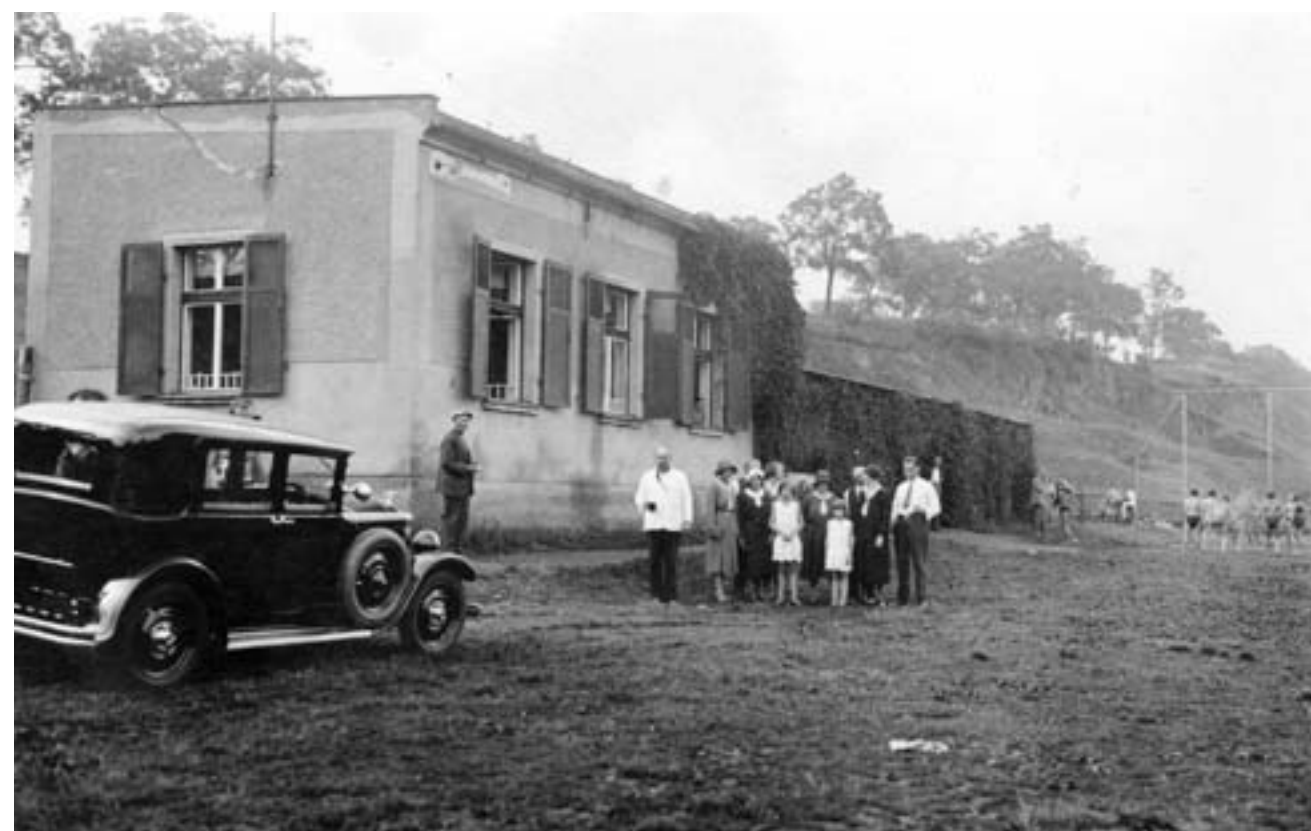
Původní sokolovna a výčep. Zajímavostí fotografie je v popředí první plzeňské taxi. (po roce 1925)