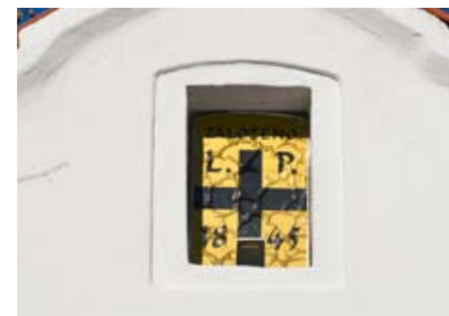
Výklenková kaplička dnes (2019)