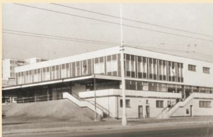
Nákupní středisko Gera po dokončení (1978)