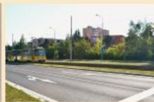
Pohled z Gerské ulice směrem ke Kralovické ulici na sídlišti Košutka (1986)