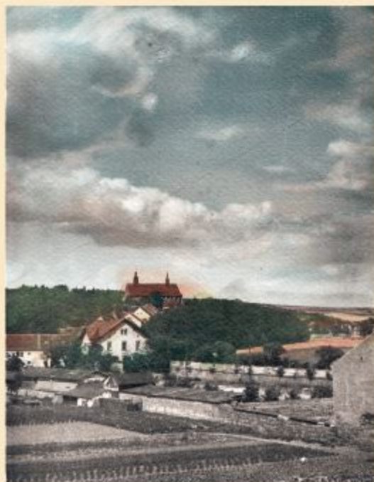
Pohled na kostel Věch svatých ze dvora čp. 100 (začátek 20. století)