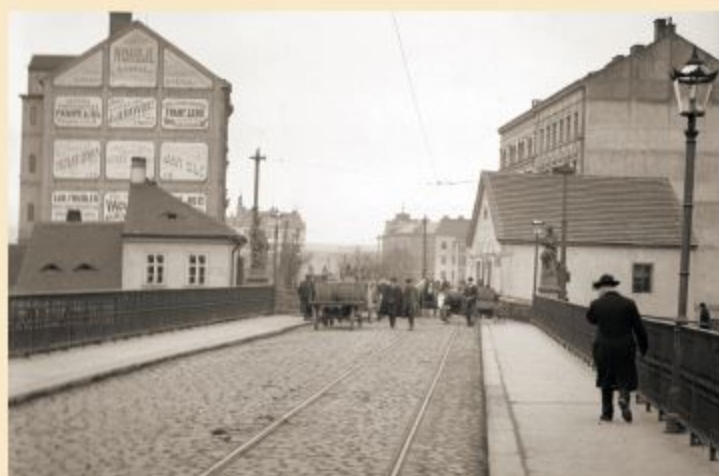
Začátek Karlovarské (O. Beníškové) ze Saského (Rooseveltova) mostu. Na snímku ještě chybí dům U Dítětů (U Slunce), ale již je v provozu tramvajová trať z roku 1899. (začátek 20. století)