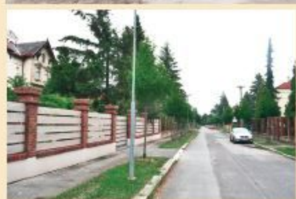
Vilová čtvrť na Lochotíně. Pohled ulicí Karoliny Světlé směrem k Libušinské ulici. (začátek 20. století)