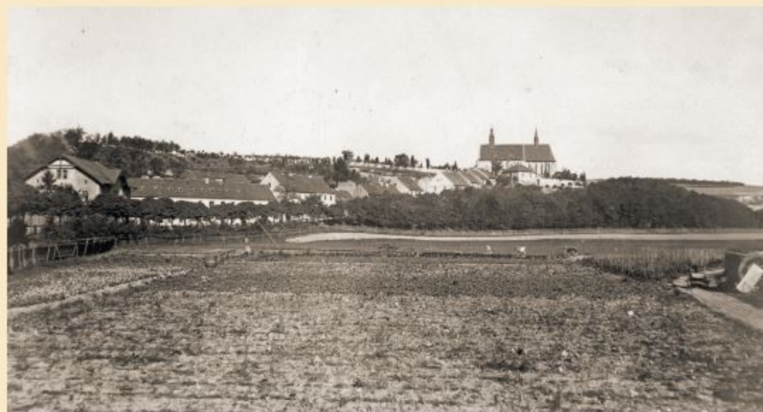
Ulice Pod Věmi svatými. Vlevo budovy hospodářského dvora čp. 100, které byly zasaženy při náletu v době druhé světové války. Dvůr patřil v 18. století významnému plzeňskému staviteli Jakubu Augustonovi. Na jižní straně navazovala na dvůr rozsáhlá zahrada. V těchto místech jsou dnes tenisové kurty. (začátek 20. století)