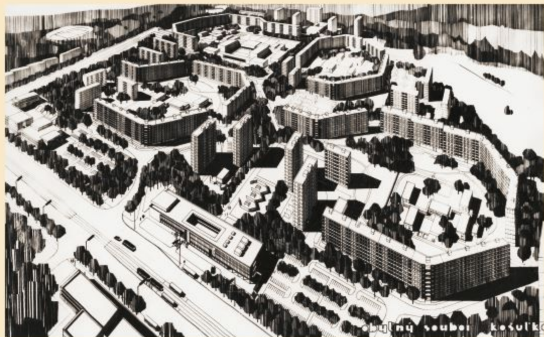
Vizualizace sídliště Košutka – dílo architekta Z. Tichého (před rokem 1980)