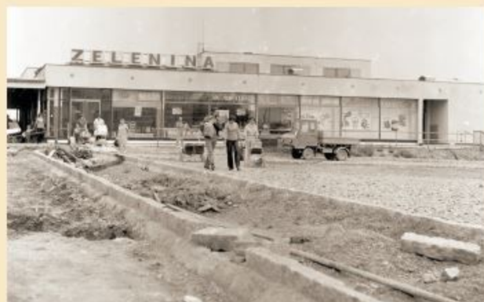
Pohled na parkoviště u Gery (po roce 1978)