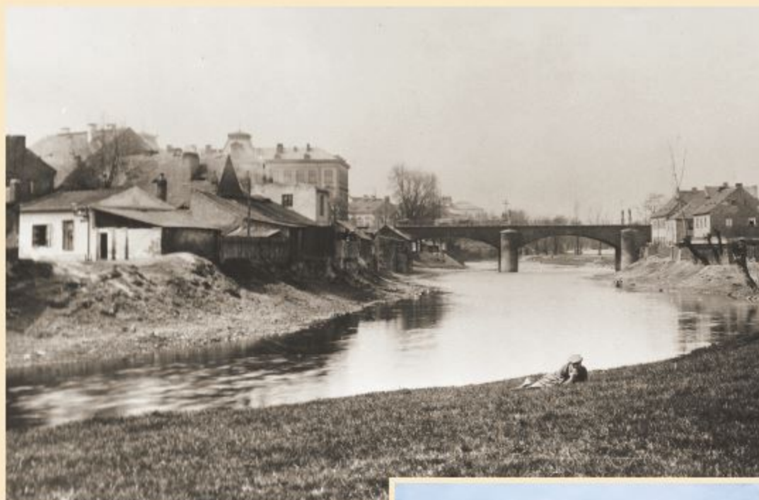
Pohled z Roudné na Rychtářku a Saský (Rooseveltův) most. V pozadí budova českého dívčího lycea z roku 1907. (1910)