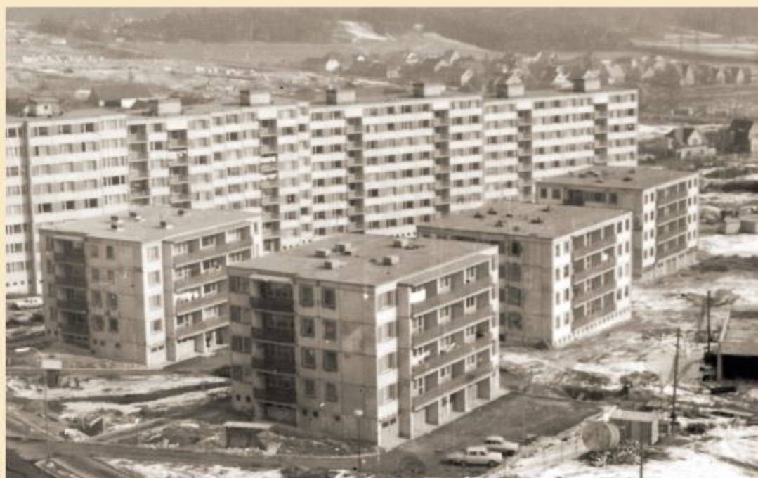
„Kostky“ a panelový dům v Majakovského ulici (1979)