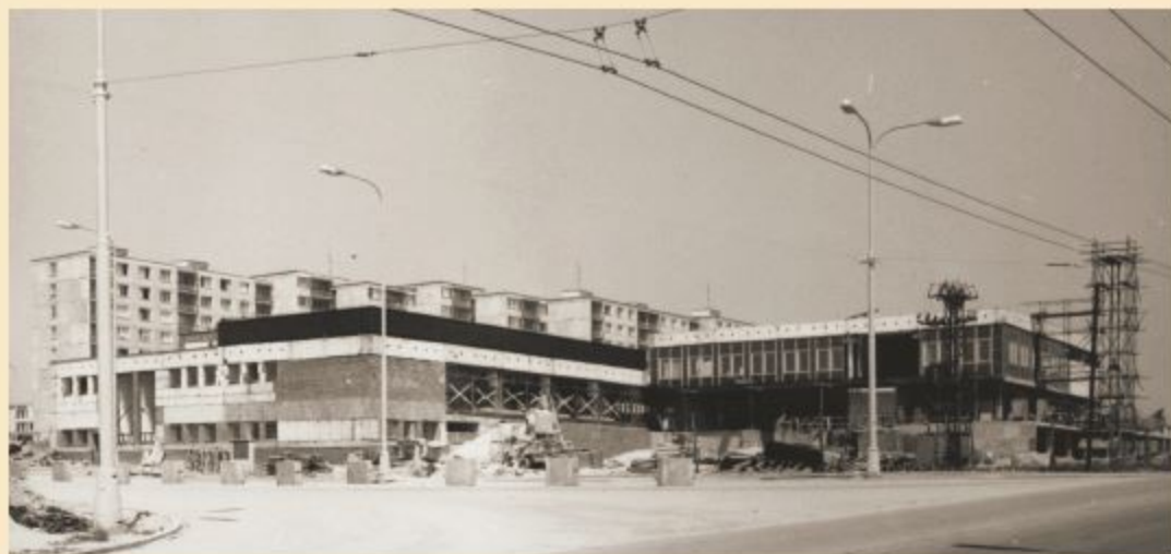
Nákupní středisko Gera, pojmenované po družebním městě v tehdejší Německé demokratické republice, bylo otevřeno 2. října 1978 (1977)