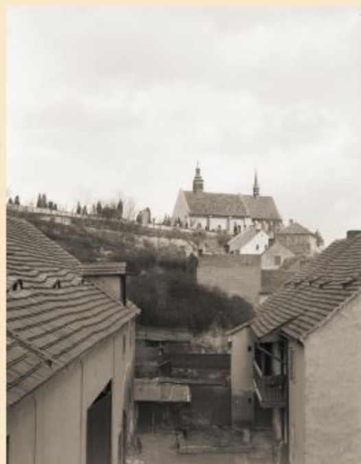
Ulice Pod Věmi svatými a kostel Věch svatých na kolorované pohlednici (začátek 20. století)