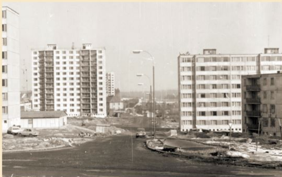
Komenského ulice, vlevo ústí Sokolovská, vpravo panelový dům v Majakovského ulici, v pozadí Kaznějovská ulice (1979)