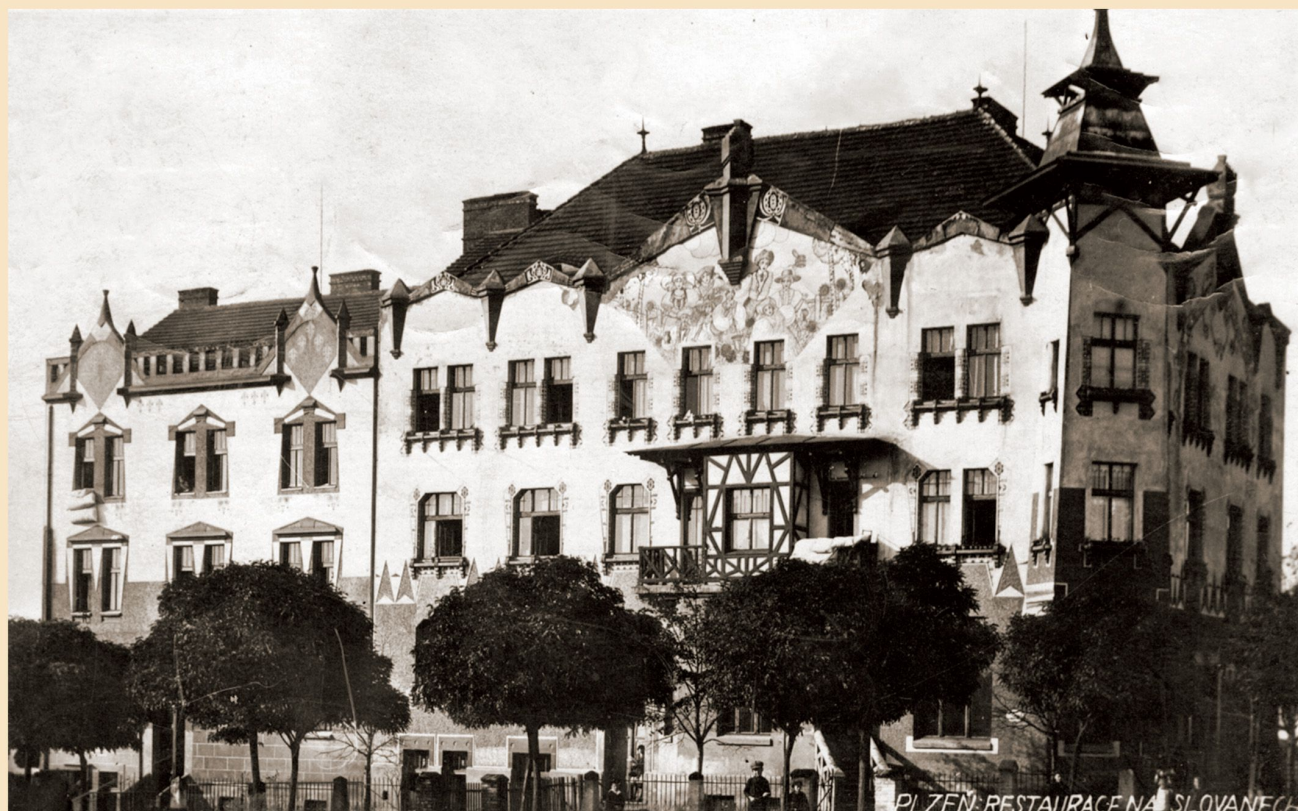
Restaurace Na Slovance patřila až do roku 1920 plzeňskému Měšťanskému pivovaru (dvacátá léta 20. století)