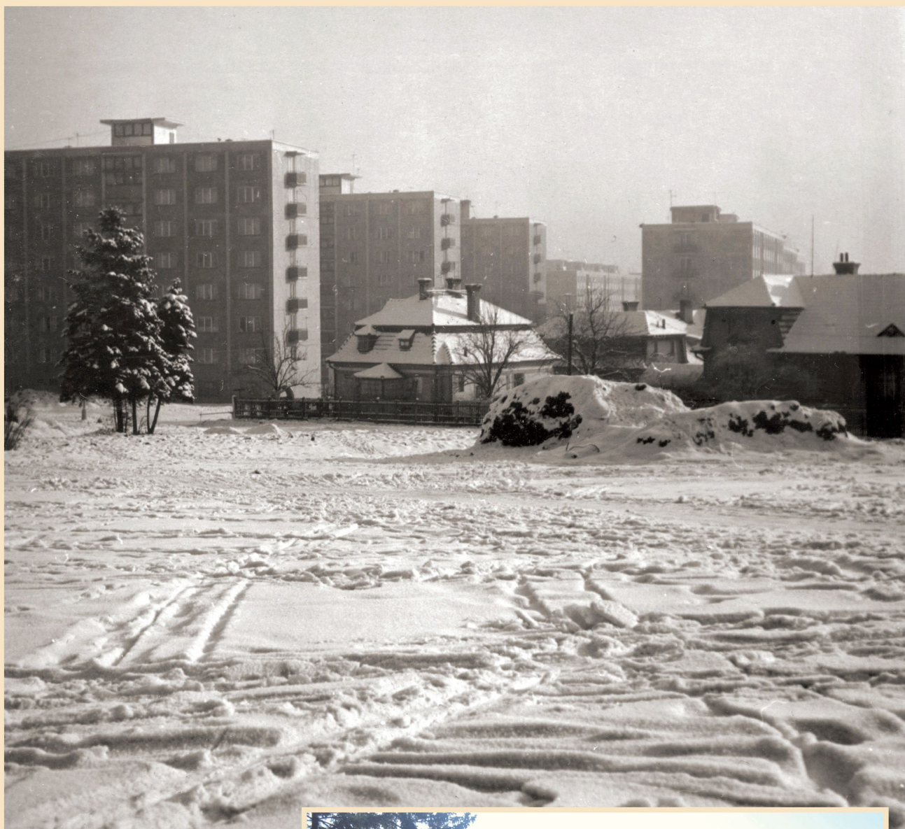
Pohled od Homolky na skupinu paneláků mezi ulicemi Nepomucká a Zelenohorská (sedmdesátá léta 20. století)