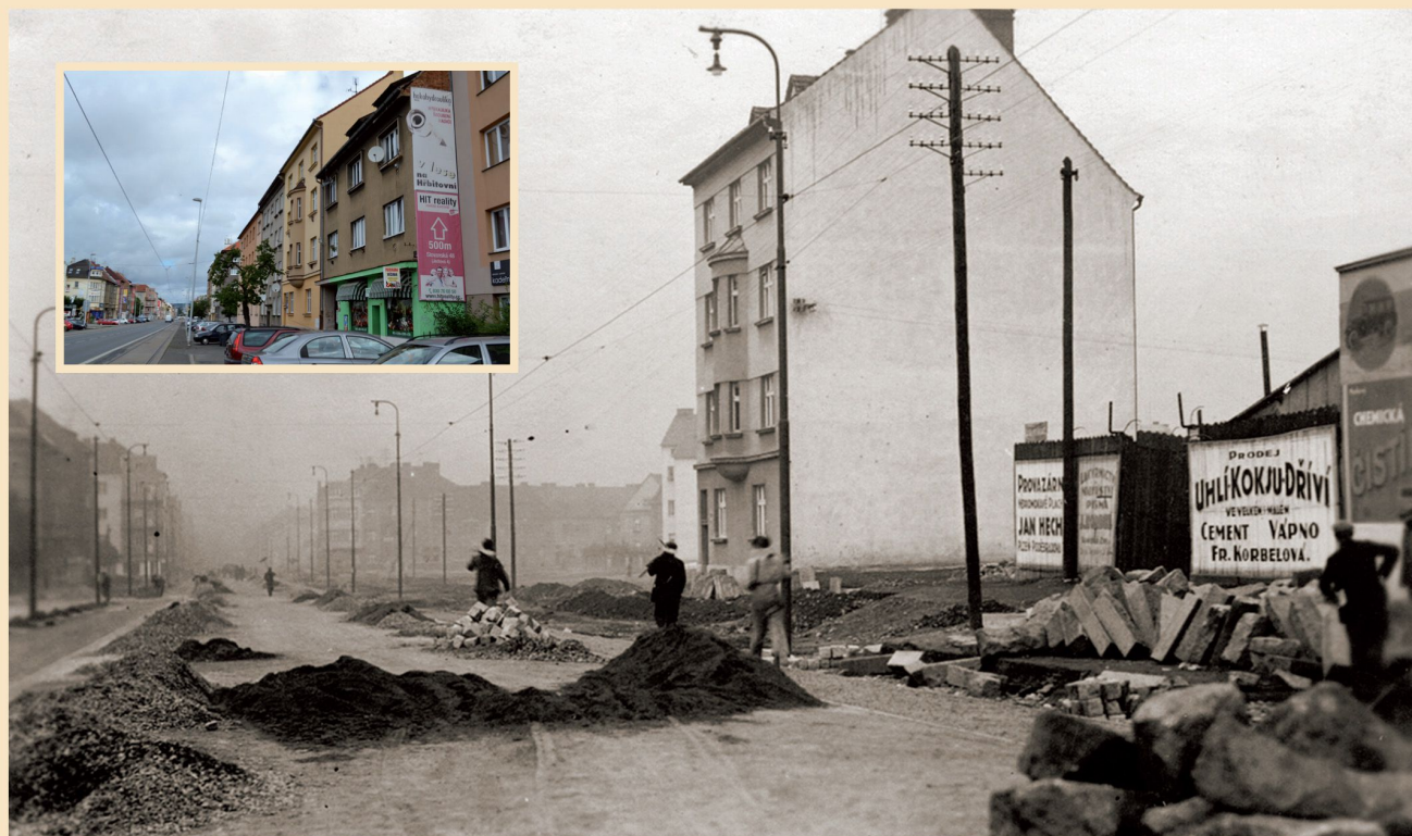
Slovanská ulice pod křižovatkou s Částkovou ulicí v době, kdy zde stál jen jeden dům (třicátá léta 20. století)