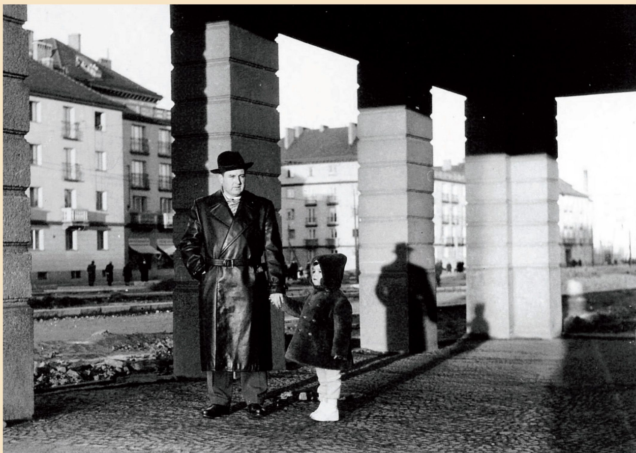
Procházky na náměstí Otty Synka (náměstí Milady Horákové) (kolem roku 1960)