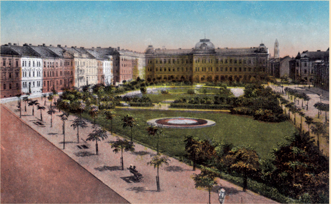
Park na Mikulášském náměstí byl otevřen v roce 1902 (po roce 1913)