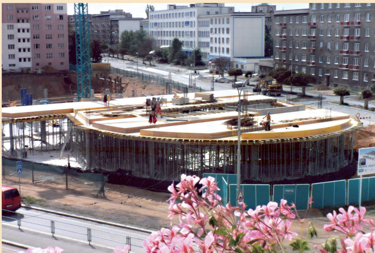
Výstavba Galerie Dvořák (dnes Galerie Slovany) mezi ulicemi Koterovská a Francouzská. Otevřena byla v listopadu 2007.