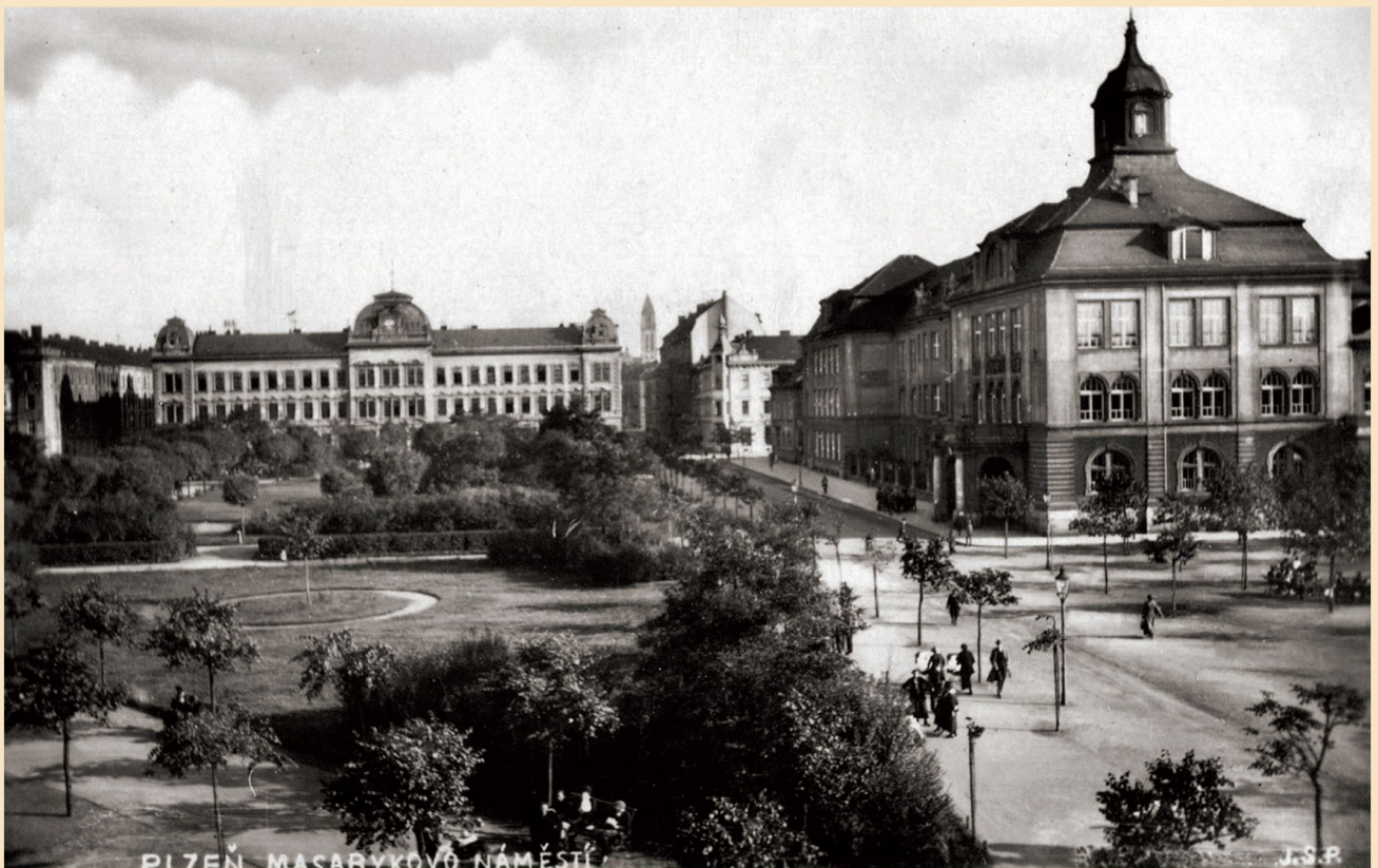
Další výraznou školní budovou na Mikulášském náměstí byla II. česká státní reálka, postavená v letech 1908–1913 podle návrhu architektů Ferdinanda Havlíčka a Rudolfa Kříženeckého (dvacátá léta 20. století)