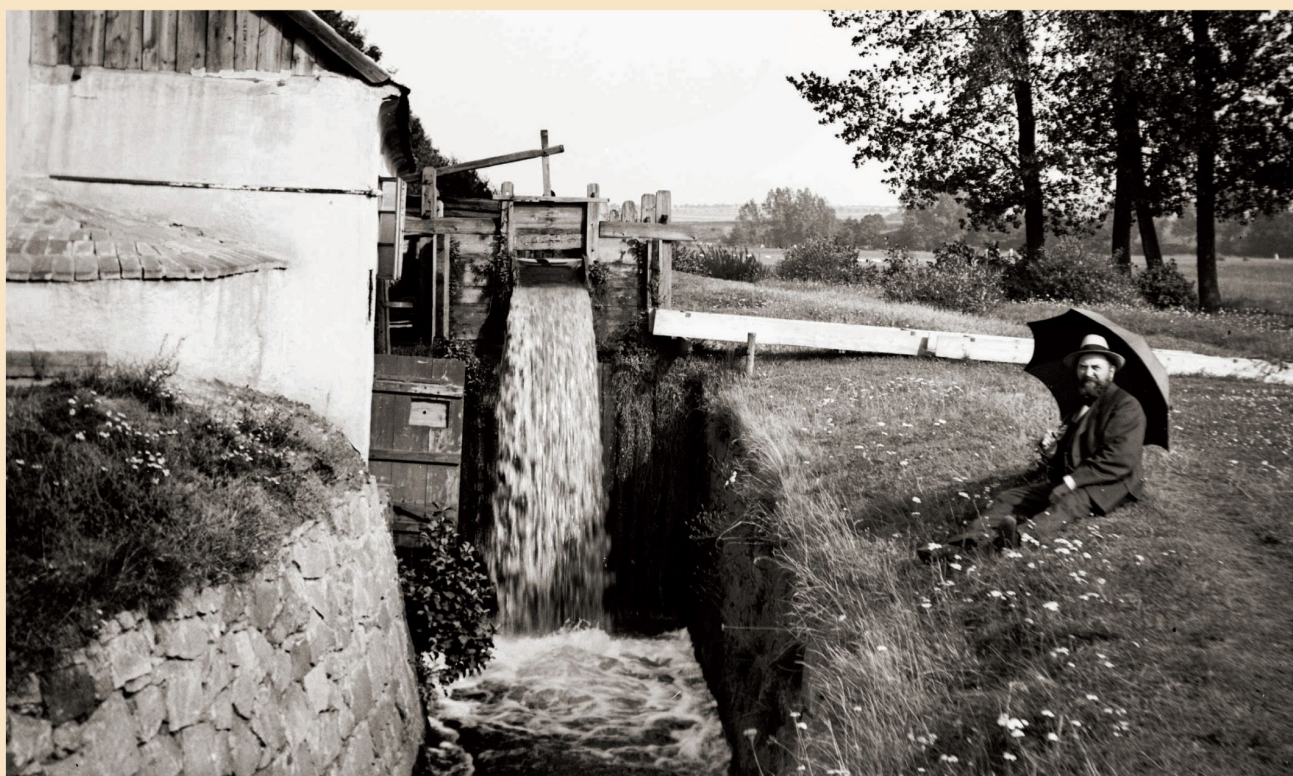
Starý hamr v Hradišti (1907)