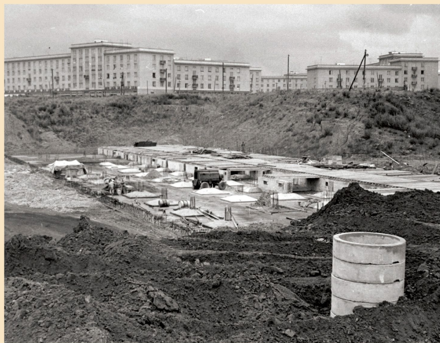
Pohled přes stavbu Centrogaráže na budovy v Krejčíkově a Koterovské ulici (šedesátá léta 20. století)