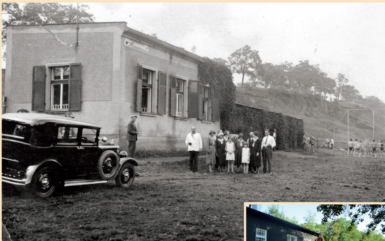
Hospoda U Splavu patřila vždy k oblíbeným rekreačním místům. Později se jmenovala U Horbenů, dnes je to Plovárna Hradiště. (třicátá léta 20. století)