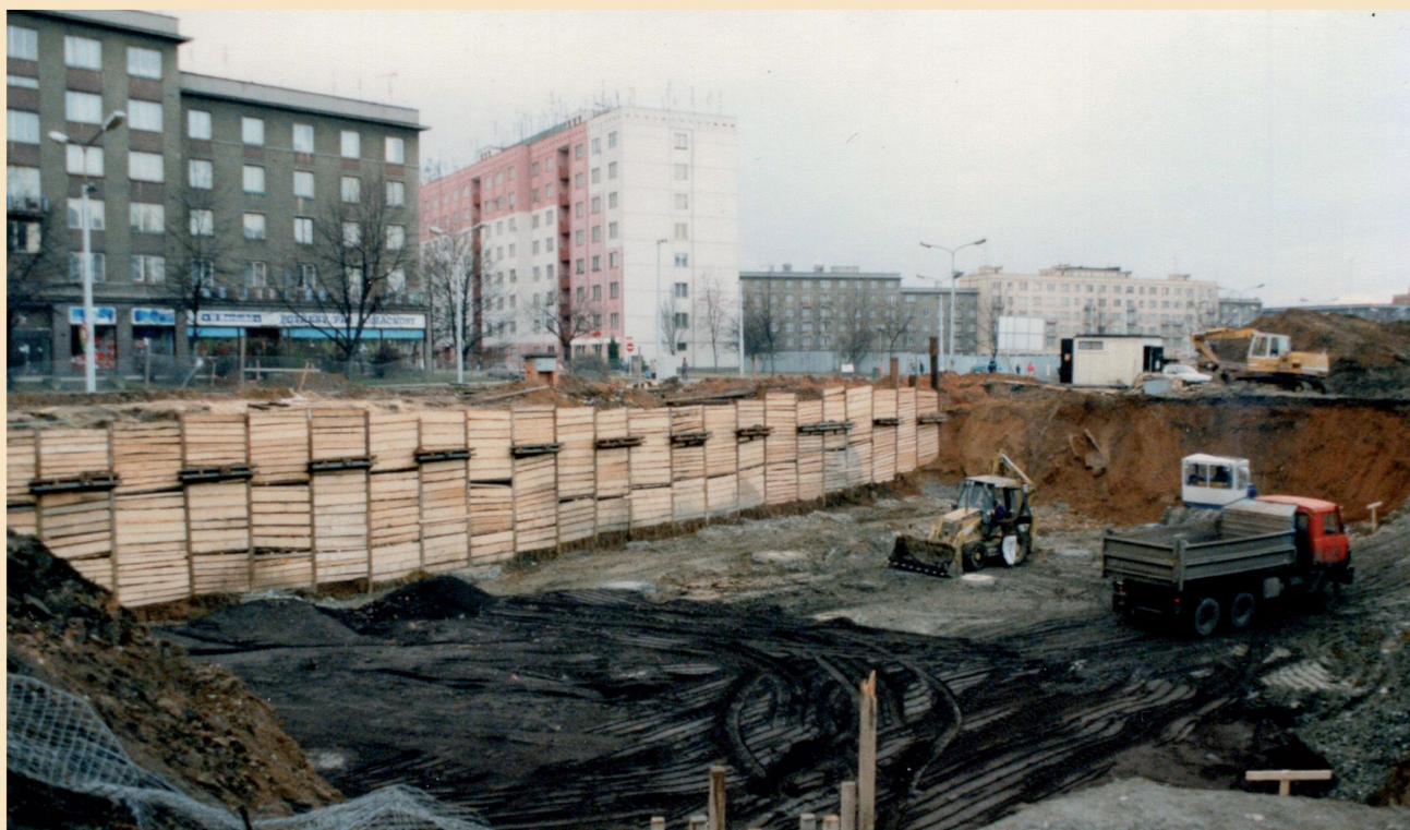
Budování základů radnice na Slovanech na Koterovské, projekt získal ocenění „Stavba roku 1999“ (1997)