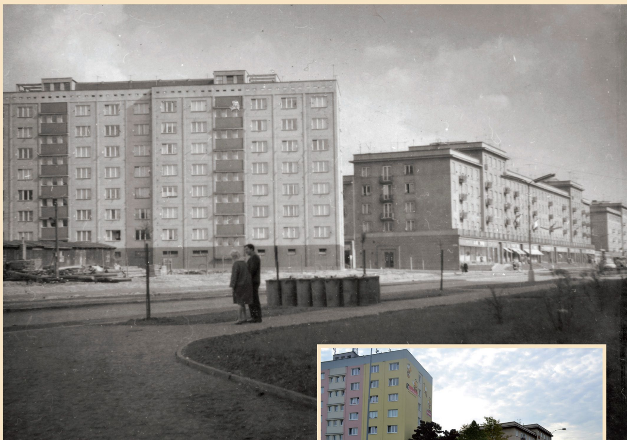
Francouzská ulice (šedesátá léta 20. století)