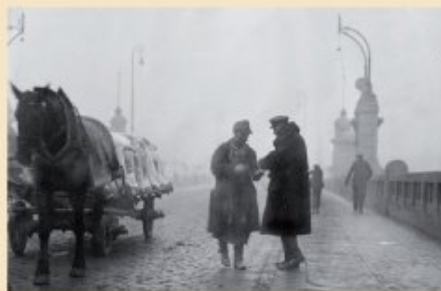
Až do roku 1925 se na mostě vybíralo mýtné (kolem roku 1920)