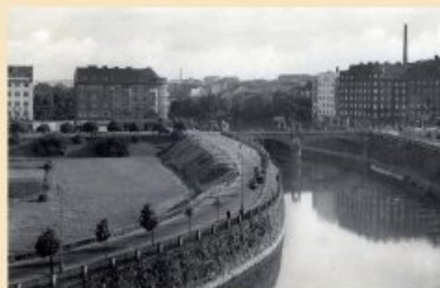
Pohled na nábreží s Wilsonovým mostem s mýtnicemi po obou stranách, který spojil část Pražského Předměstí za Radbuzou s městem (třicátá léta 20. století)