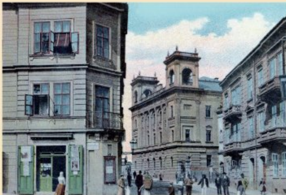
Pohled na Fischerovu vilu ještě obklopenou domy v Komenského a Pobřežní ulici (začátek 20. století)