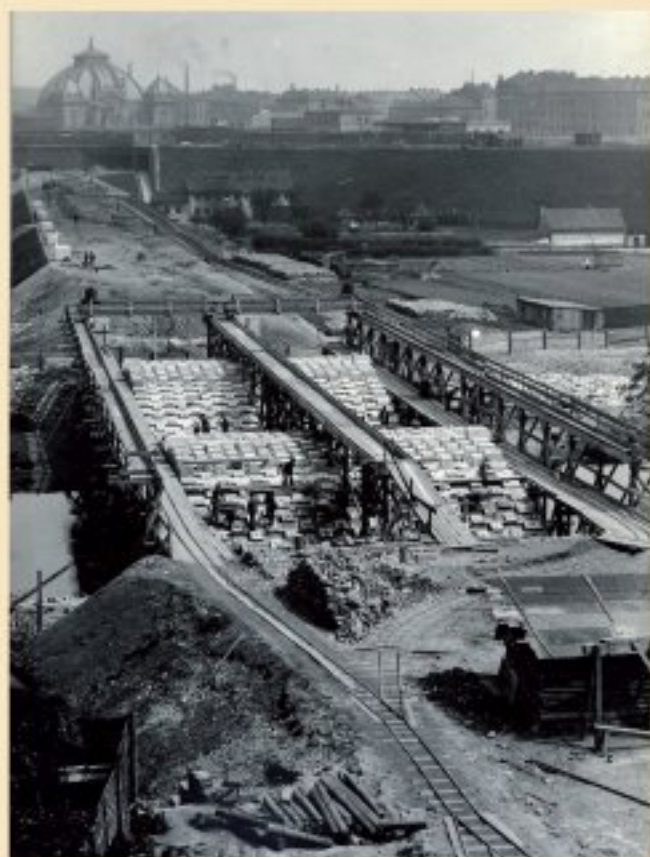
Stavba mostu Císaře Františka Josefa I, firmou Müller & Kapsa (1912)