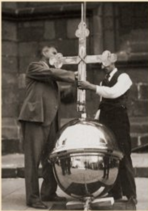
Usazování makovice a kříže na opravenou špičku věže kostela sv. Bartoloměje (1935)

Sušení obilí na náměstí v rámci akce „Boj o zrna“. Vlivem špatného počasí začaly žně v roce 1955 později a rolníci museli obilí dosoušet. Členové JZD Bolevec si vybrali k dosoušení plochu náměstí. (1955)