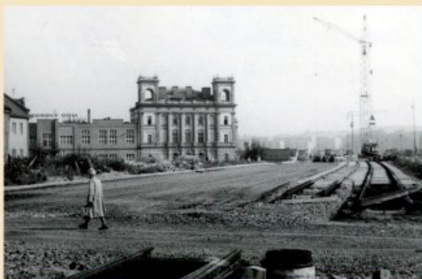
Stavba komunikace na Severní Předměstí notně změnila podobu této lokality (osmdesátá léta 20. století)