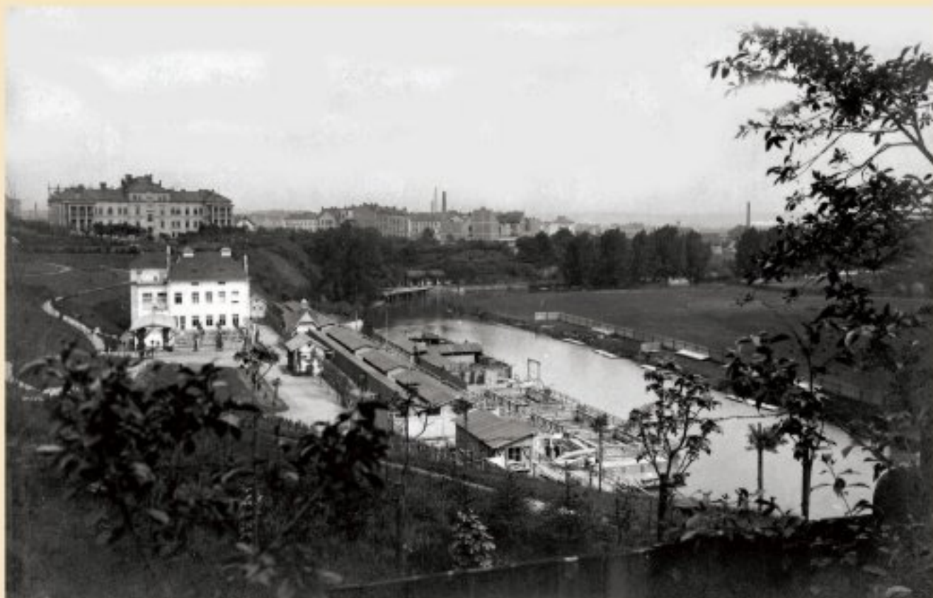
Městská plovárna na Radbuze pod Doudleveckou ulicí (před rokem 1918)