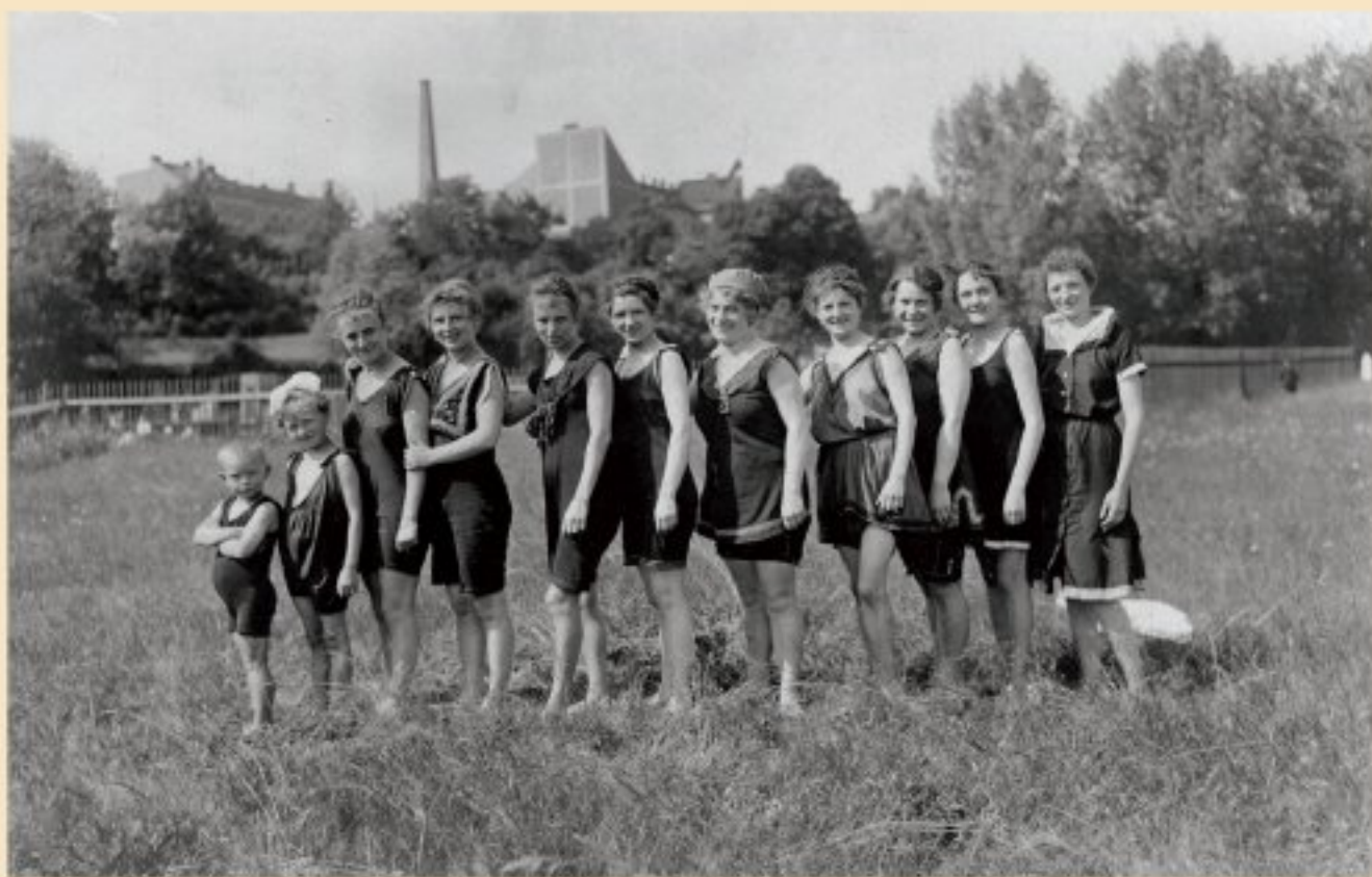
Na městské plovárně (před rokem 1918)