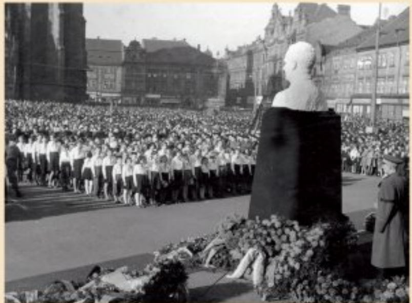
Tryzna na náměstí při pohřbu Klementa Gottwalda. Na plzeňském náměstí se sešly podle odhadů desítky tisíc lidí. (1953)

Sušení obilí na náměstí v rámci akce „Boj o zrna“. Vlivem špatného počasí začaly žně v roce 1955 později a rolníci museli obilí dosoušet. Členové JZD Bolevec si vybrali k dosoušení plochu náměstí. (1955)