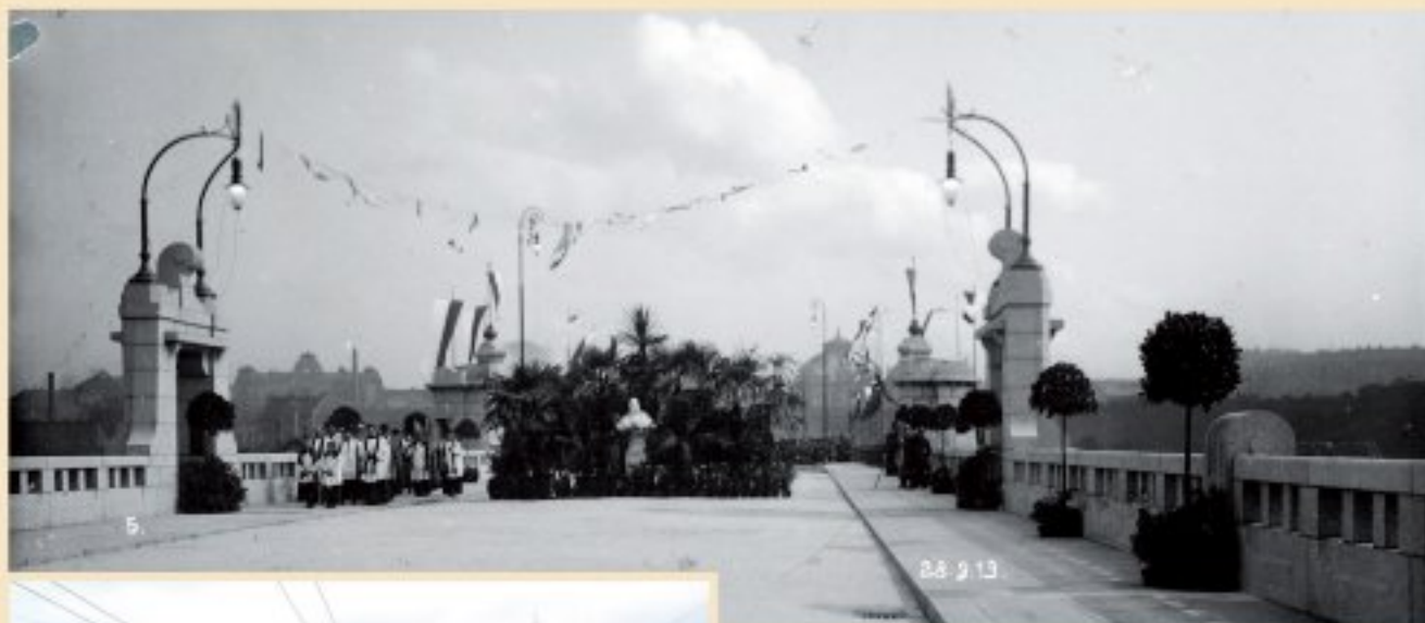
Slavnostní otevření mostu Císaře Františka Josefa I. (dnes Wilsonův) v září 1913