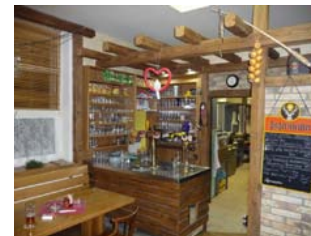
Výčep restaurace v sokolovně, 2013.