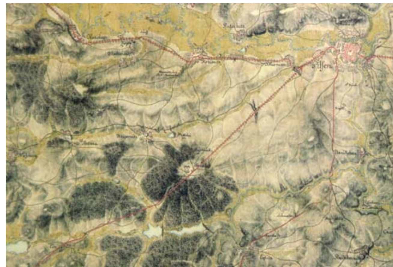
Na výřezu mapy prvního vojenského mapování Čech, Moravy a Slezska z let 1780–1783 je vyznačena dálková komunikace, která tudy vedla z Prahy do Řezna kolem zájezdního hostince zde zakresleného. Je vidět, že panský dvůr Grünhof s hospodou a přilehlými staveními byl postaven na vykloučené části borového lesa na kopci. Mapa: Plzeň na I. vojenském mapování Čech, Moravy a Slezska. 1780–1783. Detail. In: Historický atlas měst ČR, svazek č. 21, mapa č. 9 (detail). Rukopisná kolorovaná mapa, grafické měřítko 1 : 27 800, výřez. Počítačové zpracování Václav Čada. Plzeň, statutární město Plzeň, Praha, Historický ústav v. v. i., 2009 © 1st Military Survey, Section No. 156, Austrian State Archive/Military Archive, Vienna © Laboratoř geoinformatiky, Univerzita J. E. Purkyně v Ústí nad Labem © Ministerstvo životního prostředí ČR.