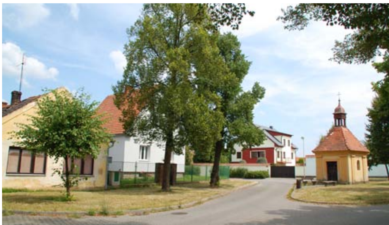
Návěs na Nové Hospodě s kapličkou v roce 2013.

Letiště Bory, od roku 1910 první oficiální letiště u nás, zažilo přítomnost několika cizích vojsk – německých při fašistické okupaci, amerických při osvobození v roce 1945 a ruských při invazi vojsk Varšavské smlouvy v srpnu 1968.