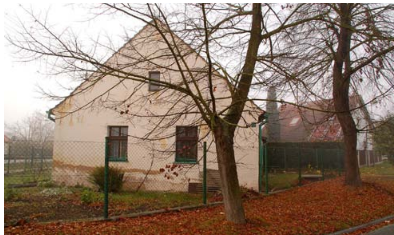
Na snímku z října 2008 je dům čp. 24 tak, jak vypadal po přestavbě z bývalé kovárny na obytný dům se čtyřmi místnostmi. O rok později byl novým majitelem zbourán.