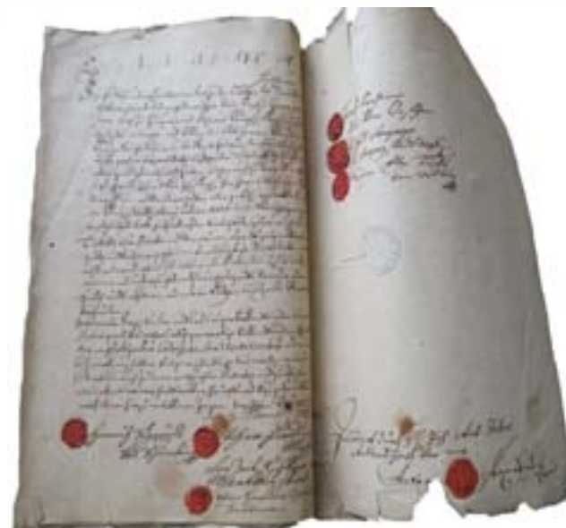
Nejstarší dochovaná písemnost o Nové Hospodě je z roku 1713. Příznávací tabela poddaných v rustikálním katastru, tzv. tereziánském pro Grünhof na býv. panství Křimice ze dne 2. listopadu 1713 – Tereziánský katastr, inv. č. 2207, fol. 69, 70.

Název Grünhof se týkal pouze panského dvora, při němž byla postavena zájezdní hospoda, jež dala název nově vznikající vsi Nová Hospoda (Nova Popina). Ačkoliv první písemný