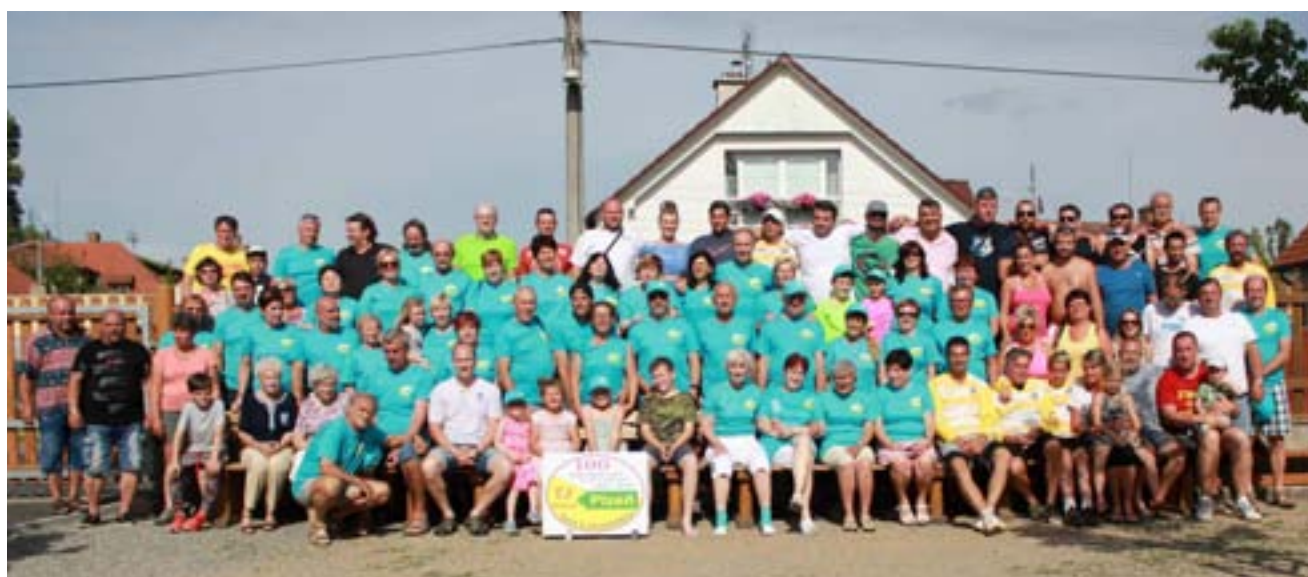
Hromadné foto členů u příležitosti oslav 100 let tělovýchovy na Nové Hospodě, 15. června 2019.