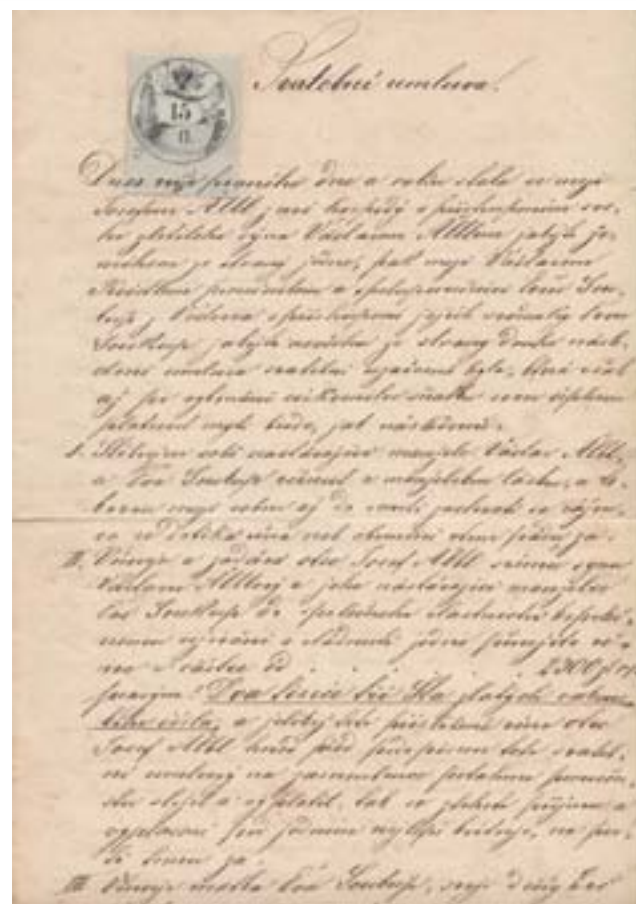
Úvodní strana satební smlouvy Václava Albla a Evy Soukupové z roku 1869.

dvanácti třinácti let. Přišel pravděpodobně z Broumovského opatství, kde se dosud naše příjmení vyskytuje. Oženil se v roce 1668 a měl devět dětí, z nichž posledním dítětem, narozeným roku 1686, byl náš bezprostřední prapředek, Bartoloměj Albl.