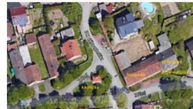
Situační poloha budovy starého zájezdního hostince U Zeleného dvora, později zvaného u Janoušů. Hospoda, nad kterou byla i sýpka, se nacházela v čp. 1. Nápis s letopočtem se nachází na štítu mezi budovou hospody a pozdější přístavbou.