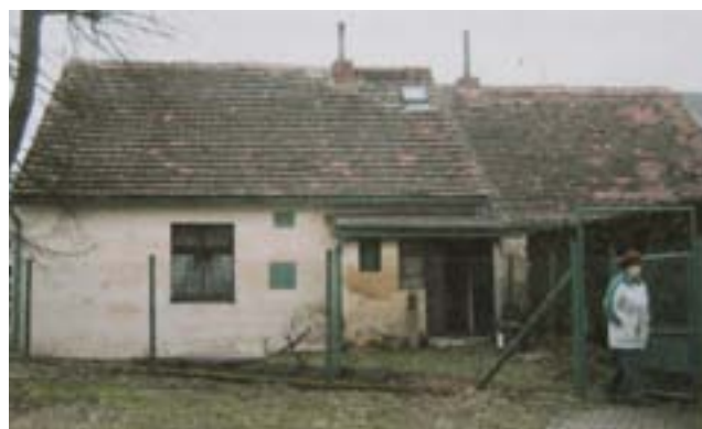
Dnes již neexistující dům rodiny Hauerů s přilehlou místností bývalé kovárny.