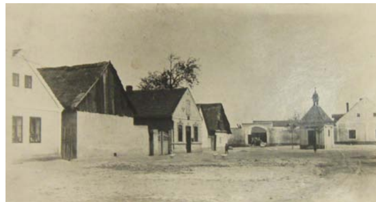
Náves s kapličkou na Nové Hospodě v roce 1905.