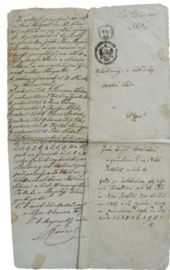
Žádost o povolení stavby kapličky z roku 1857.