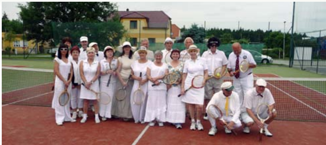
Setkání členů oddílu tenisu, který byl ustaven v roce 2012, se o čtyři roky později neslo v retro stylu.