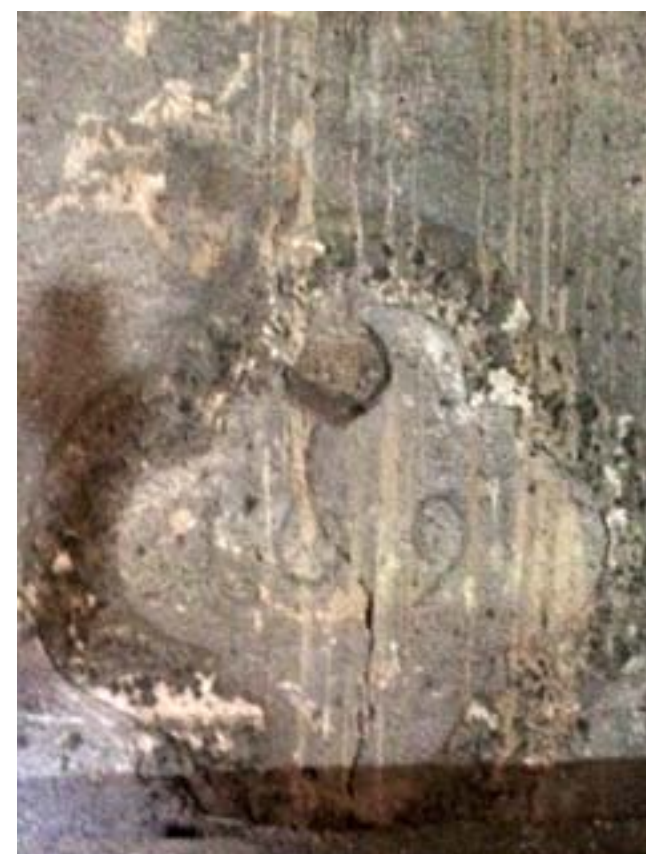
Přesto, že uběhla již tři staletí, je na vnitřní straně staré sýpky statku u Janoušů stále dosud patrný letopočet 1691 s erbem rodu Vrtbů v malém znaku v horní části. Pod jejich správou spadala Nová Hospoda až do roku 1830, kdy umírá poslední majitel František Josef z Vrtby a všechny jeho majetek přechází darem na Jana Karla z Lobkowicz.

Archiv města Plzně, rkp. i. č. 2157, sign. 8e66, nefol. Bělohávek, Miloslav: Plzeňská předměstí. Plzeň, Nava 1997, s. 84. Sklenář, Karel: Archeologické nálezy v Čechách do roku 1870, Národní muzeum, 1992, s. 169. Zeman, Adolf: Plzeň v první polovině XVIII. století. Poměry hospodářské a sociální. Prameny a příspěvky k dějinám města Plzně, sv. 7, Plzeň 1947, s. 252–253.