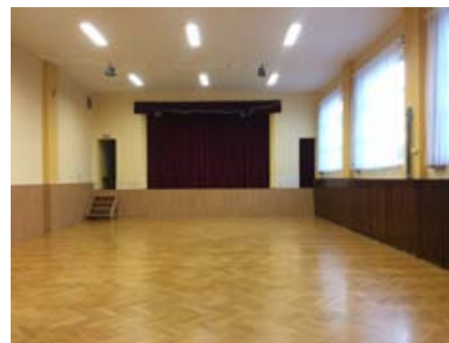
V roce 2017 proběhla oprava podlahy na jevišti, výměna opony a obložení stěn v tělocvičně.