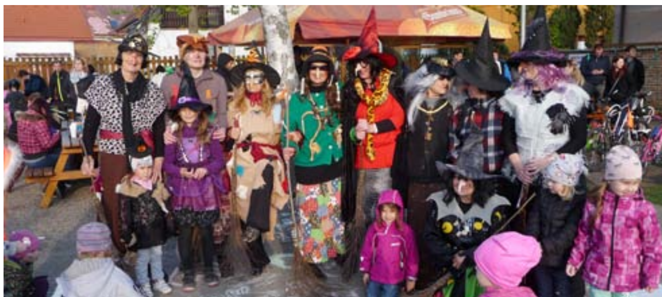
Jednou z tradičních akcí je slet čarodějnic v předvečer 1. máje, 2017.