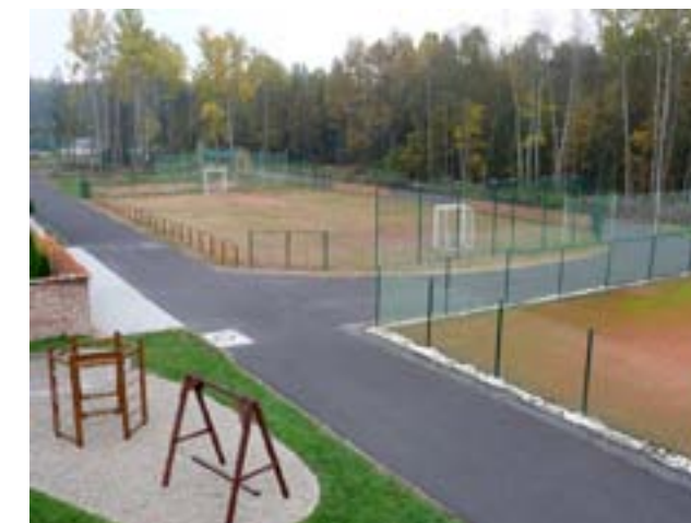
Dráha na in-line bruslení byla vybudována v roce 2013.