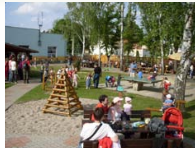
Zahrada a dětské hřiště prošly rekonstrukcí po roce 2006, na snímku podoba v roce 2010.