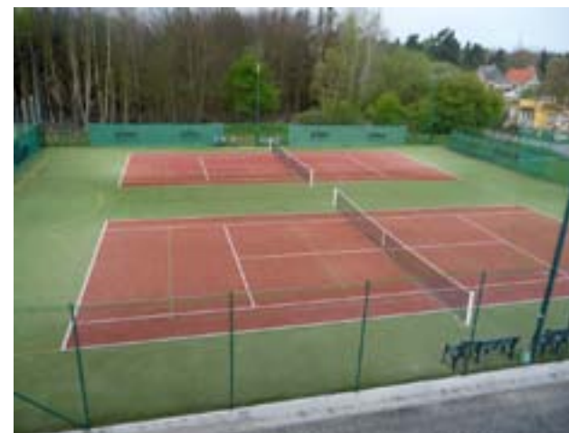
Od roku 2009 mohou tenisté na Nové Hospodě využívat dva kurty s umělým povrchem.