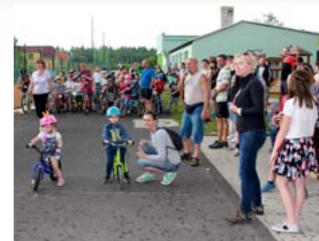
Cyklistické závody v rámci dětského dne, 2016.