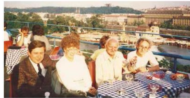
➤ Já s přáteli v restauraci EXPO 58 na Letné, srpen 1967