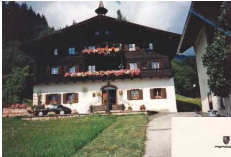
➤ Další vila rodiny Porsche v Zell am See