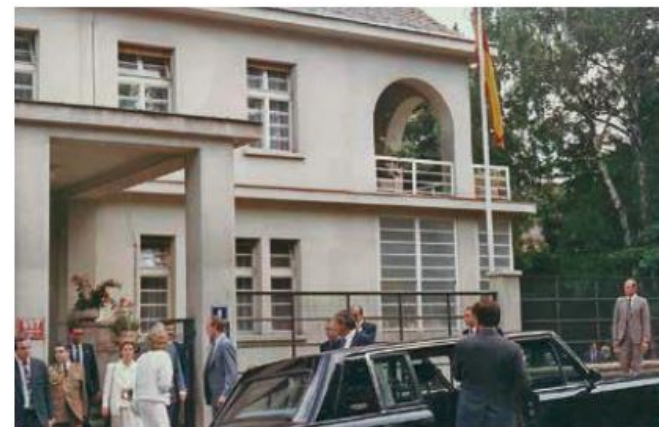
⚡ Chystám se s kolegy obsluhovat španělského krále (já stojím zcela uprostřed)