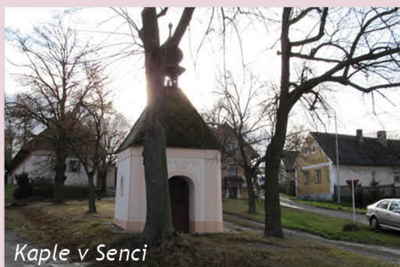
Kaple v Senci

ustupovali francouzští vojáci před vojskem císařovny Marie Terezie kolem Sence a hodlali v noci obec přepadnout a vyloupit.