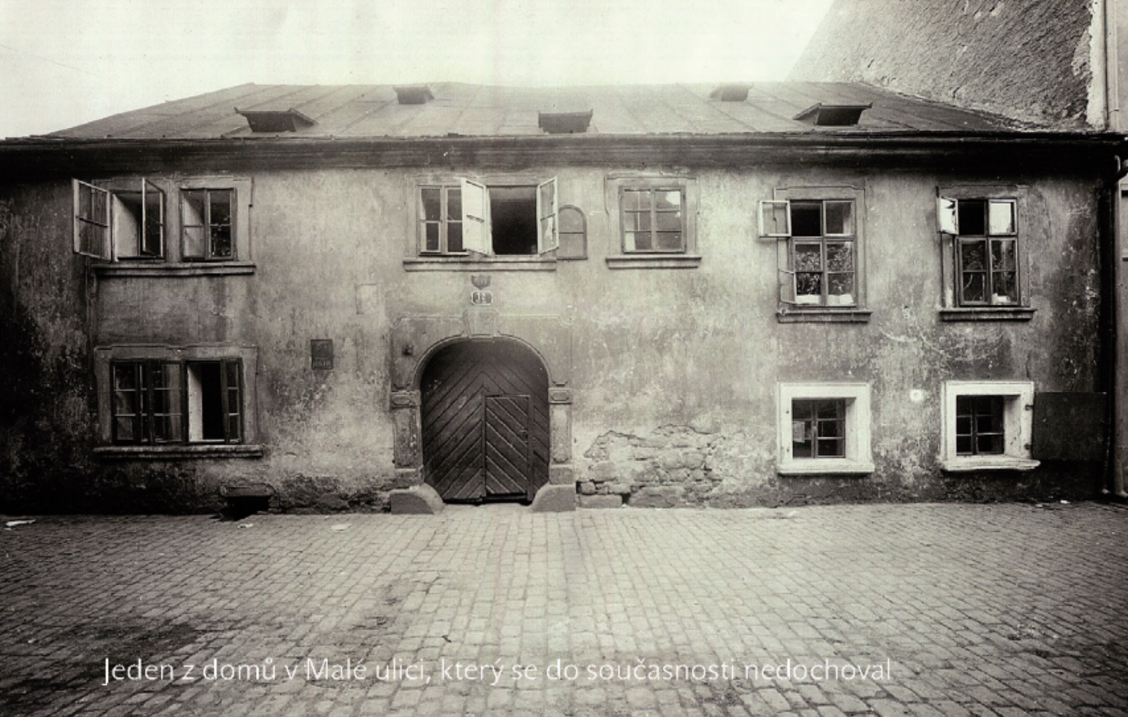
Jeden z domů v Malé ulici, který se do současnosti nedochoval

Malá ulice se tak vždy jmenovala a vždy taková i byla – nejužší z plzeňských ulic, vlastně spíš ulička spojující prostor u dominikánského kláštera a u Malické brány. Domy zde nevynikaly zvláštní výstavností. I zde však bydleli měšťané s právem várečným. Svého času tu z jednoho domu zůstala právě jen ta právovárečná vrata – hrubý gotický portál, který plnil úlohu jakési akcie a říkalo se o něm, že to jsou nejdražší vrata ve městě. Dnes je Malá ulice v jistém smyslu ještě menší než dříve – v druhé polovině 20. století řada domů zanikla a místo nich jsou zde dnes jenom ohrazené parkovací plochy.