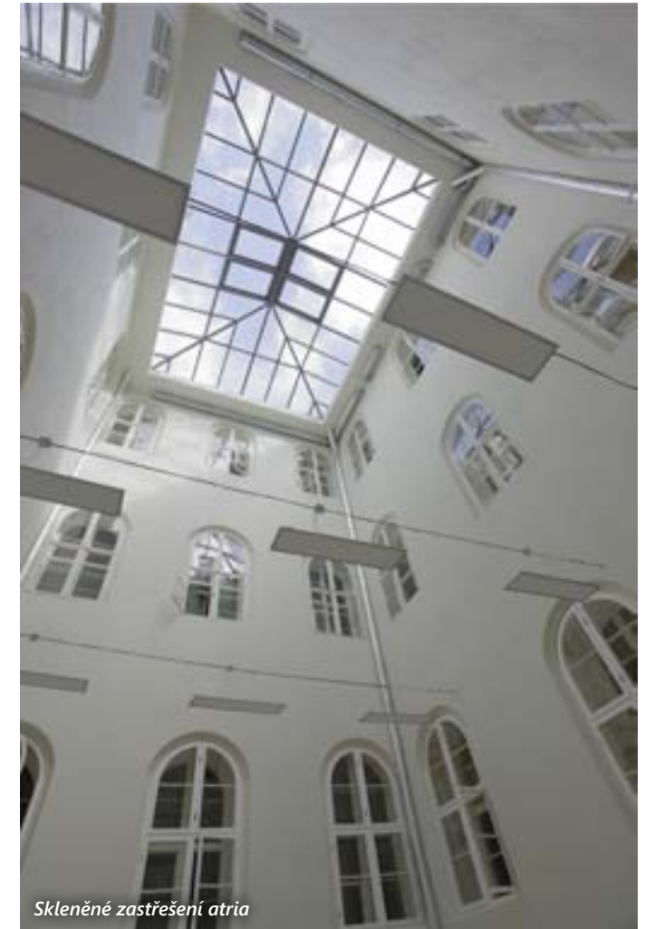
Skleněné zastřešení atria

založení reálky. Zpočátku se podařilo vymoci alespoň souhlas s ustavením dvouleté reálné školy, která navazovala na školu hlavní, s tím, že následně bude rozšířena na čtyřtřídní vyšší reálku. Po porážce revoluce a nástupu konzervativního Bachova režimu však bylo vše jinak. Plány na stavbu reálky na místě dnešní spořitelny na rohu Františkánské ulice a Kopeckého sadů vzaly za své. Nová naděje svitla až počátkem šedesátých let 19. století. Roku 1863 na žádost městského zastupitelstva povolil zemský sněm povýšení dvouleté reálné školy na školu čtyřletou se dvěma vyučovacími jazyky – českým a německým. Obec se rozhodla vyřešit provizorní umístění reálky v budově hlavní školy v Kopeckého sadech stavbou nového školního paláce. Prostředky byly částečně získány pomocí tzv. pivního krejcaru, tedy odvodem jednoho krejcaru z každého vytočeného mázu piva v Plzni a na