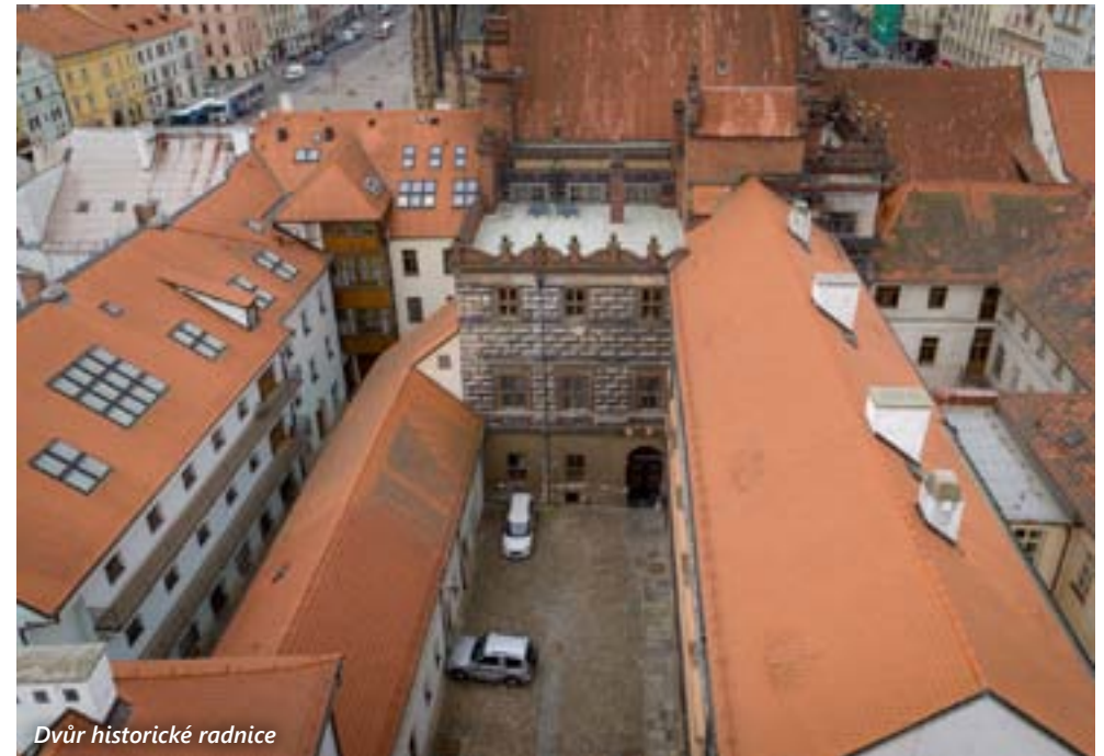
Dvůr historické radnice