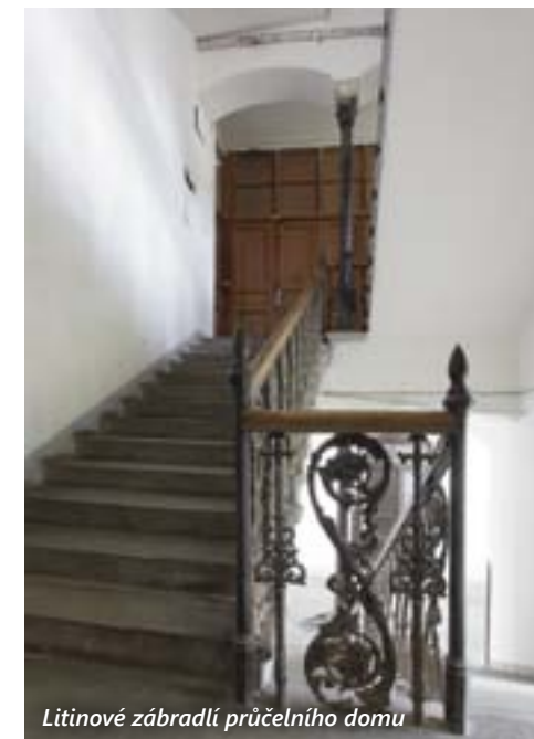
Litínové zábradlí průčelního domu

Celý objekt prochází v současné době podstatnou obnovou a ta čeká nejen zmíněné stavby, ale i dvůr a zahradu. Zatím do ulice září nová fasáda, která se zbavila letitých nánosů a znovu dává na odiv jednoduše své výtvarné výzdoby, zejména krásné prvky očistěného kamenného parteru. Průčelní dům je třípodlažní, v krajních polích prvního patra se do uličního prostoru vysouvají hranaté arkýře s postranními okny, uložené na mohutných konzolách esovitě prohnutých a ukončené ve druhém patře balkony, jejichž zábradlí má krásně baculaté kuželky. Pražské ulici se snad i tímto domem pomalu, ale jistě vrací důstojný vzhled ztracený v nedávné minulosti.