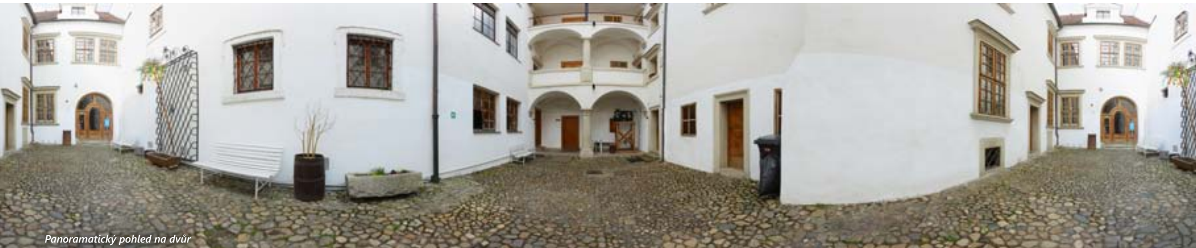
Panoramatický pohled na dvůr