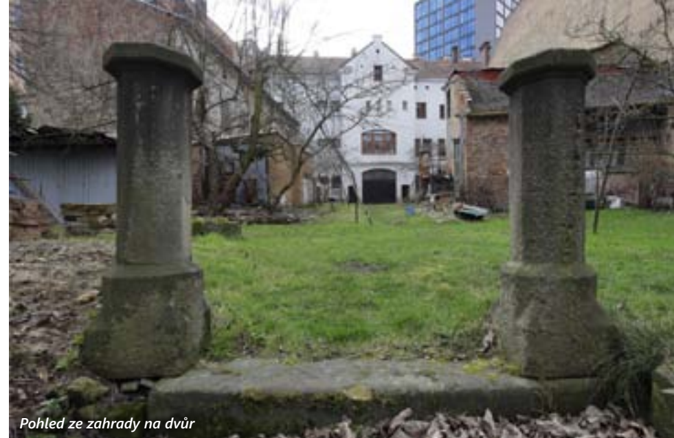
Pohled ze zahrady na dvůr