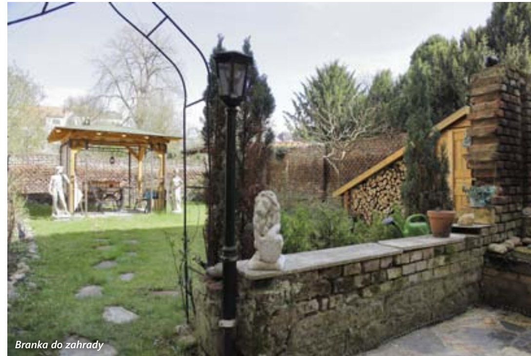
Branka do zahrady