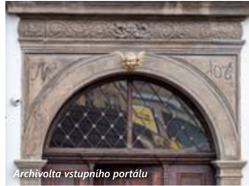
Archivolta vstupního portálu

Štíhlý dvoupatrový dům s iluzivním třetím patrem pod ušlechtilým renesančním štítem si do dnešních dnů podržel – s malými výjimkami – podobu, kterou mu vtiskl přelom 16. a 17. století. Skutečnou ozdobou je renesanční portál domovního vstupu v levé části průčelí. Patří mezi stylově nejčistší portály s půlkruhovou archivoltou na pilířích shora krytých plným korintským kladím v Plzni. Archivolta, pilířky