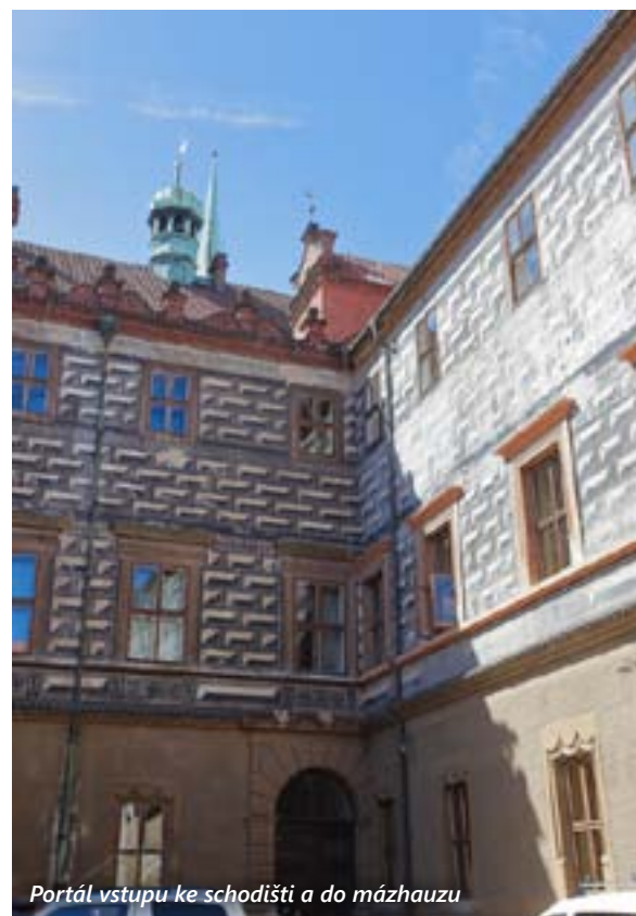
Portál vstupu ke schodišti a do mázhauzu

tři čtvrtiny města. Šlo tehdy o 130 domů v samém městě a 70 na předměstích. Obnova si vyžádala nemalé prostředky. K používání byly upraveny i méně zasažené prostory radnice, zejména její pozdně gotické dvorní křídlo. (Zde se dnes nalézá k roku 2015 zřízený Petákův sál, pojmenovaný po jednom