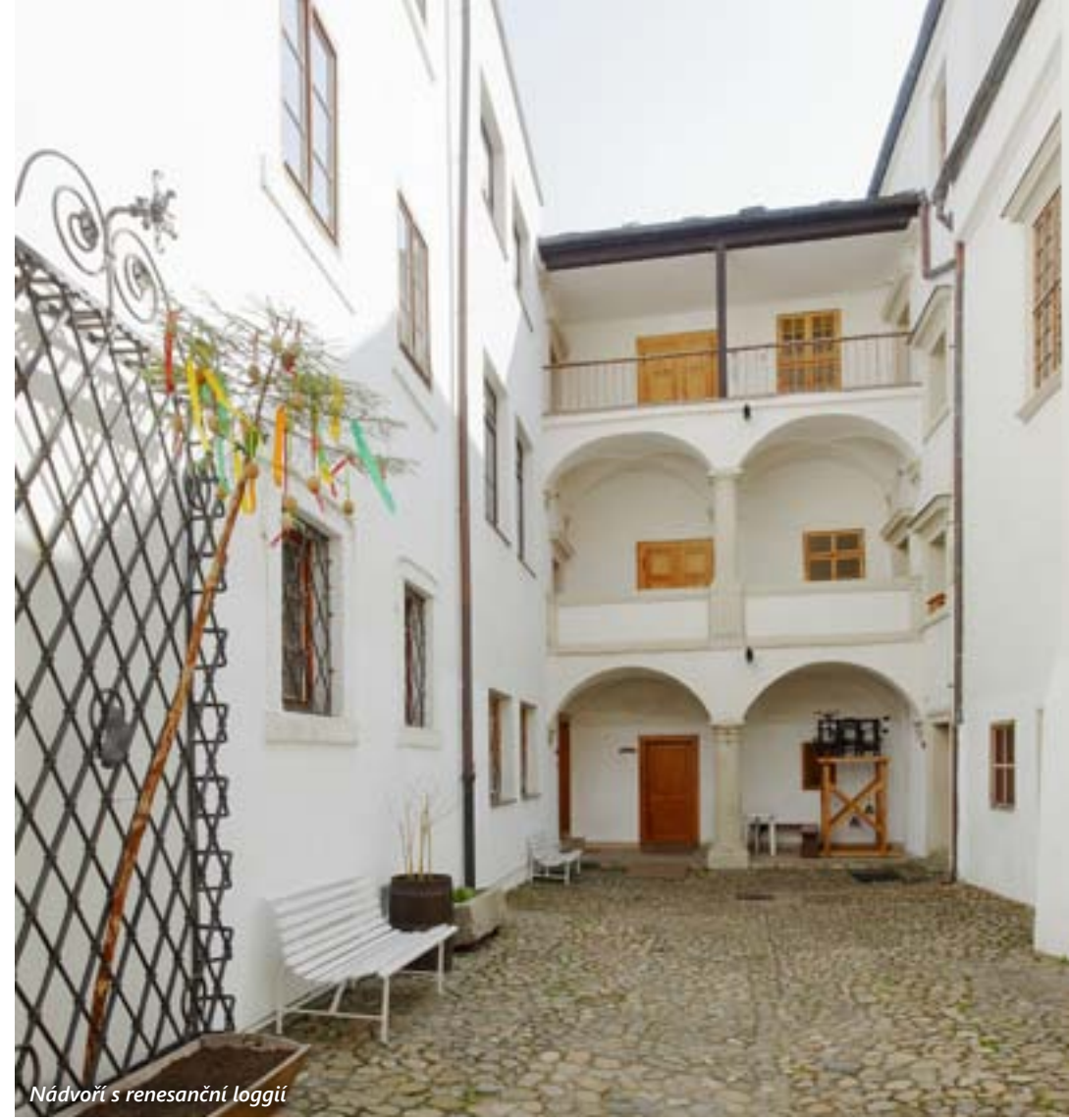
Nádvoří s renesanční loggií

Štíhlý dvoupatrový dům s iluzivním třetím patrem pod ušlechtilým renesančním štítem si do dnešních dnů podržel – s malými výjimkami – podobu, kterou mu vtiskl přelom 16. a 17. století. Skutečnou ozdobou je renesanční portál domovního vstupu v levé části průčelí. Patří mezi stylově nejčistší portály s půlkruhovou archivoltou na pilířích shora krytých plným korintským kladím v Plzni. Archivolta, pilířky