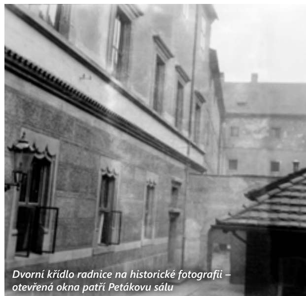
Dvorní křídlo radnice na historické fotografii – otevřená okna patří Petákovu sálu

Netrvalo však dlouho a radnice i se svým archívem historických písemností padla za oběť ohni při sérii tří úmyslně založených požárů v roce 1507, které zničily téměř