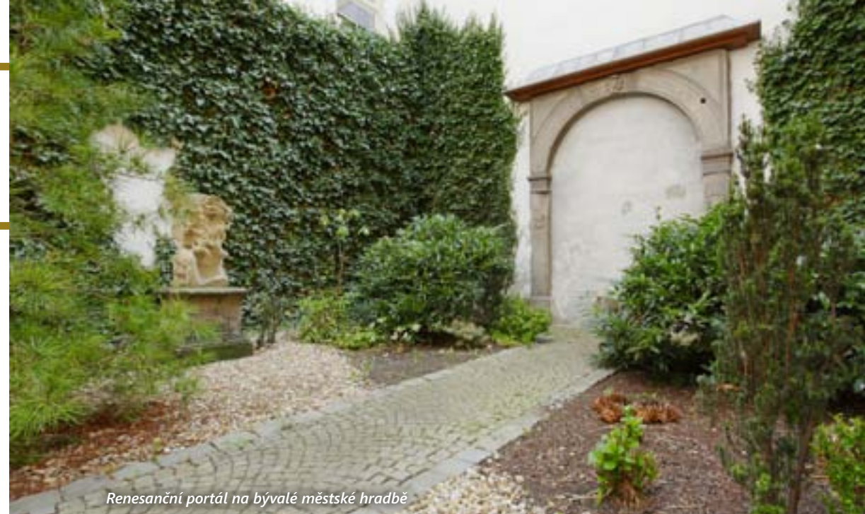
Renesanční portál na bývalé městské hradbě