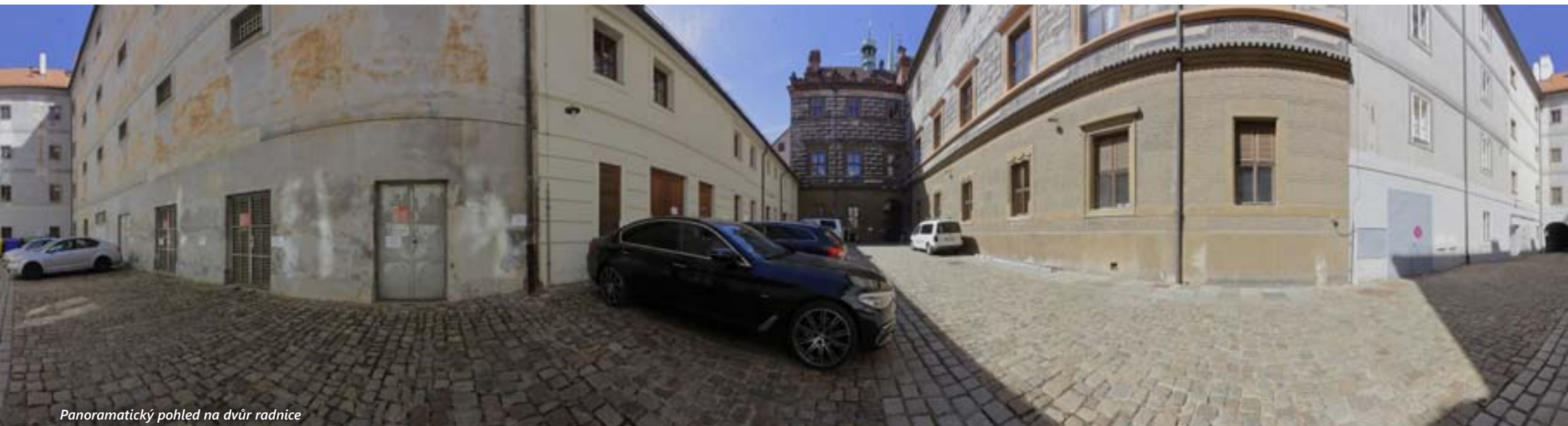
Panoramatický pohled na dvůr radnice

Severní straně plzeňského náměstí vévodí historická budova radnice, druhá dominanta místa po chrámu sv. Bartoloměje, jejíž vykrajované štíty s korouhvičkami a čučky jsou ozdobou plzeňské panorámy. Po právu bývá označována za jednu z nejkrásnějších radničních budov u nás, podle znalce architektury radničních budov Karla Kíbice dokonce za tu nejkrásnější. Její sgrafitované průčelí vypráví střípky