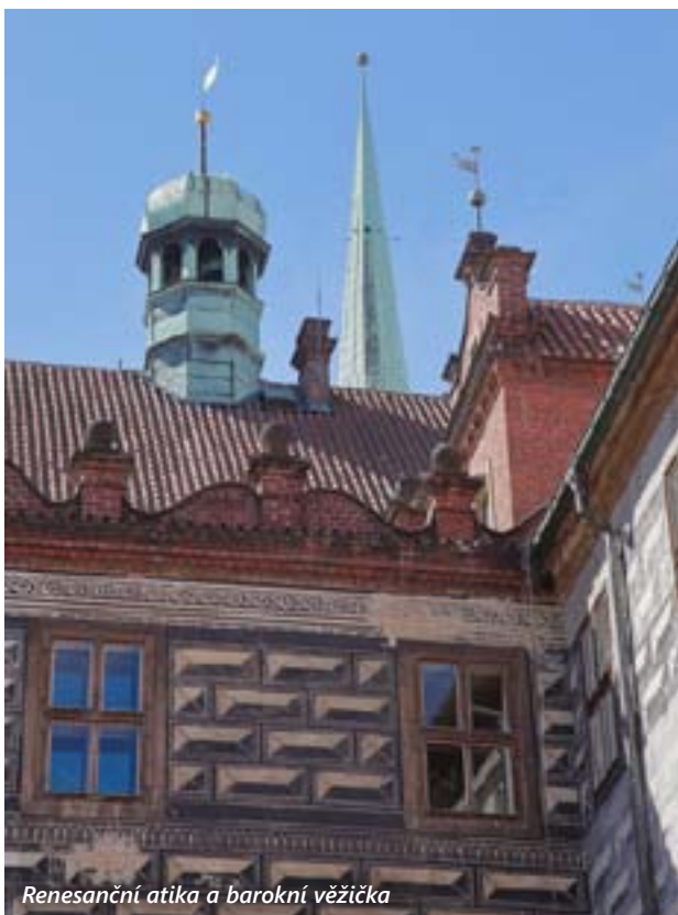
Renesanční atika a barokní věžička

z bohaté více než sedmisetleté historie města. První správcové města, královští rychtáři, vykonávali svou funkci z vlastních domů, potřeba samostatných objektů pro výkon přenesené moci vyvstala až později. Na náměstí bychom našli řadu domů, v kterých po určitou dobu radnice sídlila.