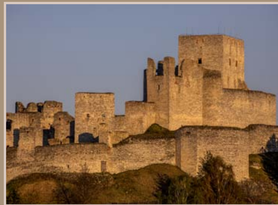
Romantická zřícenina hradu Rabí mnohokrát posloužila filmařům