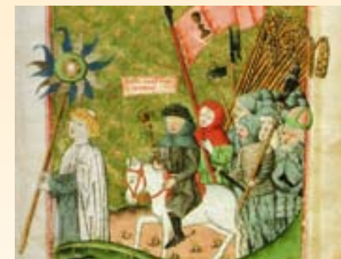
Jan Žižka v čele vojsk – iluminace z Jenského kodexu