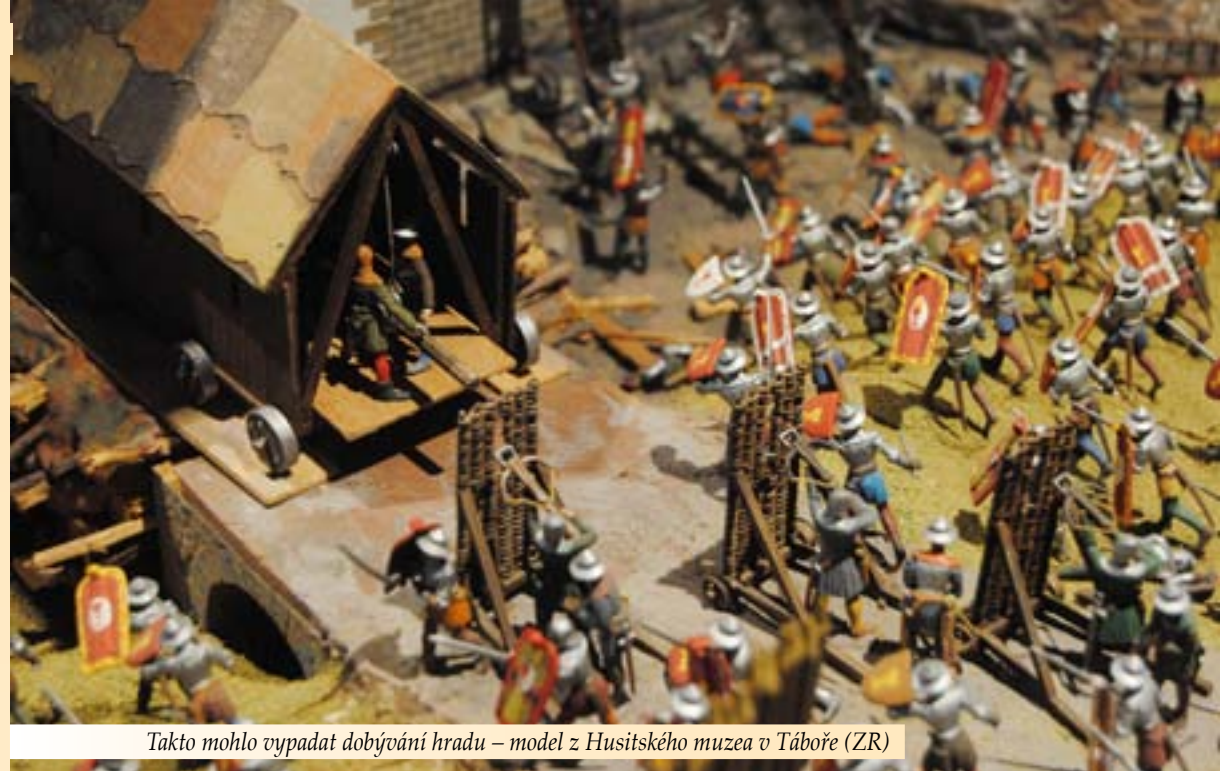
Takto mohlo vypadat dobývání hradu – model z Husitského muzea v Táboře (ZR)

Žižkovu zranění na Rabí odpovídá pravá oční na časlavské kalvě. Odborným jazykem řečeno byly na lebce nalezeny stopy po vyhojení poškozené okostice nad pravou očníci nebo opouzdřelého hematomu, který vznikl tupým úderem na oční krajinu. Tupý úder byl veden na horní okraj pravé očníci, vzhledem k chybějícímu obličejovému skeletu nelze zjistit, zda současně došlo k poškození vlastního oka či pravé tváře zraněného. Na kalvě byl zjištěn poškozený nadočnicový oblouk na oválné ploše 29 × 19 mm. Ploška je vůči okolí ostře ohraničena, což nasvědčuje hojení opouzdřelého hematomu – krevního výronu. Došlo tedy k poškození nebo odtržení okostice od povrchu kosti způsobené tupým úderem na krajinu pravého oka. Toto poranění vzniklo a vyhojilo se nedlouho před smrtí jedince. Tolik odborná práva.