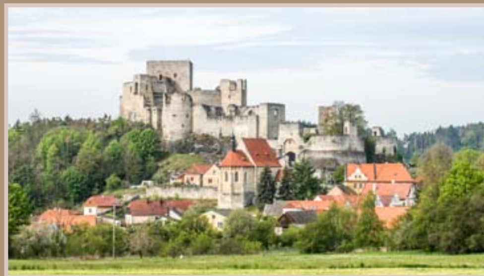
Celkový pohled od východu