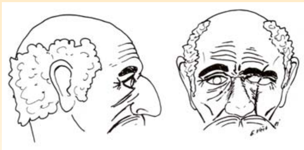
Rekonstrukce podoby (snad Jana Žižky) dle časlavské kalvy – převzato z publikace E. Vlčka Jak zemřeli

Otázce Žižkova zranění u Rabí a jeho následkům se věnoval i velmi významný český antropolog prof. MUDr. Emanuel Vlček, DrSc. Detailnímu zkoumání podrobil tzv. časlavskou kalvu – nekompletní lebku (zachovaná zůstala pouze mozkovna a část obličejového skeletu), která je podle tradice připisována Janu Žižkovi z Trocnova. Byla zazděna v tajném úkrytu v časlavském kostele a spolu s dalšími kosterními pozůstatky byla nalezena až počátkem 20. století. Po desítky let pak bylo předmětem sporů odborníků, zda se jedná, či nejedná o pozůstatek husitského hejtmana. Odpověď dal až antropologický průzkum, podle něhož je časlavská kalva s velkou pravděpodobností autentickým pozůstatkem Jana Žižky z Trocnova.