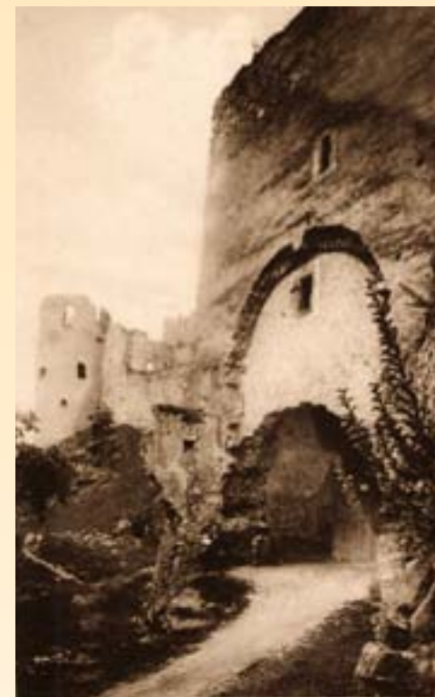
Pohlednice z roku 1927 – třetí hradní brána

Bratři Švihovští byli po vzoru svých předků politicky orientováni na bavorské vévody. Jejich zájmy hájili mezi českou šlechtou (dnes bychom řekli, že za vévody lobbovali) a brali za to stálý plat. Význam tohoto spojení vzrostl zejména v roce 1526, když český král Ludvík Jagellonský zahynul 29. srpna v bitvě u Moháče a bylo nutno řešit otázku, kdo zasedne na uprázdněný český královský trůn. Švihovští pak s velkým úsilím podporovali kandidaturu synů Albrechta IV., bavorských vévodů Viléma a Ludvíka, na českého krále proti habsburskému Ferdinandovi a získávali pro tuto kandidaturu českou šlechtu. Sliby ani penězi se nešetřilo. Na stranu bavorských vévodů získali i svého švagra Zdeňka Lva, nejvyššího purkrabího a nejvlivnějšího velmože své doby. Korespondenci mezi Švihovskými a bavorskými vévodami tehdy obstarávali čeští