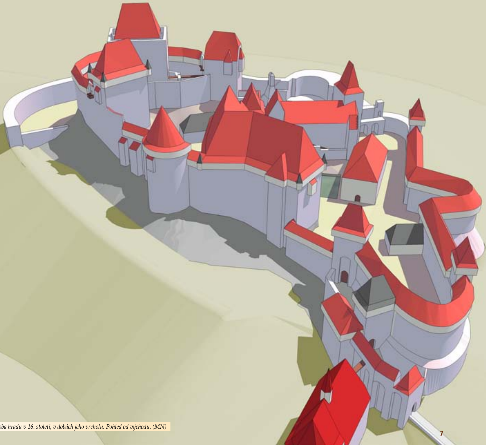
Podoba hradu v 16. století, v dobách jeho vrcholu. Pohled od východu. (MN)