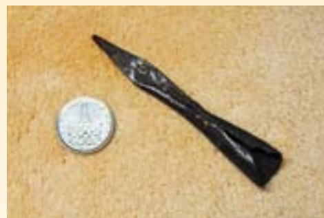
Originální středověký hrot střely z kuše. Právě takovou střelou byl Žižka zřejmě přímo nebo nepřímo zraněn.

Co z toho všeho plyne pro historická bádání o Žižkově zranění u Rabí? Na základě výsledků průzkumu tzv. časlavské kalvy jakožto pravděpodobného pozůstatku Jana Žižky z Trocnova můžeme říci, že Žižka byl u Rabí zraněn nejspíše do pravého oka. Nejednalo se o přímé střelné poranění, ale o tupý úder směřující na horní okraj pravého oka – tříska ze stromu by takovému zranění odpovídala. Ale nejen ta, Žižku mohl zasáhnout i šíp, ovšem nikoli hrotem, ale svým tělem (např. vystřelený šíp se odrazil od překážky a druhotně svým tělem a s daleko menší intenzitou zasáhne Žižku do obličeje), tj., mohl být střelou uhozen, nikoli zasažen. Je dost možné, že tupým úderem bylo zasaženo i vlastní oko. Kromě oka byly jistě pohmožděny i tkáně v bezprostředním okolí oka, což způsobilo krevní výron a otok postiženého místa.