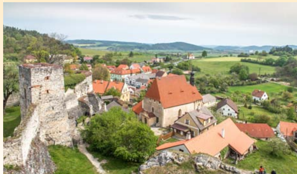
Pohled z Břeňkova paláce na příhrádek a kostel Nejsvětější Trojice