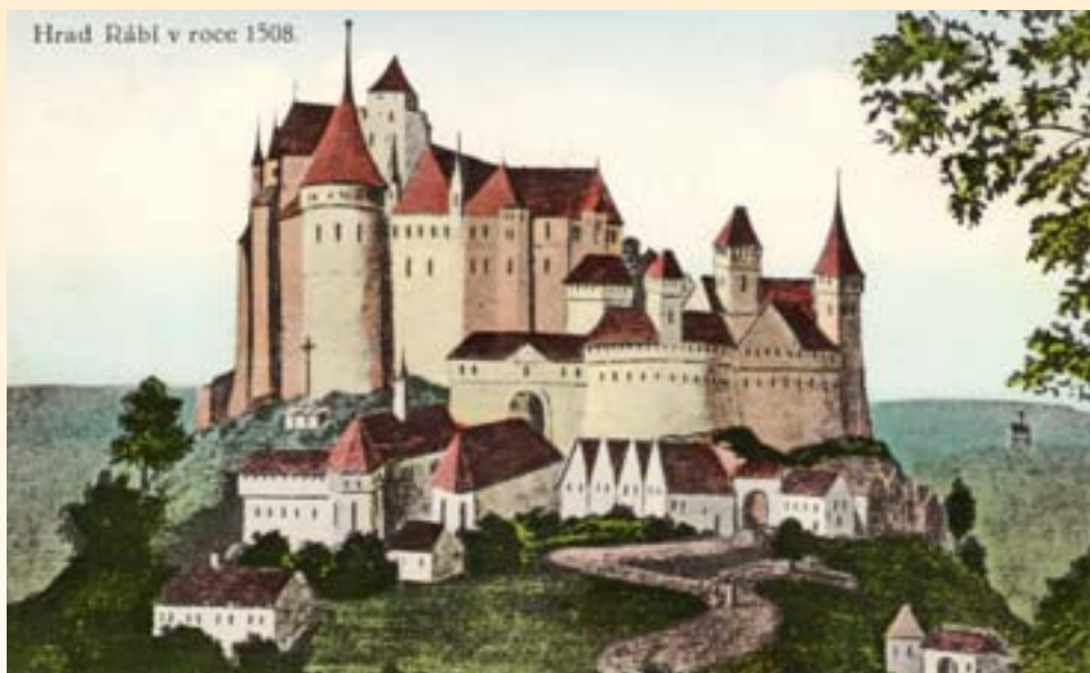
Pohlednice patrně z dvacátých let 20. století zobrazuje hrad v dobách jeho největší slávy na začátku 16. století