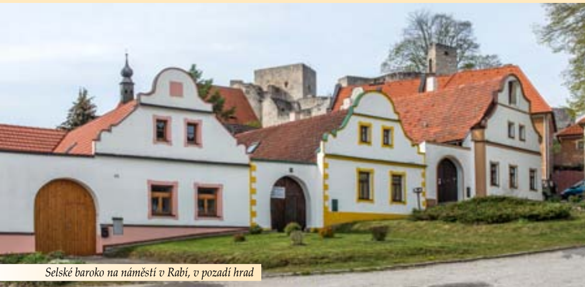
Selské baroko na náměstí v Rabí, v pozadí hrad

Jak chtěl zahnat psa, aby si mohl nabrat zlaté mince, odepnul řemen a hodil jím po psu. Ale dobře to nedopadlo. Pes skočil po kováři a povalil jej. Co bylo dál, už kovář nevěděl, protože hrůzou omdlel.