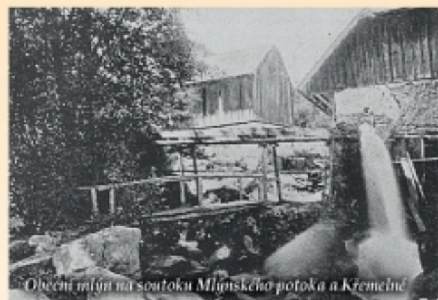
Obecní náměstí na soutoku Mlýnského potoka a Křemelny

Bývalé osídlení dnes připomíná jen několik zplanělých keřů rybízu usilovně bojujících o přežití.