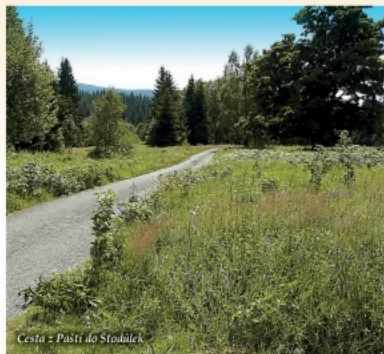
Cesta z Paští do Stodůlek