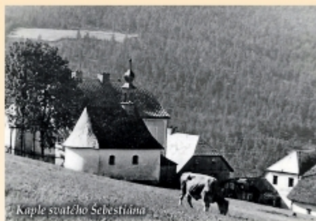
Kaple svatého Sebestiána

Bohužel tento stav trval jen několik let.