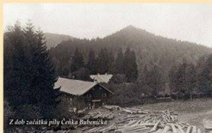
Z dob začátku pily Čeňka Bubeníčka