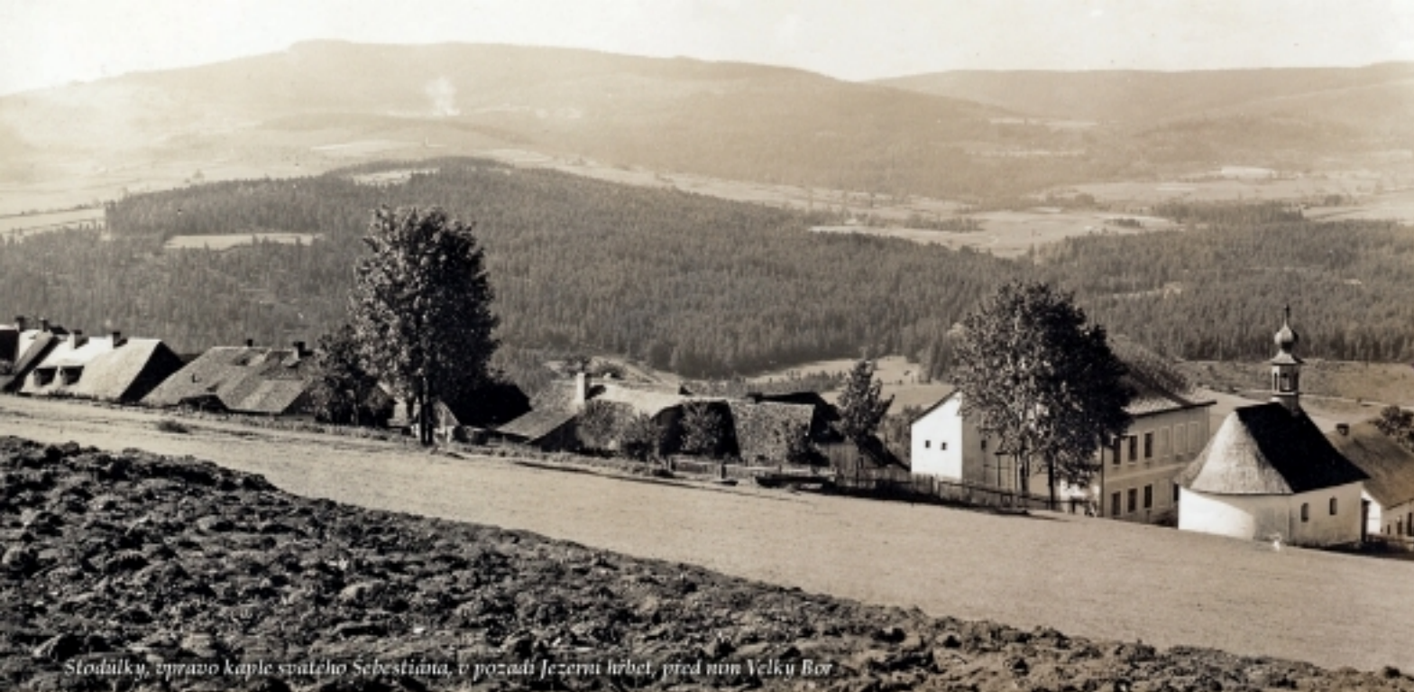
Stodůlky, úpravo kaple svatého Sebestiána, v pozadí Jezerní hřbet, před ním Velký Bor