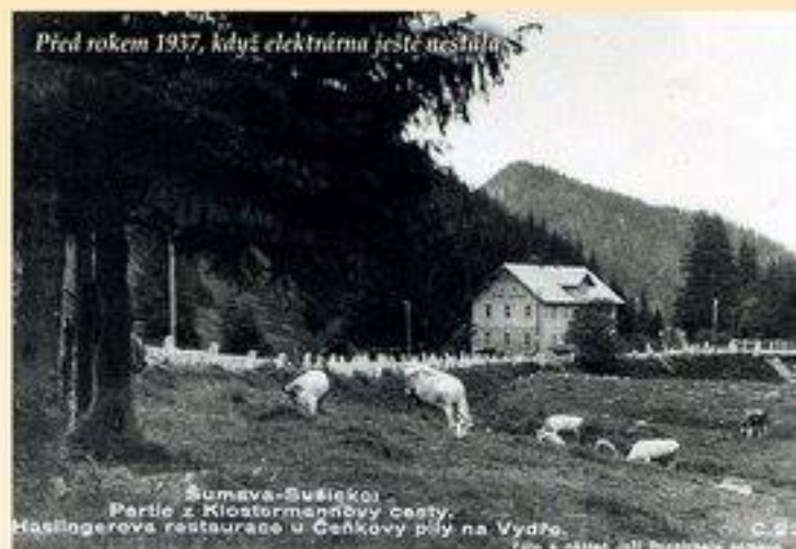
Před rokem 1937, když elektrárna ještě neslula