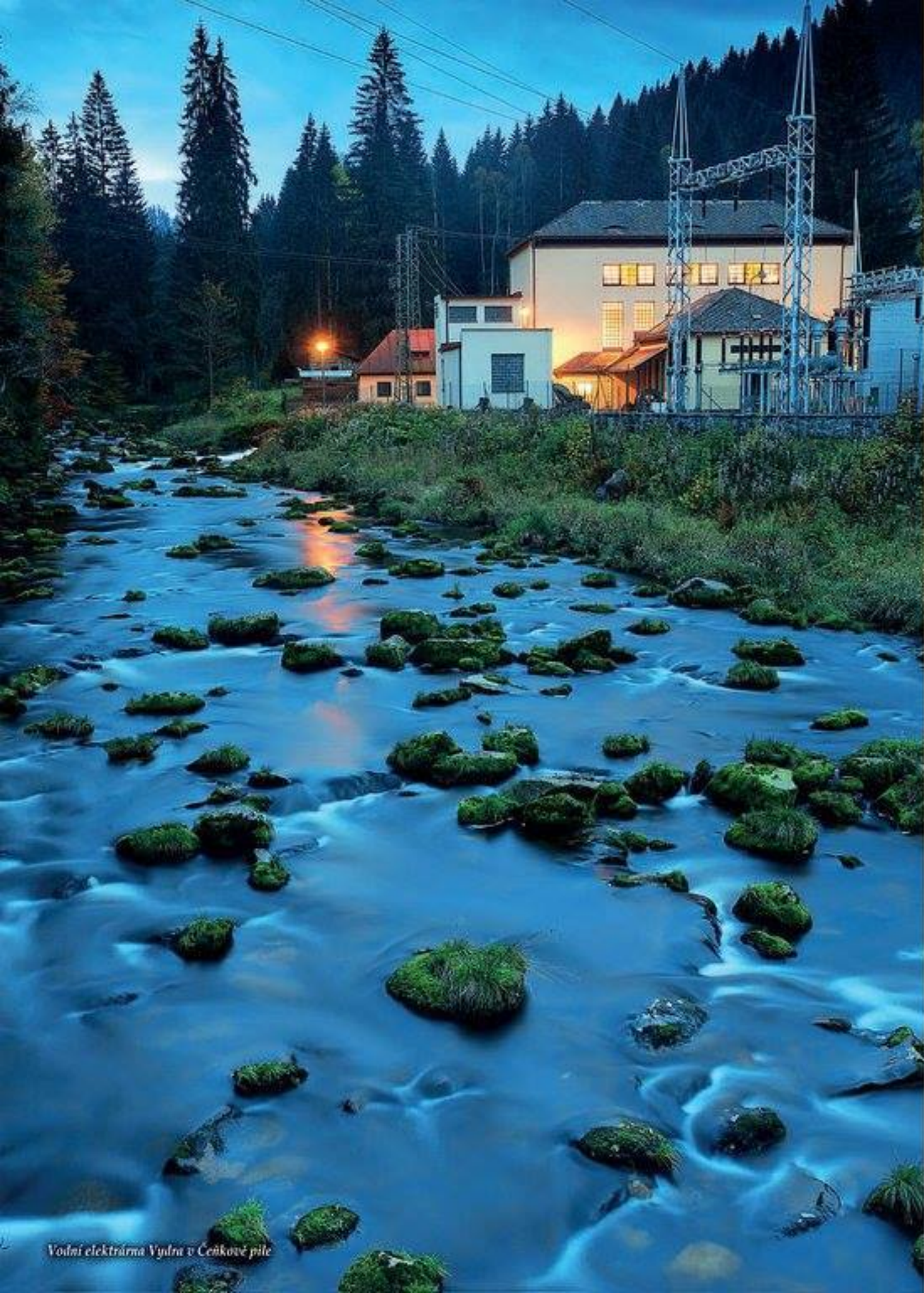
Vodní elektrárna Vydra v Čeňkové pila