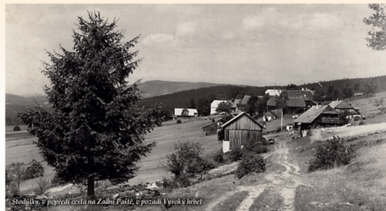
Stodůlky, v popředí cesta na Zadní Paště, v pozadí Vysoký hřbet